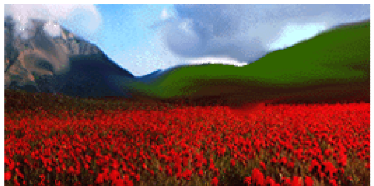
دشتی در کوهپایه های زاگرس

سه رشته کوه ایران را احاطه میکنند: کوه های سبلان و تالش در شمال غربی، رشته کوه بلند و بسیار کهن زاگرس (متعلق به دوران ژوراسیک) در غرب و جنوب غربی و رشته کوه البرز در شمال که دماوند، بلندترین قله ایران با ۵۶۷۰ متر ارتفاع را شامل می شود. در مرکز ایران نیز دو بیابان وسیع به نام دشت کویر (با بیش از ۲۰۰ هزار متر مربع) و دشت لوت (۱۶۶ هزار متر مربع) قرار دارد.