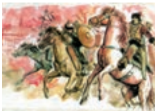
حمله چنگیز به ایران

نکته درسی → از مرگ آخرین ایلخان مغول (ابوسعید)، حکومت ایلخانان فرو پاشید. ایران بار دیگر گرفتار هرج و مرج، آشوب، جنگ و قتل و غارت‌های بی حساب شد؛ یکپارچگی و اتحاد سیاسی کشور ما از بین رفت و حاکمان محلی و سرداران مغول و غیرمغول، هر کدام بر بخشی از آن مسلط شدند و با یکدیگر به رقابت و ستیز برخاستند.