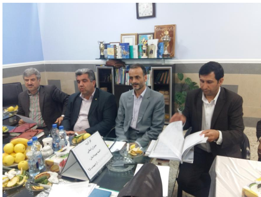
هم اندیشی مدیران سرگروه در خصوص طرح و برنامه های کمیته ی بهبود - مدیران همیار - تعالی مدیریت