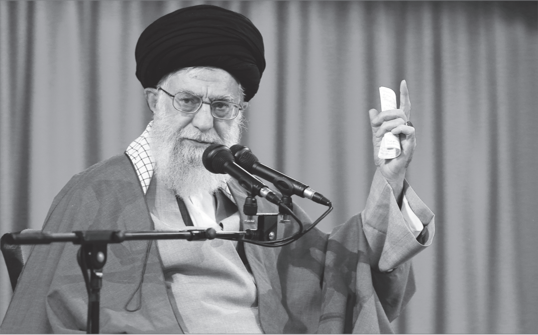
آیت‌الله العظمی‌علیه‌السلام امام خمینی در جریان سخنرانی در مسجد اعظمتهران، ۱۳۵۹

می‌گذارد، نه؛ مردم آگاهند، می‌فهمند، نمی‌پذیرند این حالت‌را.