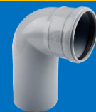
زانو بلند ۸۷ درجه