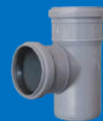
سه راهی ۸۷ درجه