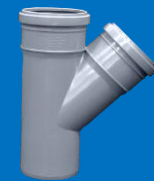
سه راهی ۴۵ درجه