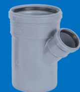
سه راهی تبدیل ۴۵ درجه