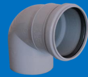
زانو ۸۷ درجه