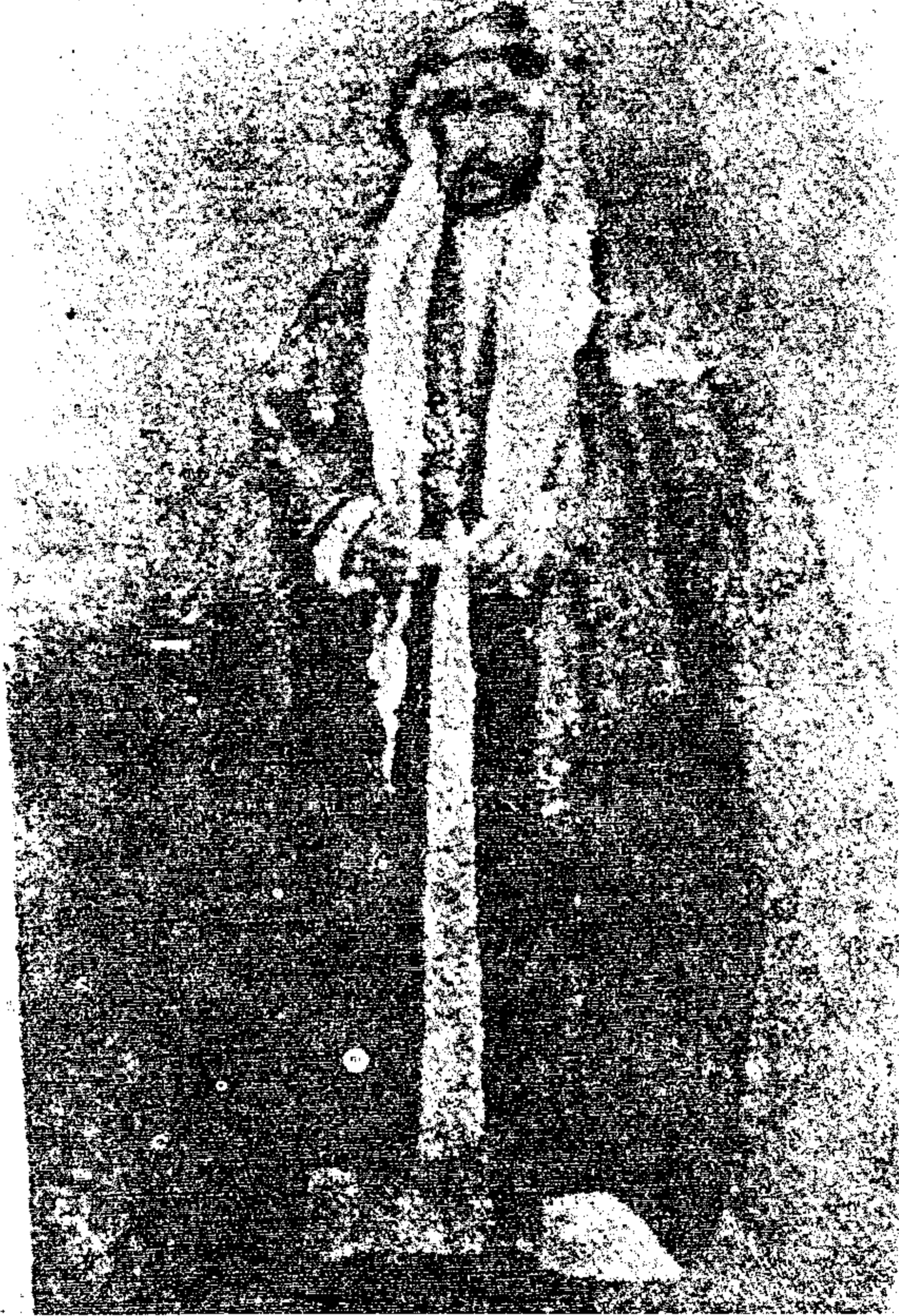
الشيخ مبارك بن صباح