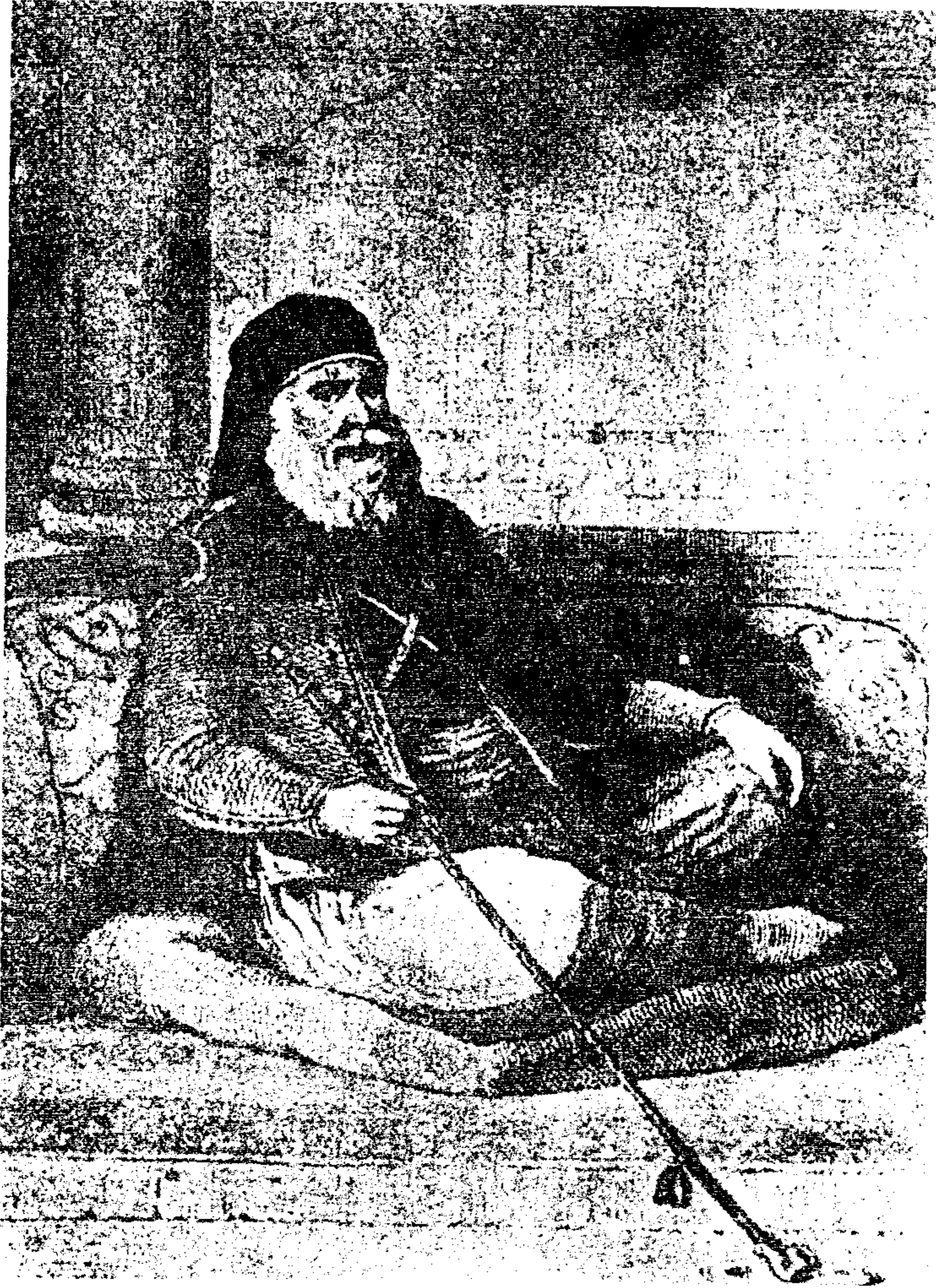
محمد علي باشا الكبير