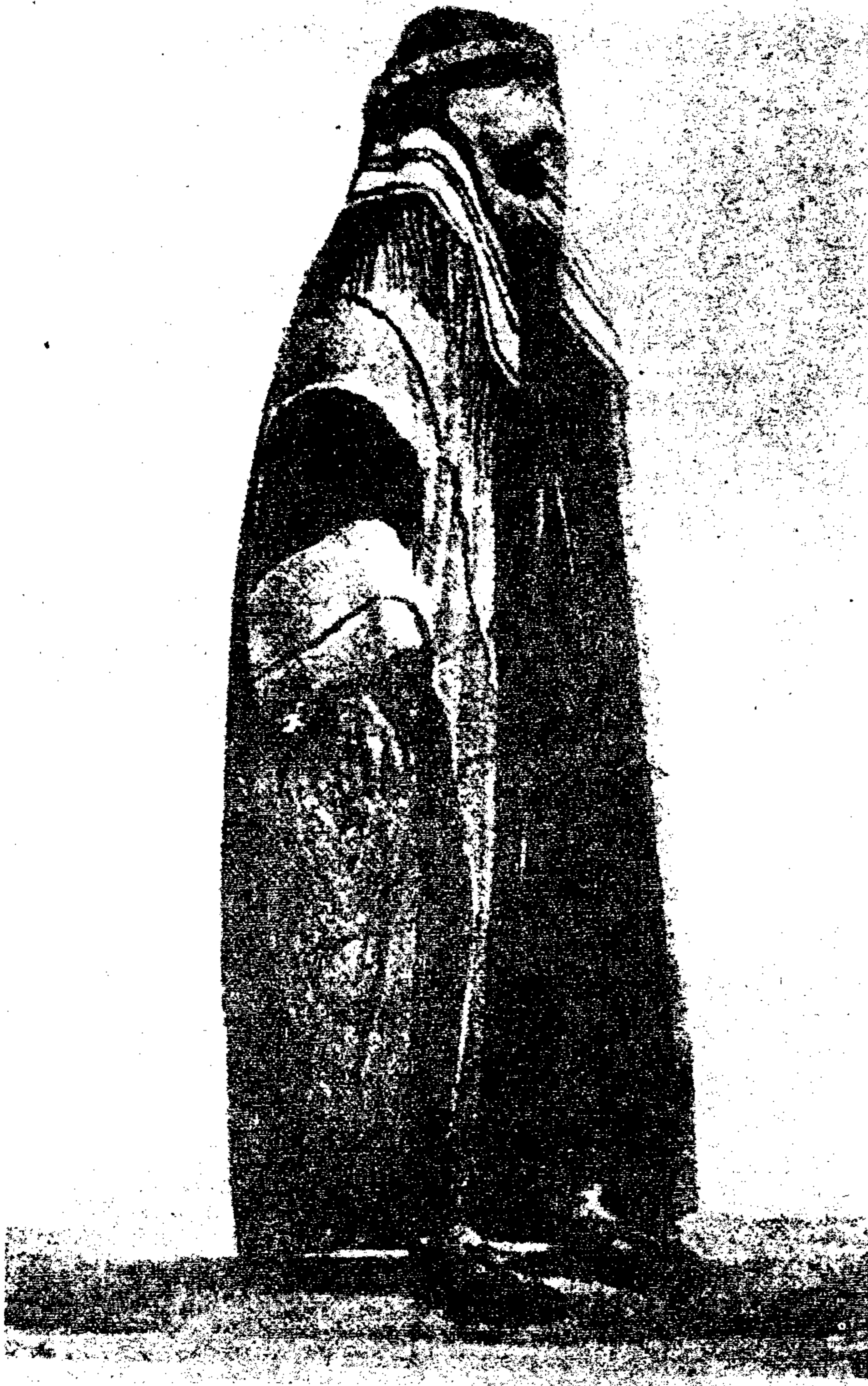
عبد الله (الاول) ابن سعود