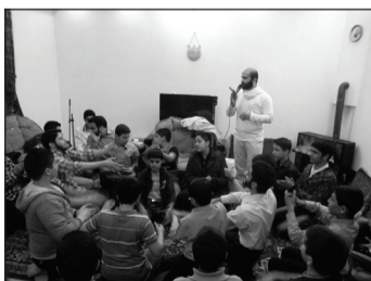
• جشن میلاد امام زمان(عج) در هیئت یائاترات (۱۳۹۲)