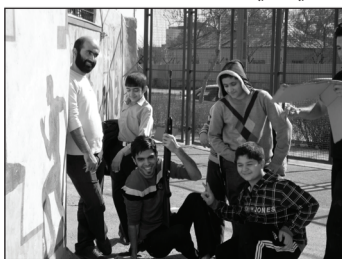
• مسابقه تیراندازی