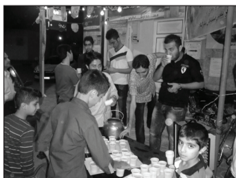
• نیمه شعبان ۱۳۹۲