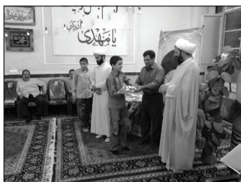
• اهدای جوایز طرح تابستانی سال ۱۳۹۲