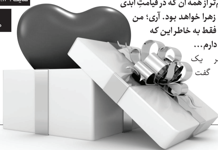
در قالب تصویر تصاویری که مایلید با هم‌سنگران‌تان به اشتراک بگذارید برای ما ارسال کنید...