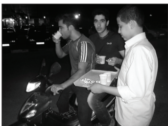
• نیمه شعبان ۱۳۹۲