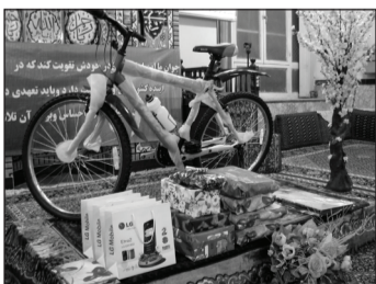
• جوایز طرح تابستانی