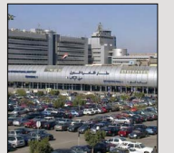
آغاز پروازهای قاهره - تهران پس از ۳۴ سال

کارشناسان در تهران عقیده دارند آمریکایی‌ها به هیچ‌وجه راضی به دور شدن منافقین از مرزهای ایران نیستند چرا که عقیده دارند کارکرد اصلی این گروهک استفاده از منابعش در داخل ایران برای کمک به پروژه‌های اطلاعاتی است و این کارکرد با دور شدن از مرزهای ایران کم‌رنگ خواهد شد.