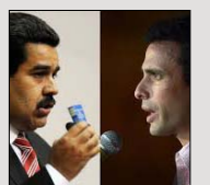
اعلام آغاز مبارزات انتخاباتی رقیب‌های اصلی انتخابات ریاست جمهوری ونزوئلا