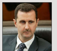
مواضع علمای سوریه باعث شکست توطئه‌های غرب شد