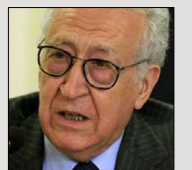
ارسال سلاح به سوریه، به پایان بحران این کشور کمکی نخواهد کرد