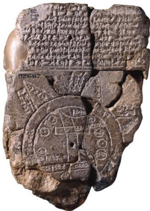
(نمونه ای از نقشه ی باستانی)

اعراب دوره عباسی علم جغرافیا را از دانشمندی یونانی به نام بطليموس گرفتند و در عین حال چیزهای زیادی به این علم افزودند. آن ها در علم جغرافی به تحقیق و جستجو از طریق سفرها و رصد آسمان پرداختند. - اعراب نامدار در علم جغرافیا: الیعقوبی، المسعودی، المقدسی و ابن خردادبه.