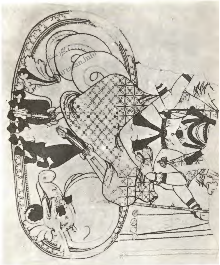
الاهة چهار دست، دیوار نگاره شهر پتختکنه، صحنه دوم.