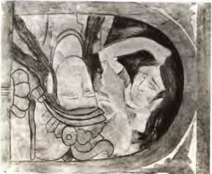
مجلس سوگوری، دیوارنگاره شهر پنتیکند.