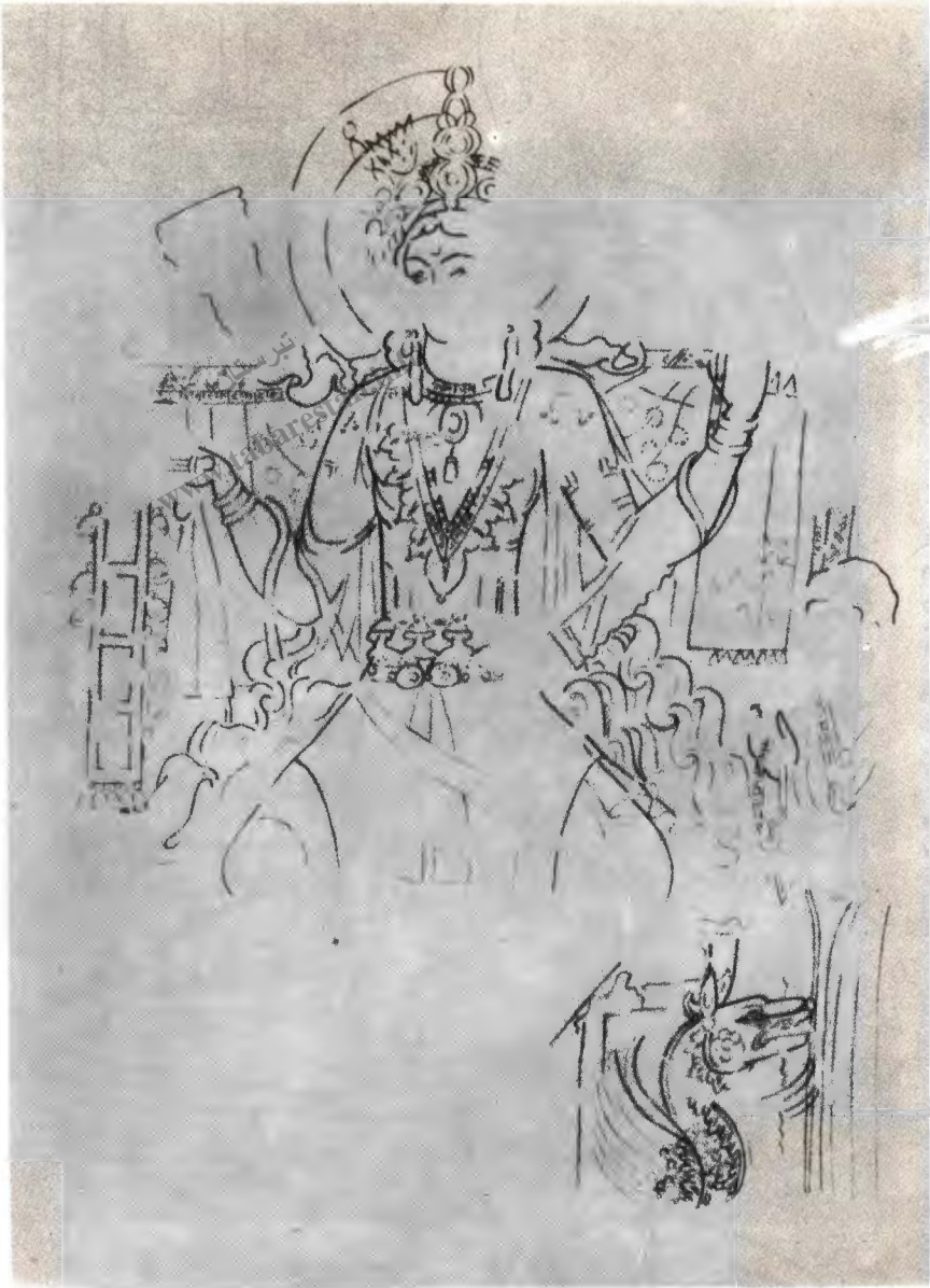
الاهة دو دست، دیوارنگاره شهر پنجکند، معبد دوم.