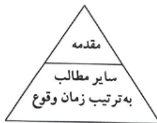
نمودار تنظیم خبر به شیوه سبک تاریخی

این سبک، همانگونه که نام آن گواهی می دهد، تلفیقی از دو سبک هرم وارونه و سبک تاریخی است و خاص پوشش دادن به خبرهای شهری و حادثه ای می باشد. برای اینکه تصویری از سبک تاریخی به همراه لید در ذهن پیدا کنیم، بهتر است بگوییم که اگر شکل سبک تاریخی که در آن مطلب از نقطه ای که شروع می شود به ترتیب زمان وقوع ارائه می شود به صورت زیر باشد: