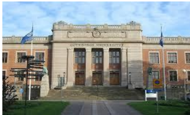
شکل(۱) دانشگاه گوتنبرگ

چالمرز در قلب شهر گوتنبرگ واقع است. این دانشگاه در زمینه ی علوم طبیعی، تکنولوژی و معماری فعالیت دارد. چالمرز با کمپانی های سوئدی همکاری در زمینه ی آموزش دارد و امید وار است در آینده ی نزدیک خود را در زمینه های فناوری اطلاعات، نانوتکنولوژی و Bioscience قدرتمند تر کند. چالمرز در سال ۱۸۲۹ توسط نیکوکار سوئدی به نام ویلیام چالمرز تاسیس شد و امروزه یکی از بهترین دانشگاه های صنعتی در اروپا است. (فرجاد، ۱۳۸۲، ص ۳۶۶ و ۳۶۷)