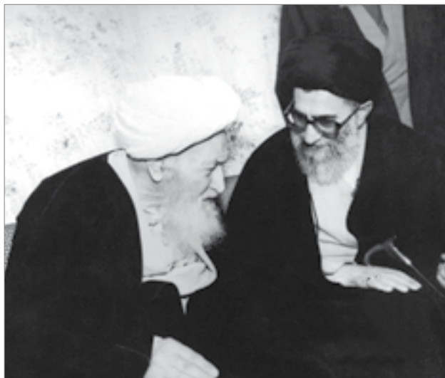
دیدار رهبر انقلاب با مرحوم آیت‌الله العظمی محمدعلی اراکی در اوایل دهه هفتاد

میل به رفتارهای قبیله‌ای در میدان سیاست، در میدان اقتصاد، از دیگر نقاط ضعف ماست. رفتار قبیله‌ای معنایش این است که تخطئه یا تأییدی که نسبت به کار کسی می‌کنم، ناشی نباشد از ماهیت عمل او؛ ناشی باشد از نحوه‌ی ارتباط او با من. اگر از قبیله‌ی ما کسی کار خطائی انجام داد، راحت قابل اغماض باشد؛ اما از قبیله‌ی مقابل اگر همان کار را انجام داد، این قابل پیگیری و تعقیب می‌شود. کار خوب اگر از کسی که مربوط به قبیله‌ی ماست، انجام گرفت، قابل تحسین و تشویق باشد؛ اگر از قبیله‌ی دیگر بود، نه. رفتار قبیله‌ای این است. این رفتار، اسلامی نیست، انقلابی نیست. ما متأسفانه اینگونه رفتار را در میان خودمان داریم. ۹۰/۵/۱۶