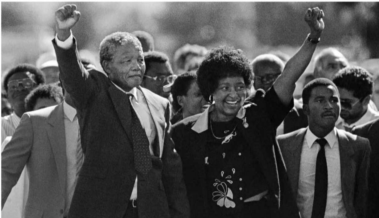
نلسون ماندلا در راهپیمایی آزادی پس از بیش از دو دهه در زندان، در کنار وینی مادیکیزلا- ماندلا، همسر خود در آن زمان، / ۱۱ فوریه ۱۹۹۰، پارل، آفریقای جنوبی