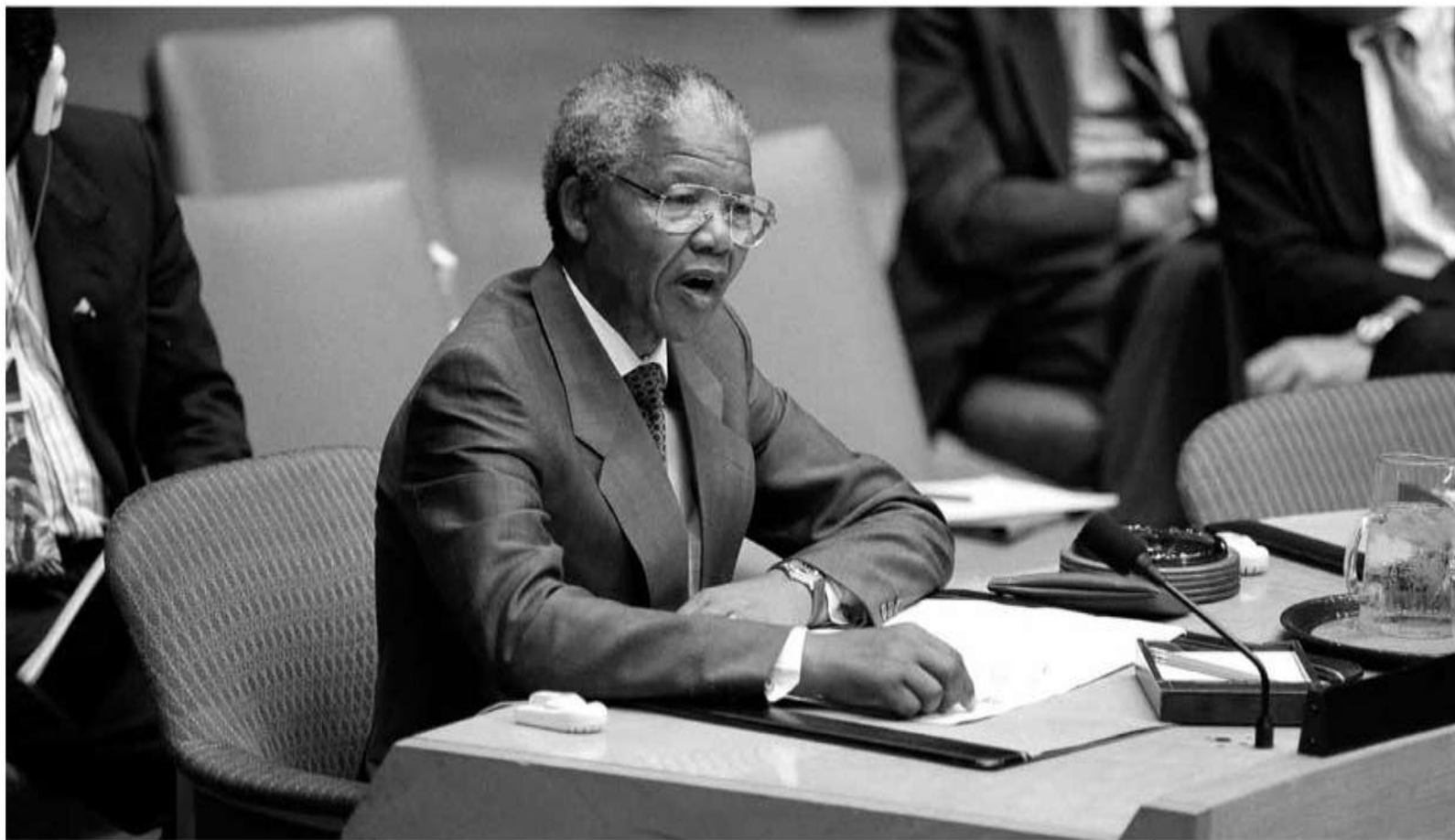
سخنرانی نلسون ماندلا، رئیس کنگره ملی آفریقا، خطاب به شورای امنیت / ۱۵ ژوئیه ۱۹۹۳، سازمان ملل متحد، نیویورک، ایالات متحده آمریکا