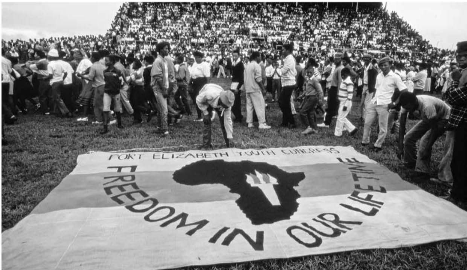
سوگواران در مراسم تشییع جنازه کسانی که در شهرک لانگیا در یونینهاگ به دست پلیس آفریقای جنوبی کشته شدند/ ۲۱ مارس ۱۹۸۵، استان کیپ، آفریقای جنوبی