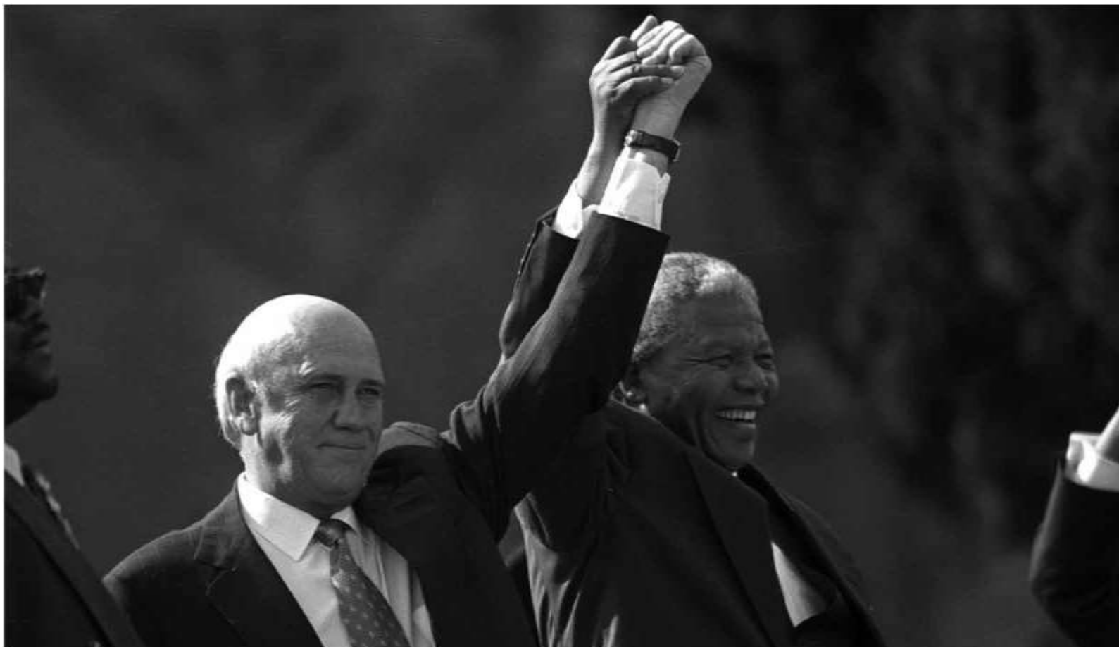
پرزیدنت اف دلیو. دکلرک رییس سابق کشور و نلسون ماندلا پس از مراسم افتتاح ریاست جمهوری ماندلا / ۱۰ مه ۱۹۹۴، پره توریا، آفریقای جنوبی