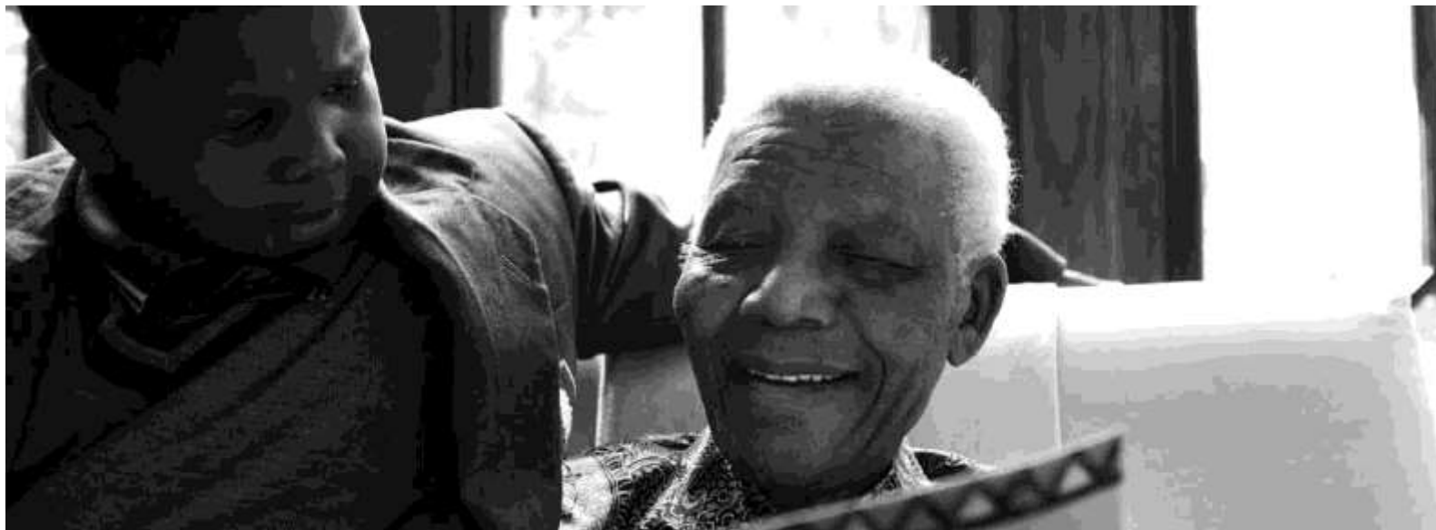
بنیاد نلسون ماندلا/ متیو ویلمن

سخنرانی در جریان هفته تمرکز بر ماسکاخانه، بوتاول، آفریقای جنوبی، ۱۴ اکتبر ۱۹۹۸