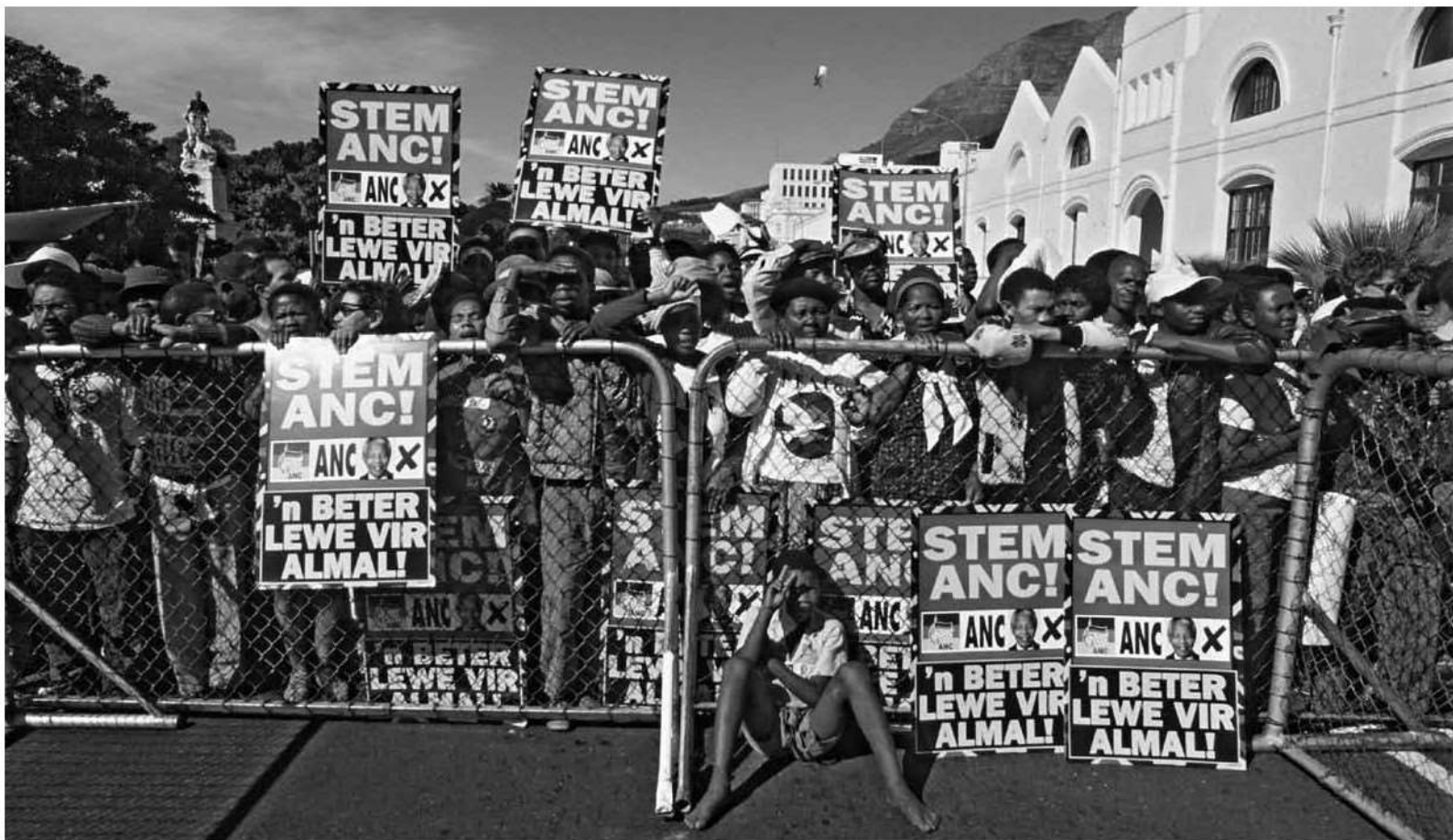
جمعیت شادمان از پیروزی به سخنان نلسون ماندلا در افتتاحیه ریاست او به عنوان نخستین رئیس جمهوری سیاهپوست آفریقای جنوبی گوش می دهند. / ۱۰ مه ۱۹۹۴، پره توریا، آفریقای جنوبی