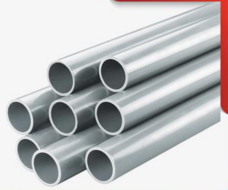
لوله های ناودانی