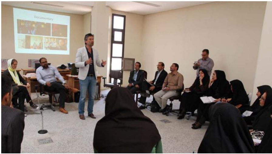
کارگاه‌های آموزشی با حضور اساتید داخلی و خارجی (کارگاه آموزشی تیم هلندی)