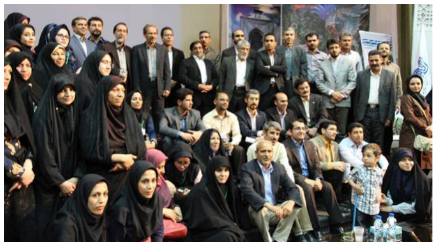
حضور صمیمانه اعضای انجمن فلسفه تعلیم و تربیت ایران در همایش پنجم