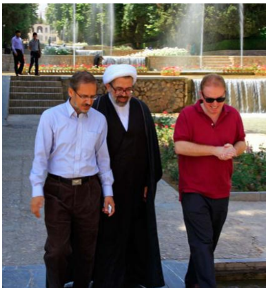
بازدید میهمانان همایش از آثار تاریخی کرمان: باغ شاهزاده/ ماهان