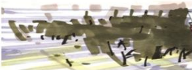
نمایش درخت با فطوط ضخیم ماژیک