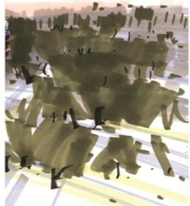
نمایش درختان با زاویه دید بالا