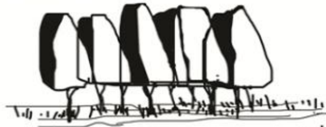
نمایش درخت با فطوط پیوسته