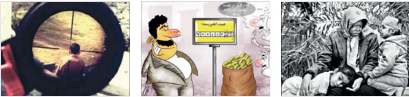
عکسی که چینیایی شد؛ کودک فلسطینی هدف تک تیرانداز اسراییلی / قیمت‌های خنده نداره / فارس / زندگی سیمیه و دخترش رعنا، قربانیان اسیدپاشی

شهروندان محترم تهرانی جهت اشتراک روزنامه با تلفن ۸۸۹۶۷۳۹ تماس حاصل فرمائید.