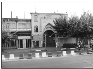
۱۲. مسجد شفا