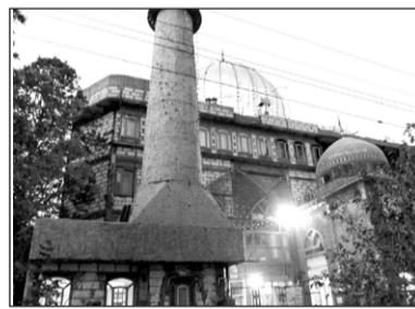
۱۵. مسجد فائق