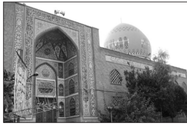
۳. مسجد المهدی عجل الله فرجه