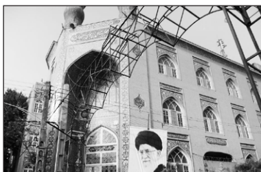
۸. مسجد حضرت علی بن موسی الرضا علیه السلام