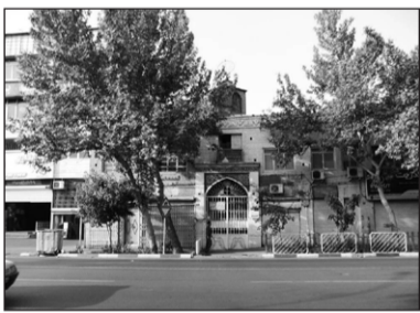
۱۶. مسجد محمودیه