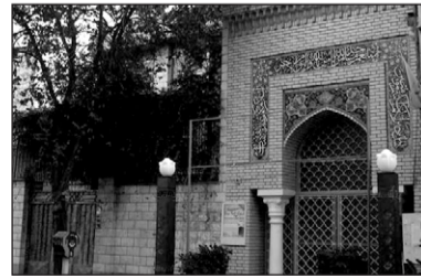
۱. مسجد اباذر