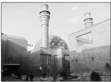
۱۳. مسجد شهدای انقلاب اسلامی