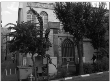
۱۸. مسجد میرآخور