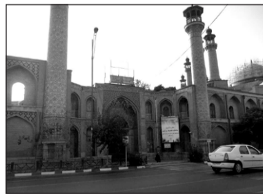
۱۷. مسجد مطهری