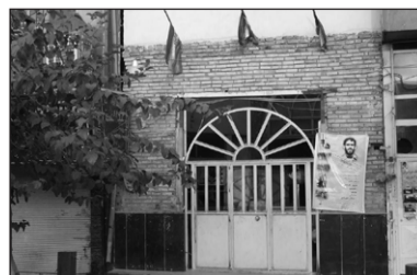
۶. مسجد چهارده معصوم علیهم السلام