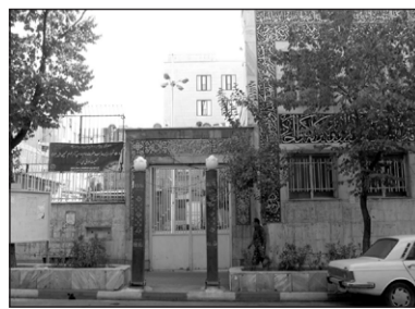
۲۰. مسجد امام حسین علیه السلام