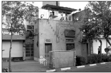
۴. مسجد امام حسن علیه السلام