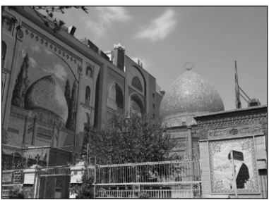
۲۱. مسجد فخرالدوله