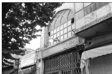
۷. مسجد حاج نایب