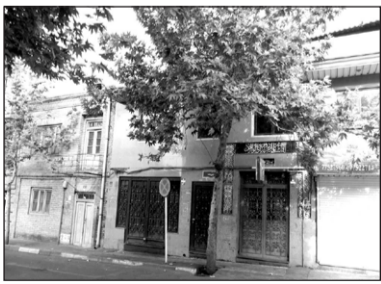
۱۹. مسجد میرفخرایی