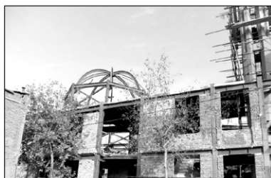
۹. مسجد خَیْر