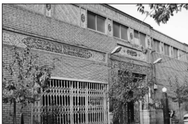
۵. مسجد آشتیانی‌ها

برای دو سه هفته اول از مسجدتون عکس داریم! اما از شماره‌های بعدی پرکردن این قسمت نشریه به عهده شماست! عکس‌های مسجدتون رو به sangar.shohada@chmail.ir بفرستید.