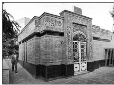
۱۴. مسجد صاحب الزمان عجل الله فرجه