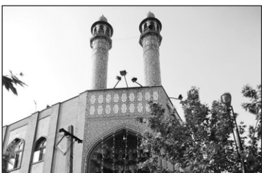
۱۰. مسجد سادات اخوی