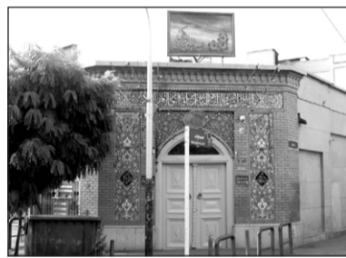
۱۱. مسجد سیدالشهدا