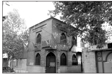
۲. مسجد الزهرا سلام الله علیها