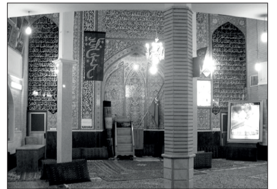
۴۰۱. مسجد المهدی عجل الله تعالی فرجه