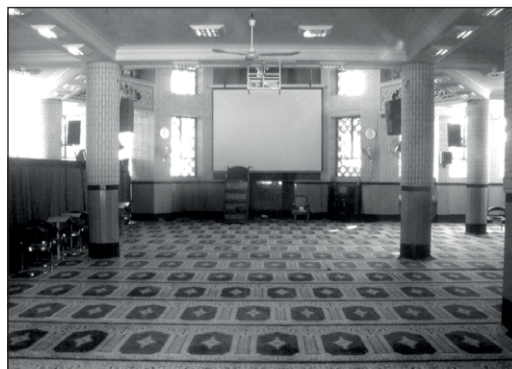
۴۰۴. مسجد حضرت قمر بنی هاشم علیه السلام