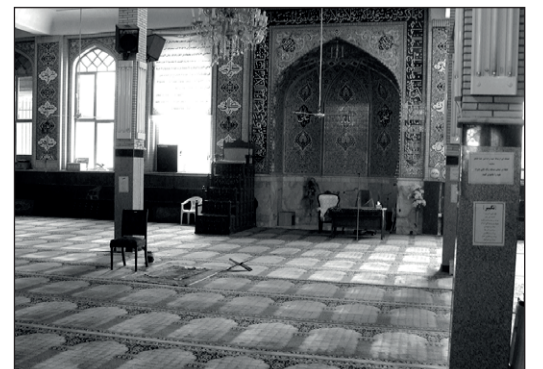
۴۰۳. مسجد جامع پیامبر اعظم صلی الله علیه و آله