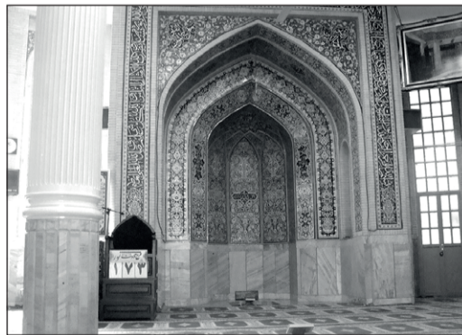
۴۰۲. مسجد ابوذر