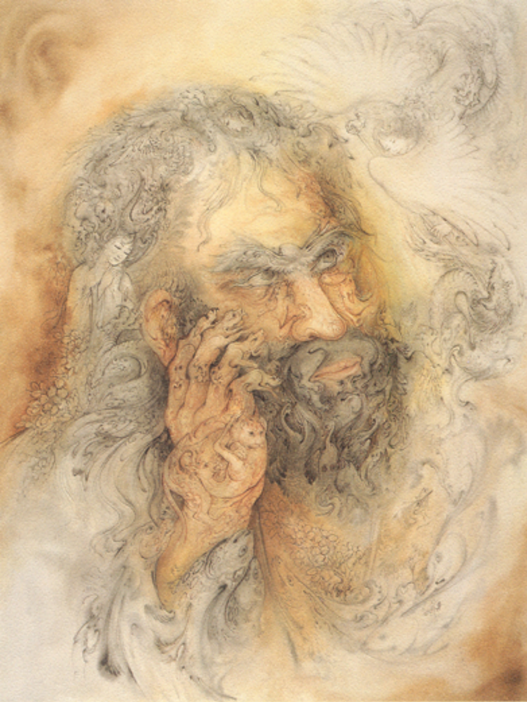
Human being , 46x61 cm., 1992