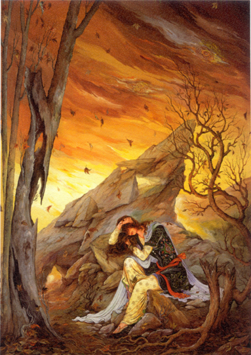
Broken hearted, 48x68 cm., 1963