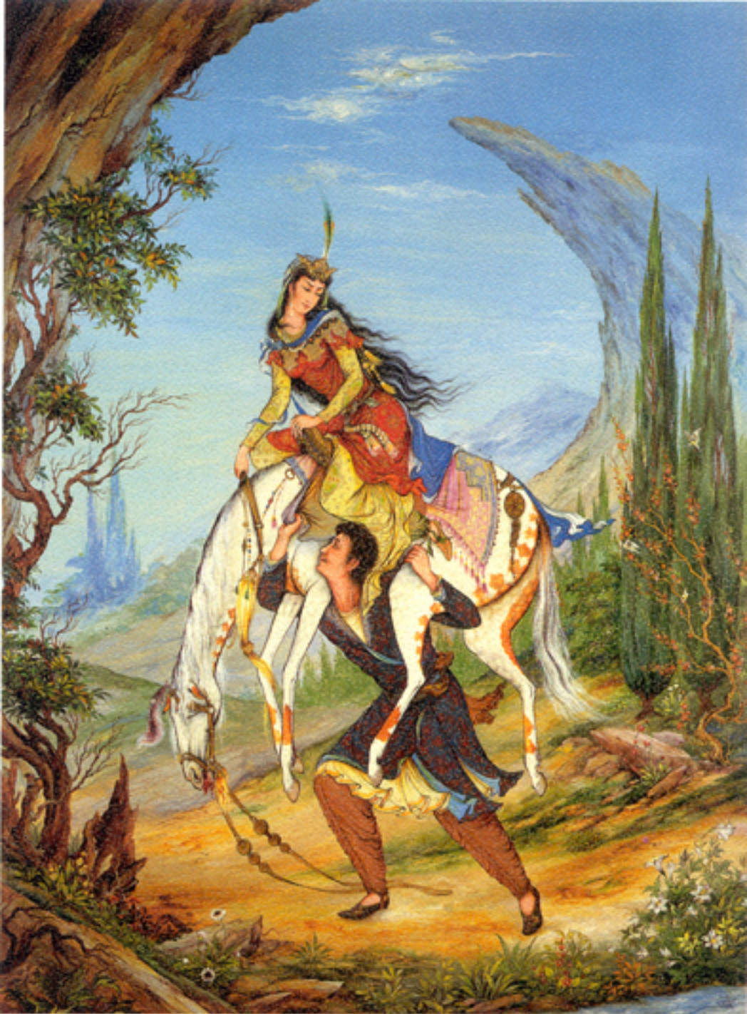
Sweet love, 55x75 cm., 1965