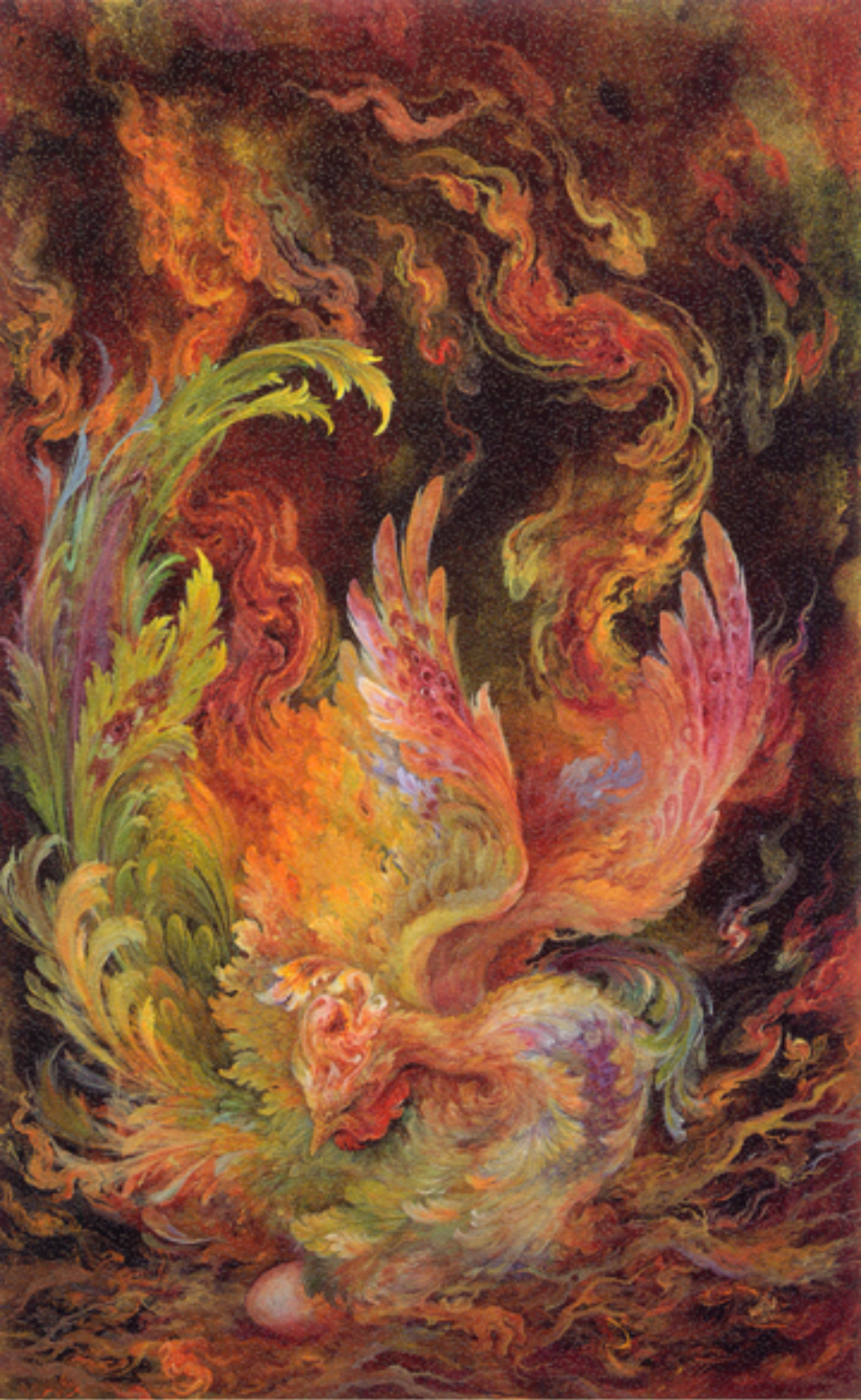
Phoenix , 50x81 cm., 1998