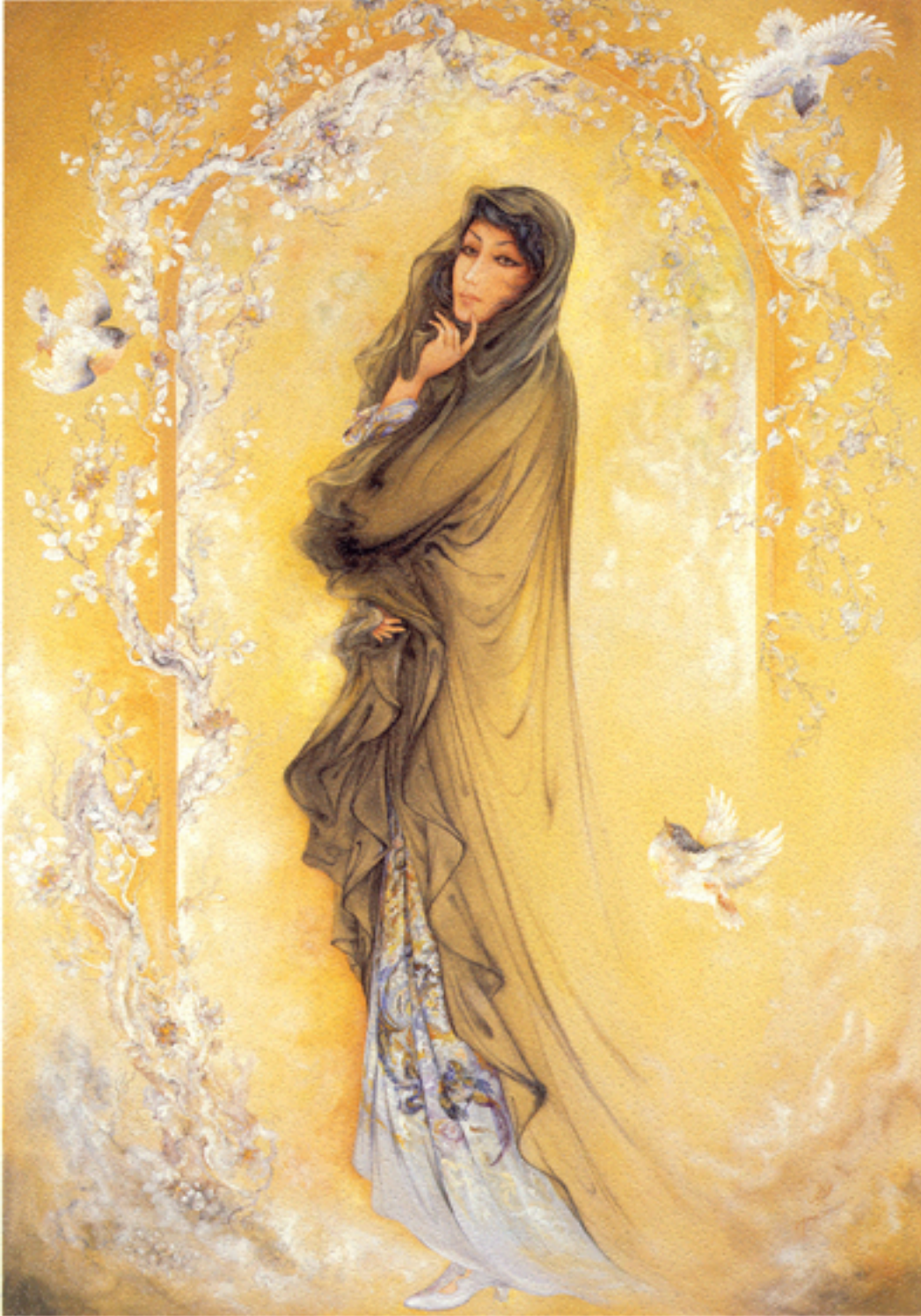
Gaze, 51x73 cm., 1983