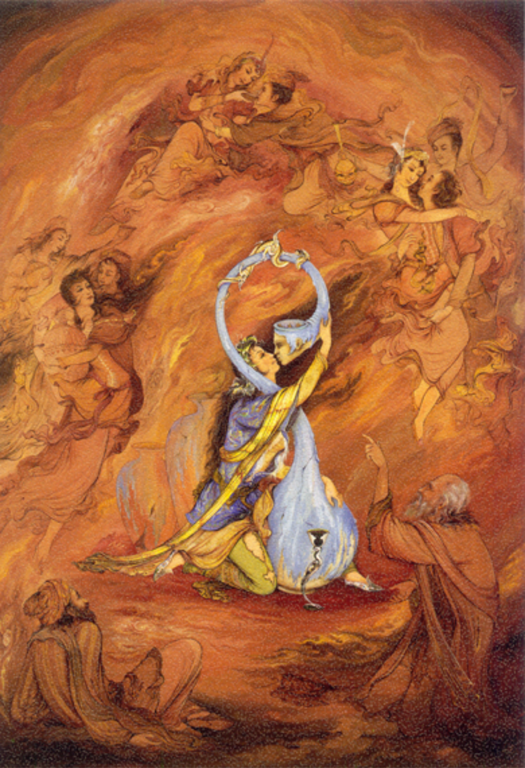
Kissing the ground, 52x75.5 cm., 1963