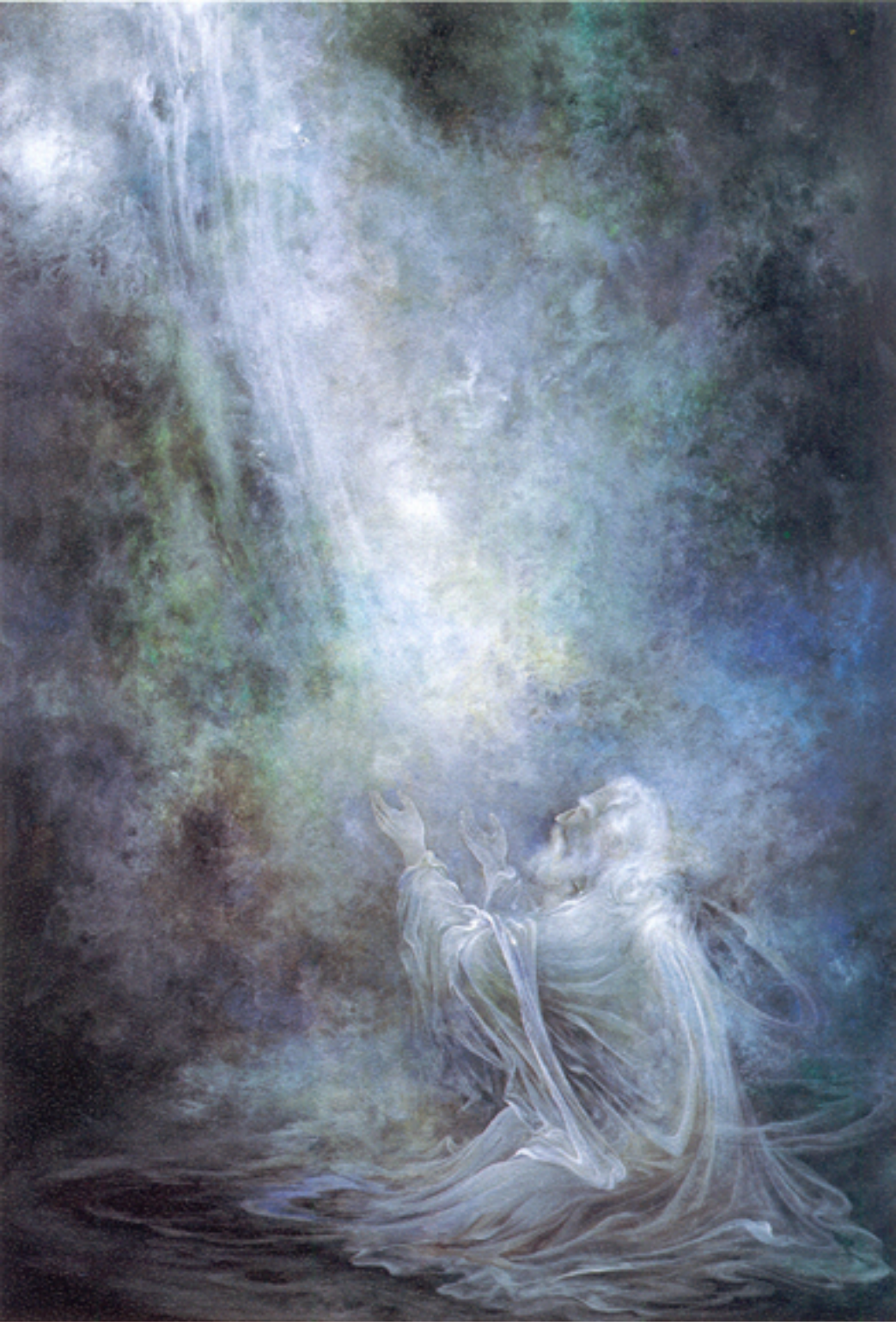
Worship, 56x81 cm., 1997