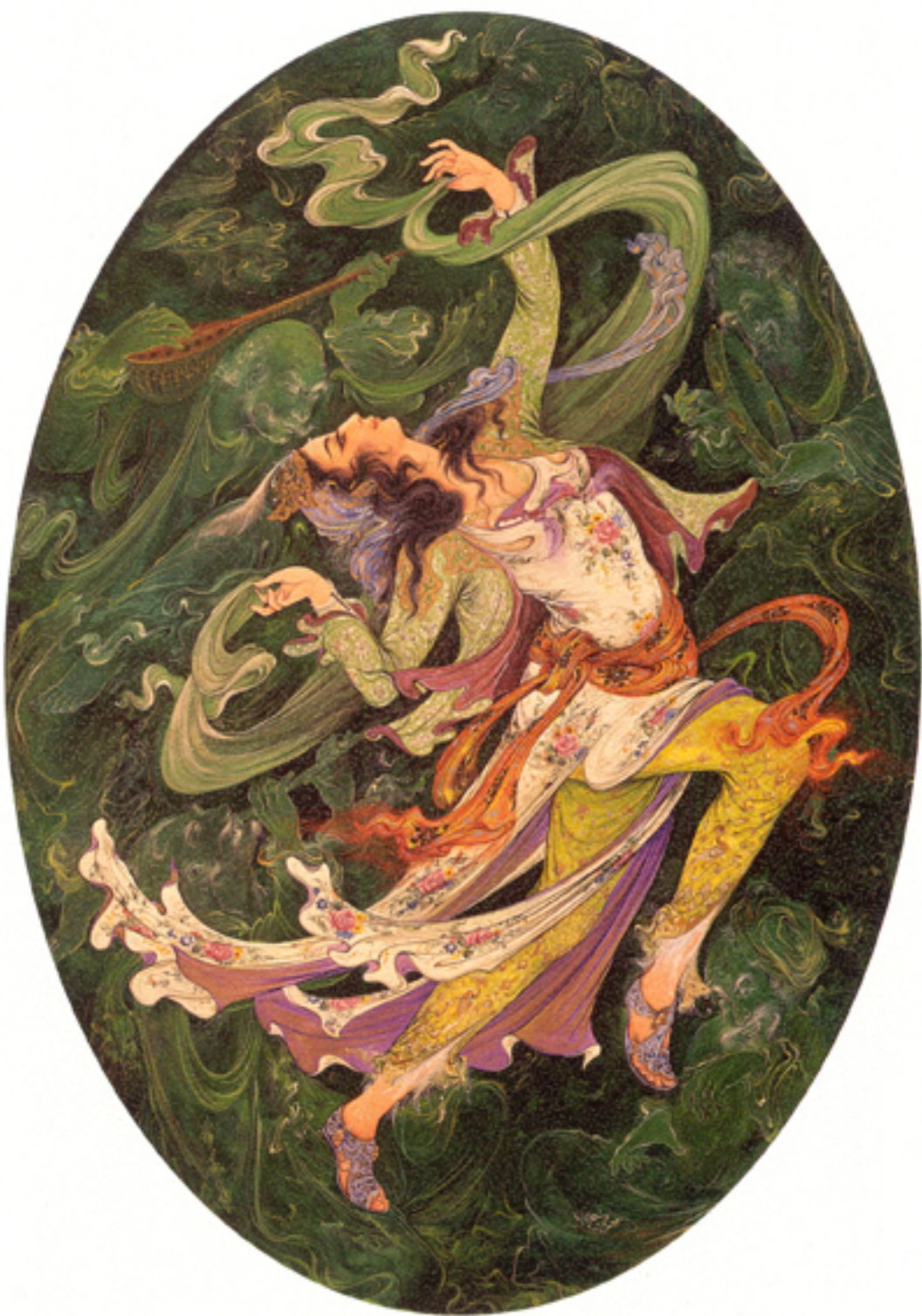
Joy, 35x50 cm., 1972