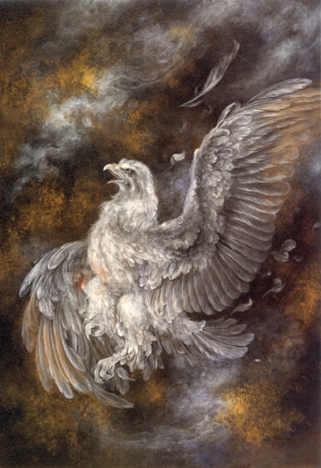
Injured eagle, 51x71 cm., 1987