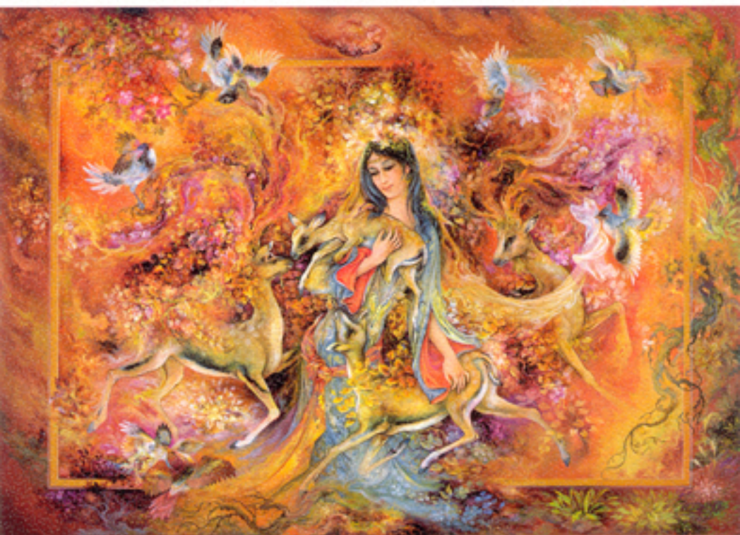
The Warmth of love , 58x80 cm., 1999