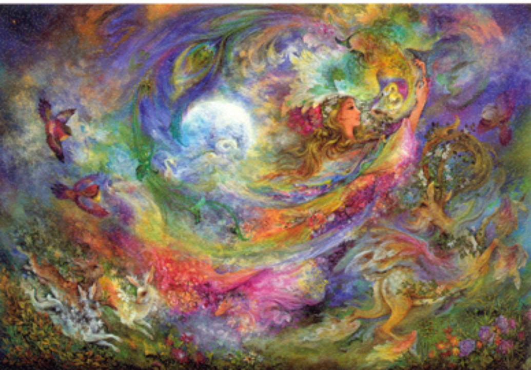
Exhilarating fragrance, 56x81 cm., 1988