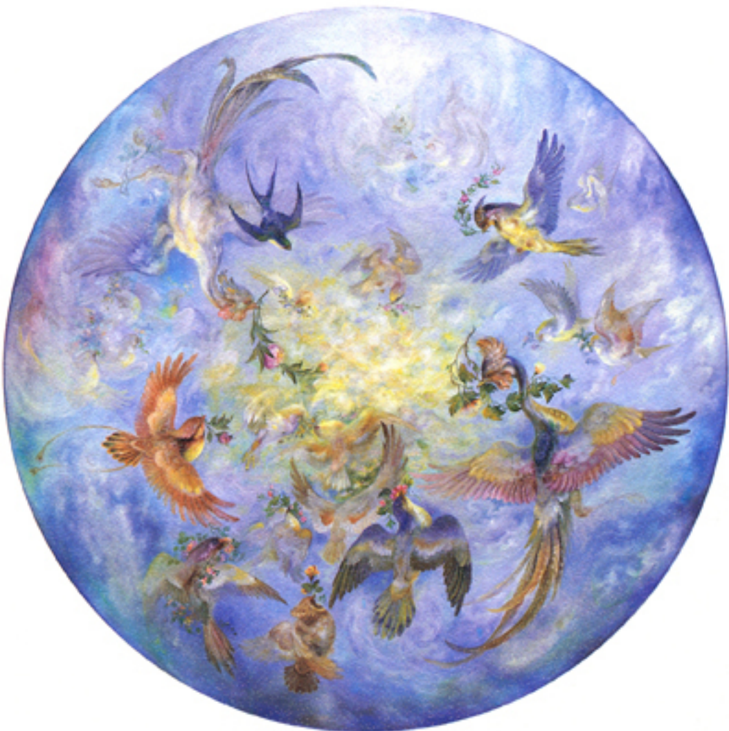
Festival of light, 120 cm., 1984