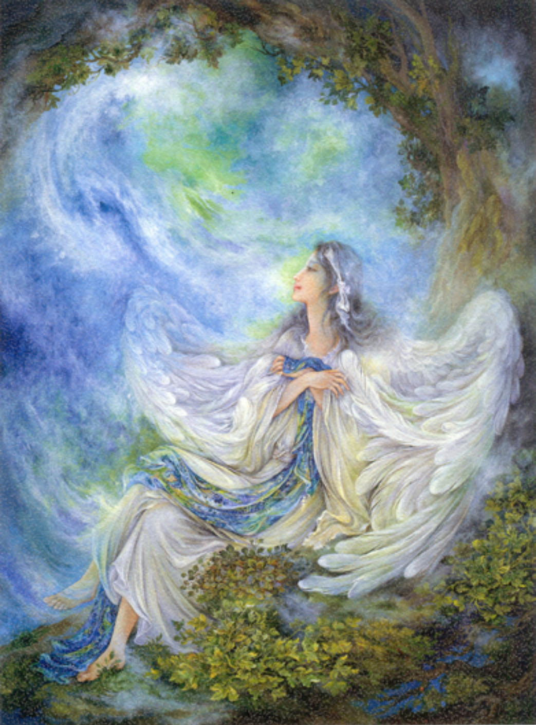
Oh the way of Heaven , 60x81 cm., 1998