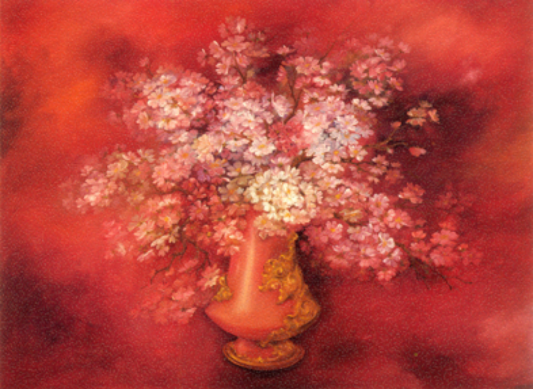
Fragrance of joy, 76x101 cm., 1988