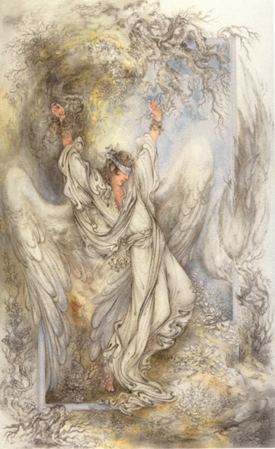
Innocence, 51x81 cm., 1986