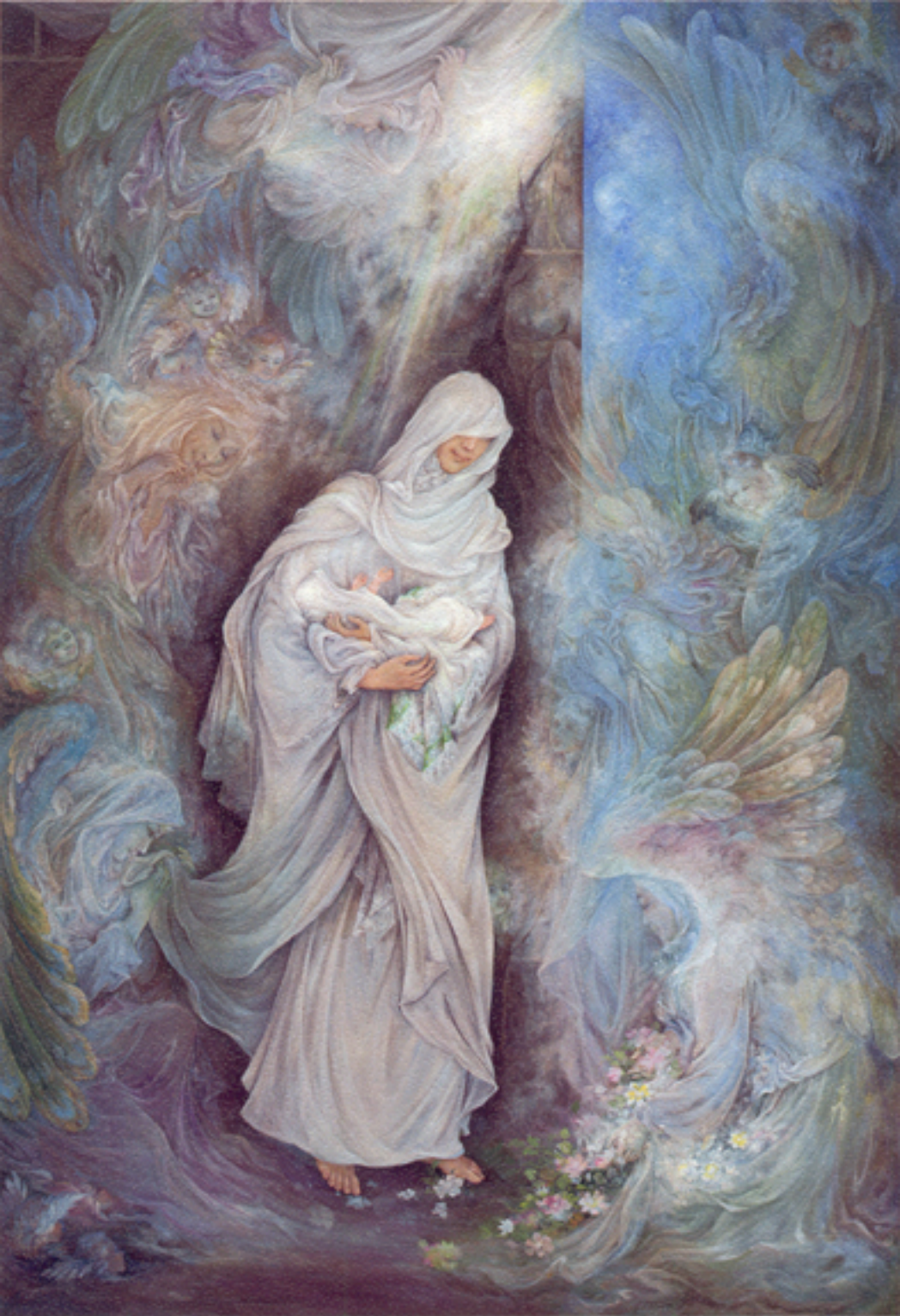
The Newborn of Kaaba , 56x81 cm., 1995