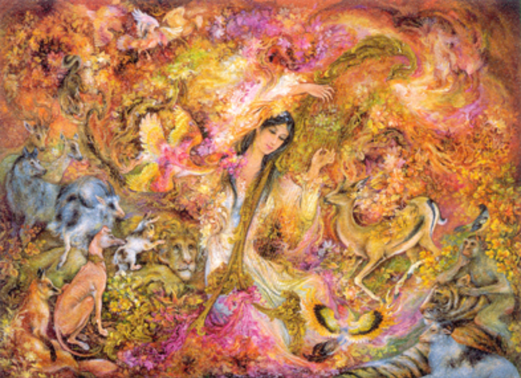
The Music of love , 58x80 cm., 1999