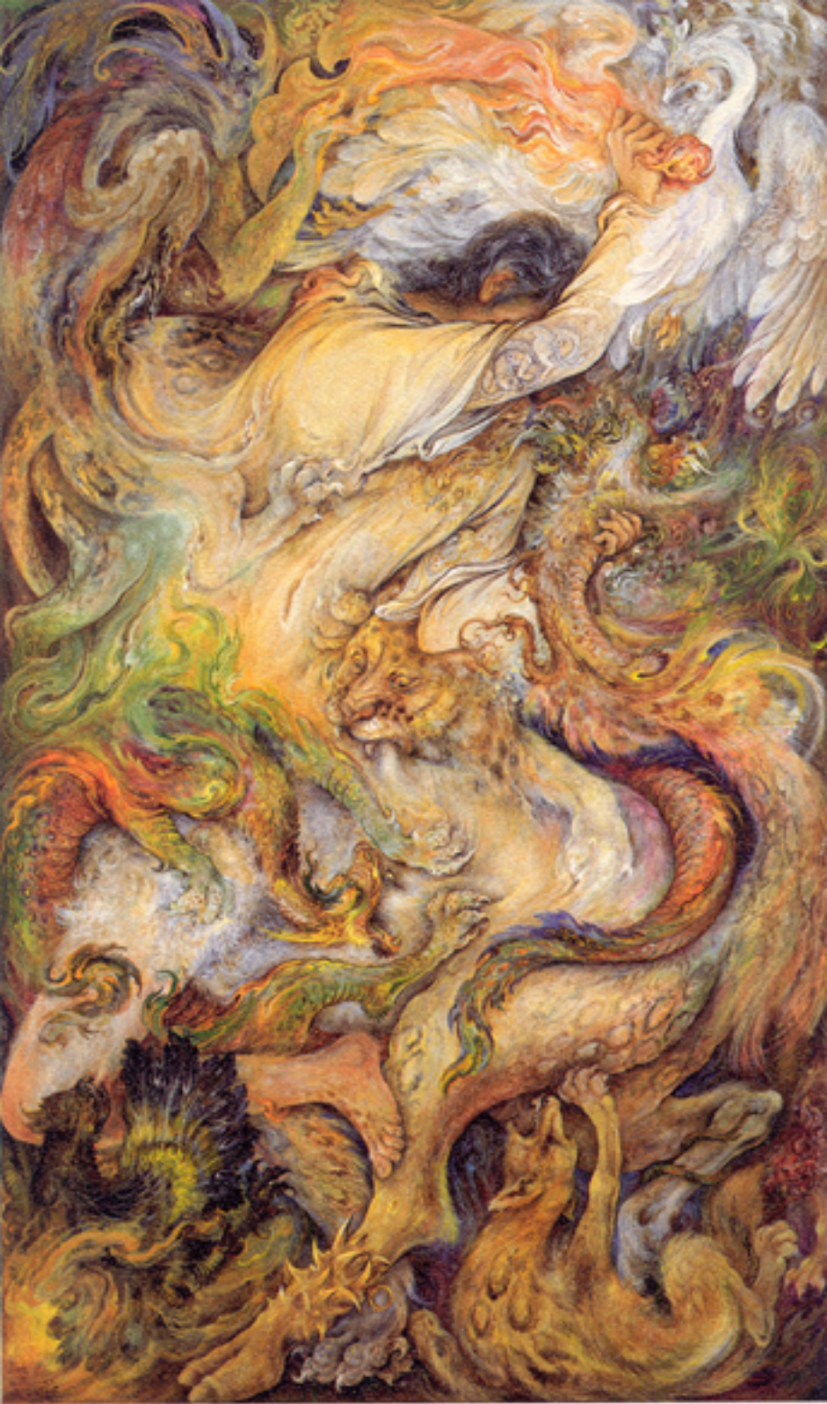
Fighting the Devil inside, 45.5x62.5 cm., 1991