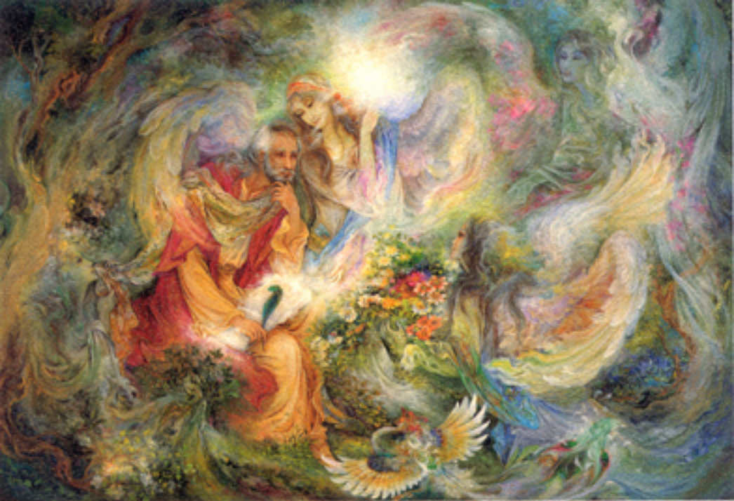
Tidings of light , 56x81 cm., 1996