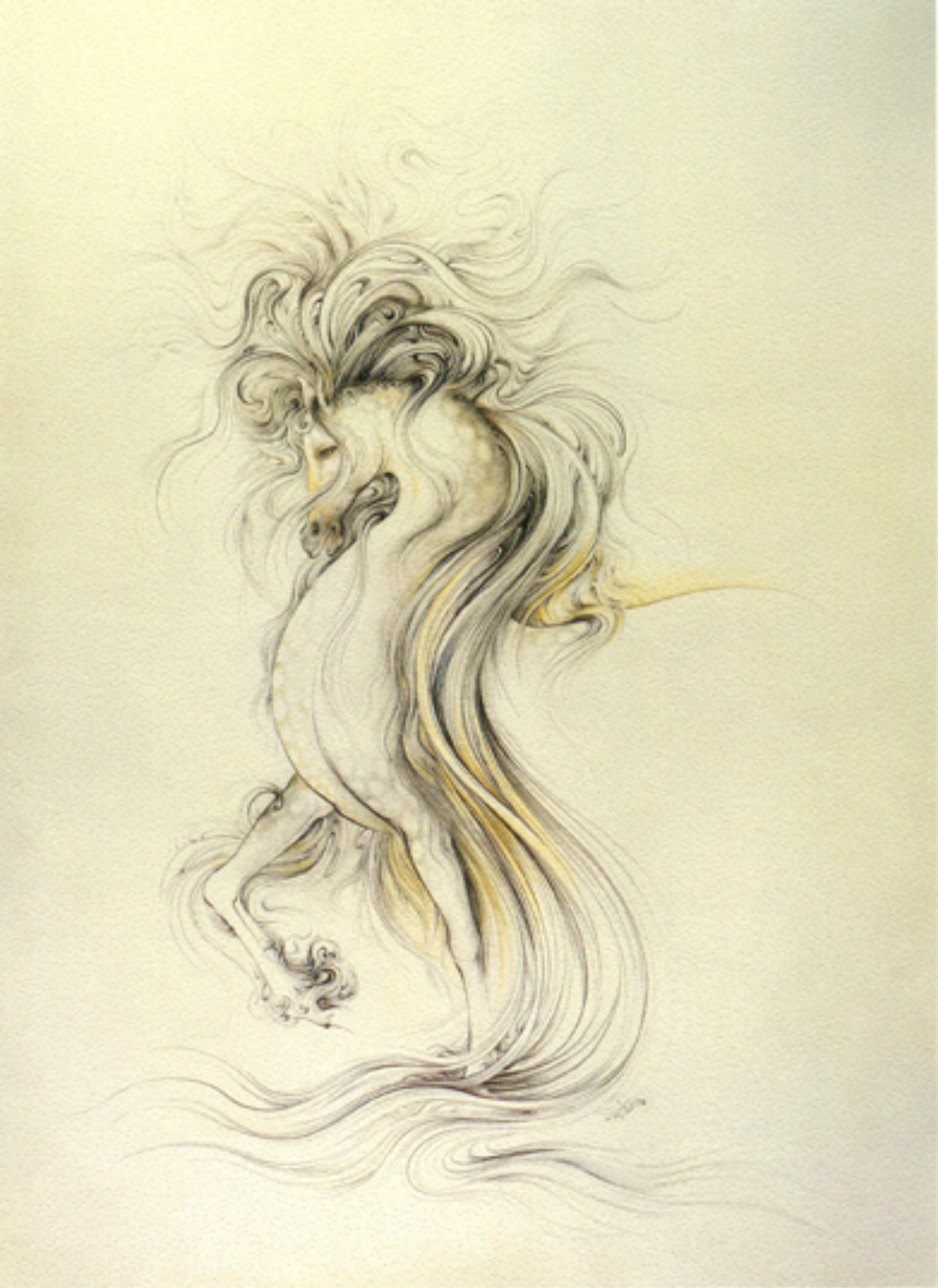
Vanity, 50x70 cm., 1977