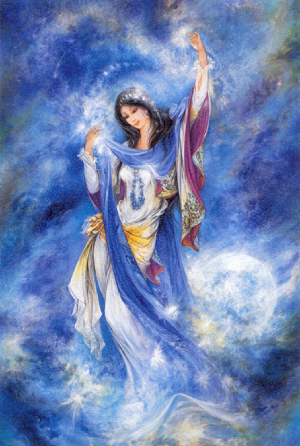
Morning star, 51x81 cm., 1988