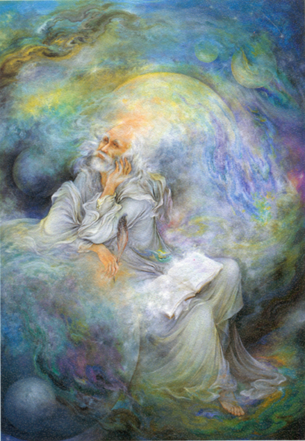
The poet Hafez, 46x65 cm., 1995