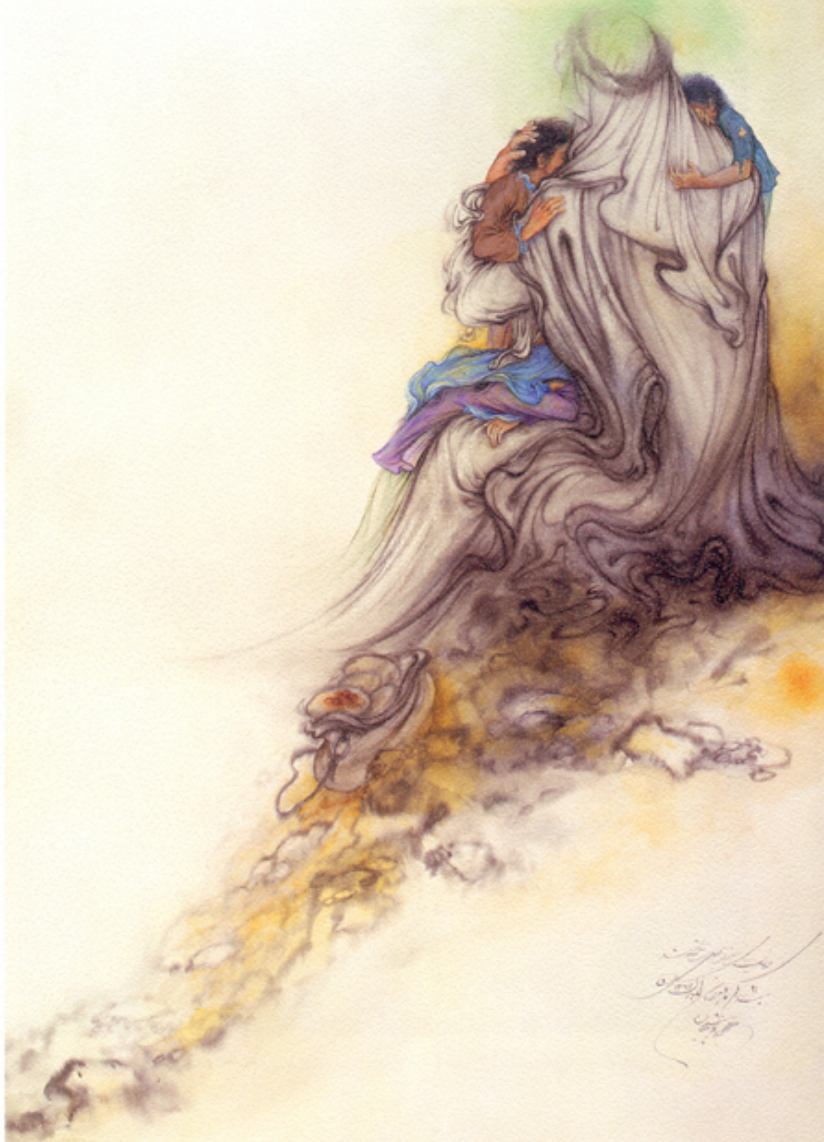
▲ Shelter, 49x73 cm., 1977

پناه (نسیم نواز) حضرت علی (ع) سائیکس، ۱۳۵۹