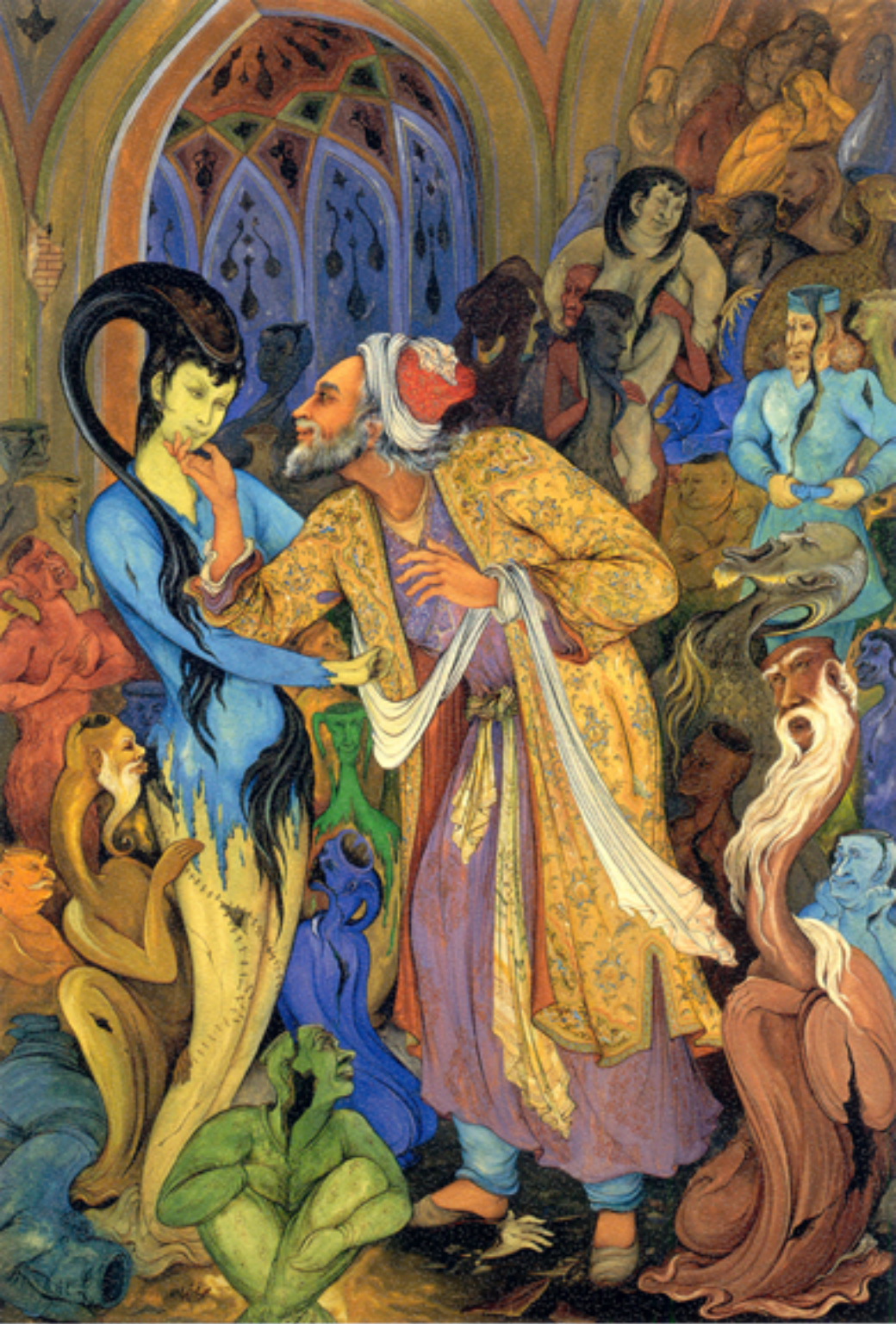
So many jugs, 53x74 cm., 1967