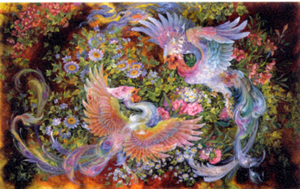
Fragrance of affection , 50x81 cm., 1998