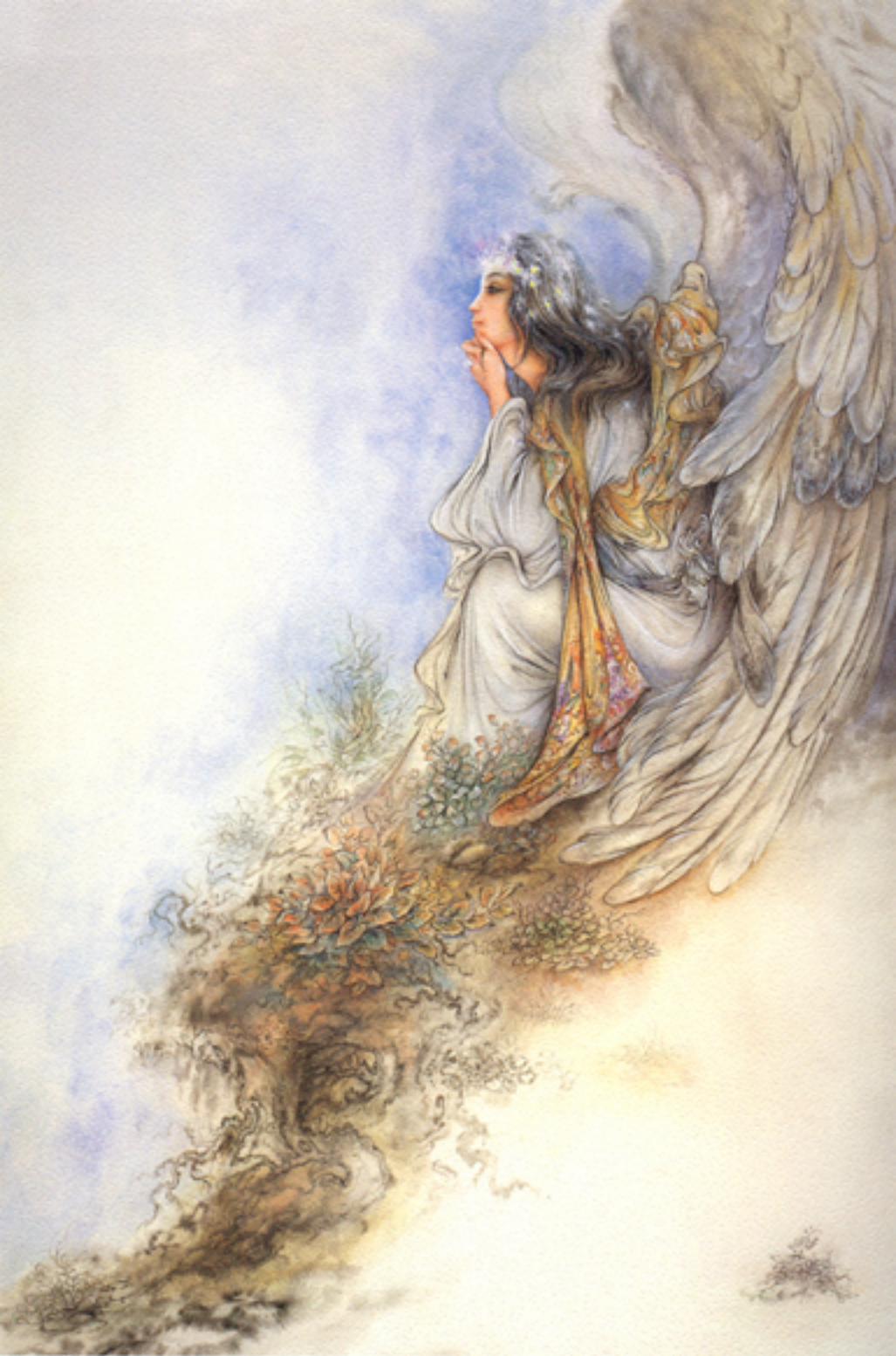
The World Beyond, 56x81 cm., 1989