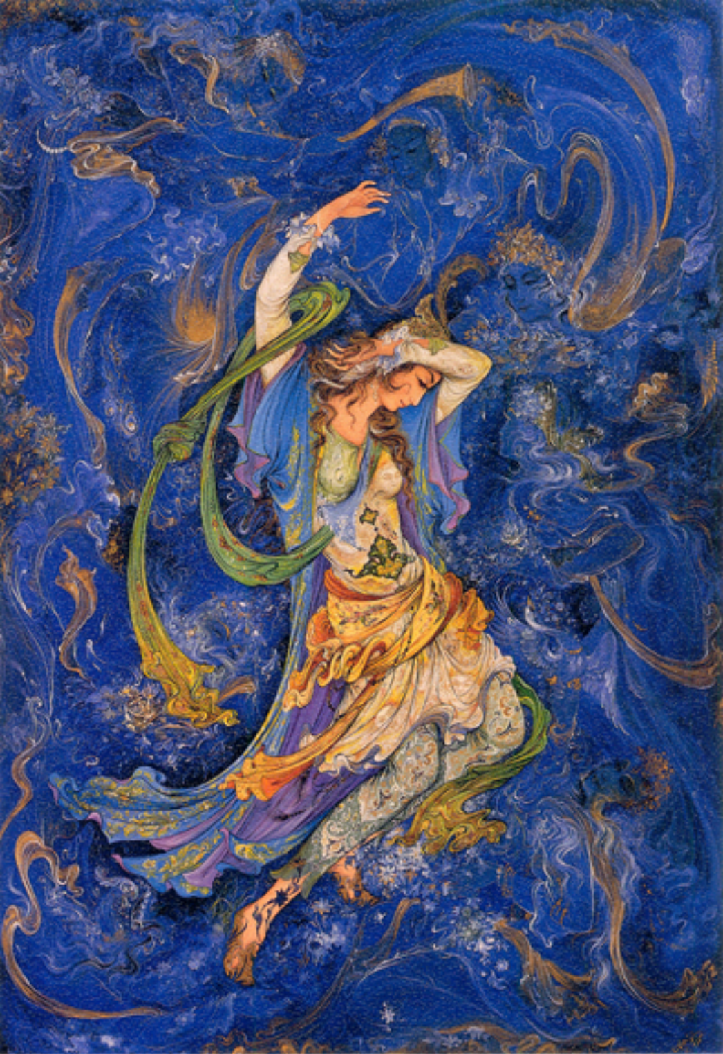
Dawn, 70x90 cm., 1972