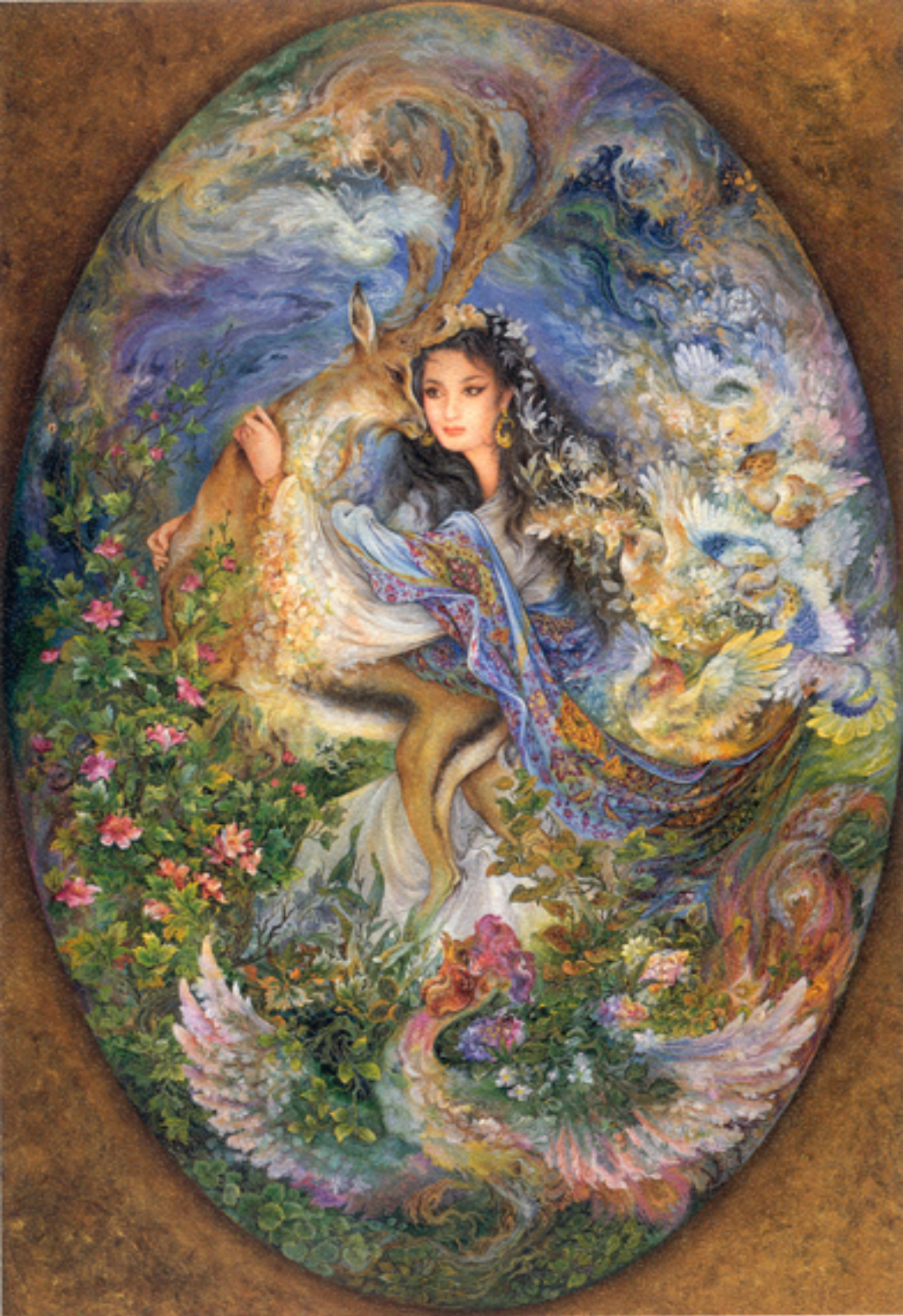
A picture affection, 56x80 cm., 1992