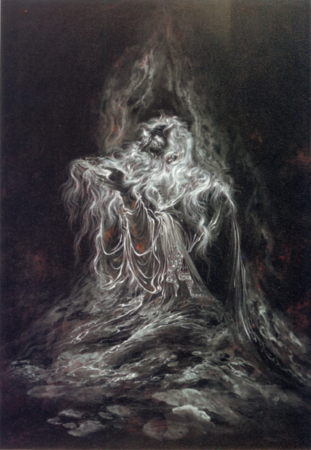
A hoary man, 46x61 cm., 1992