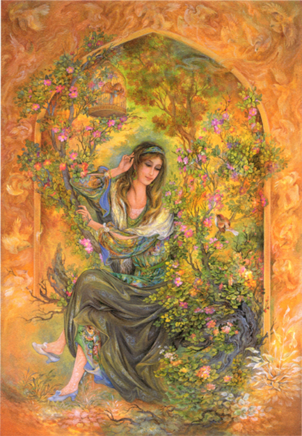
Mediation , 56x81 cm., 1999