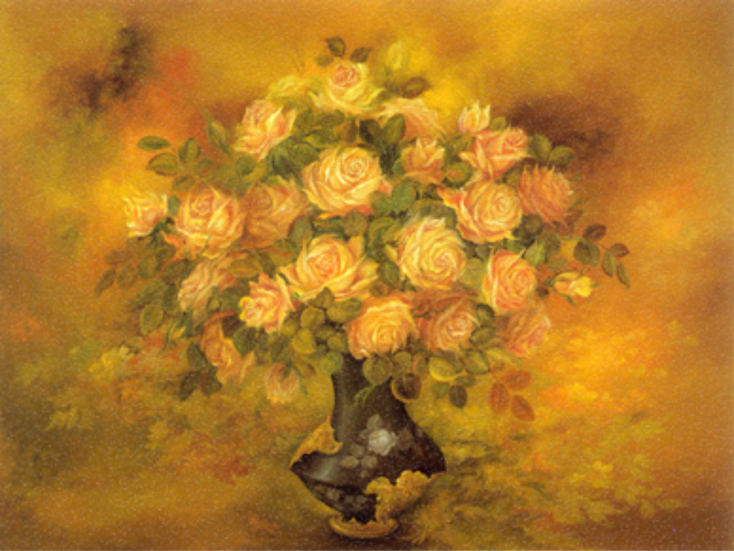
Flowers of solitude, 76x101 cm., 1988