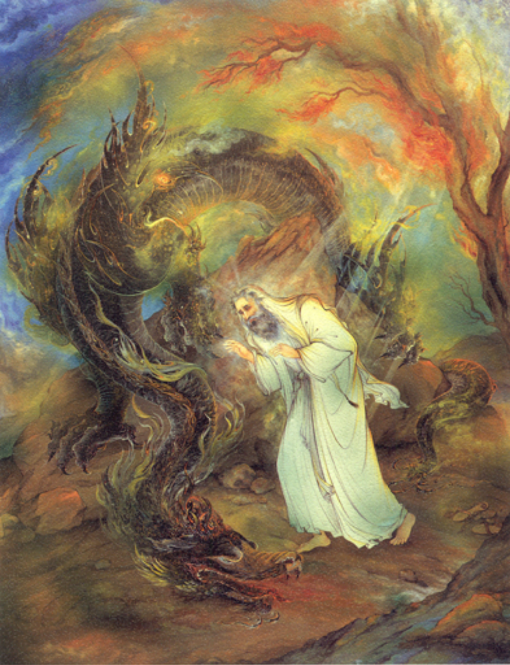
Moses , 64x84 cm., 1961