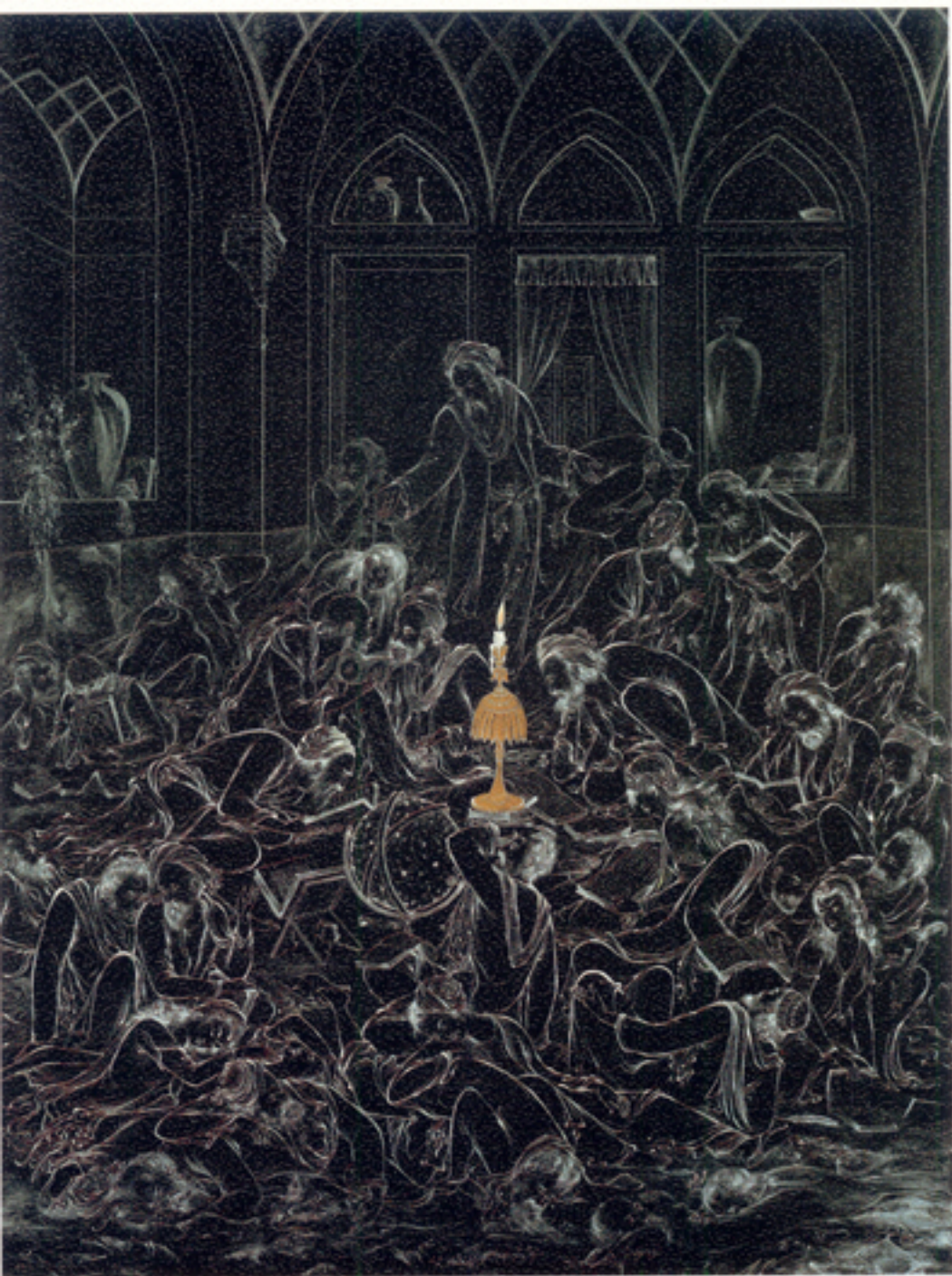
Burning, 60x80 cm., 1963