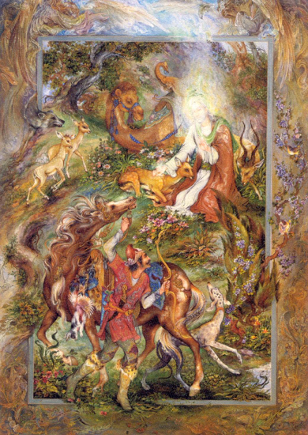
The Guarantor of the gazelle, 72x101 cm., 1979

زمان آهو (امام رضای)، ۱۰۱×۷۲ سانتیمتر، ۱۳۵۸