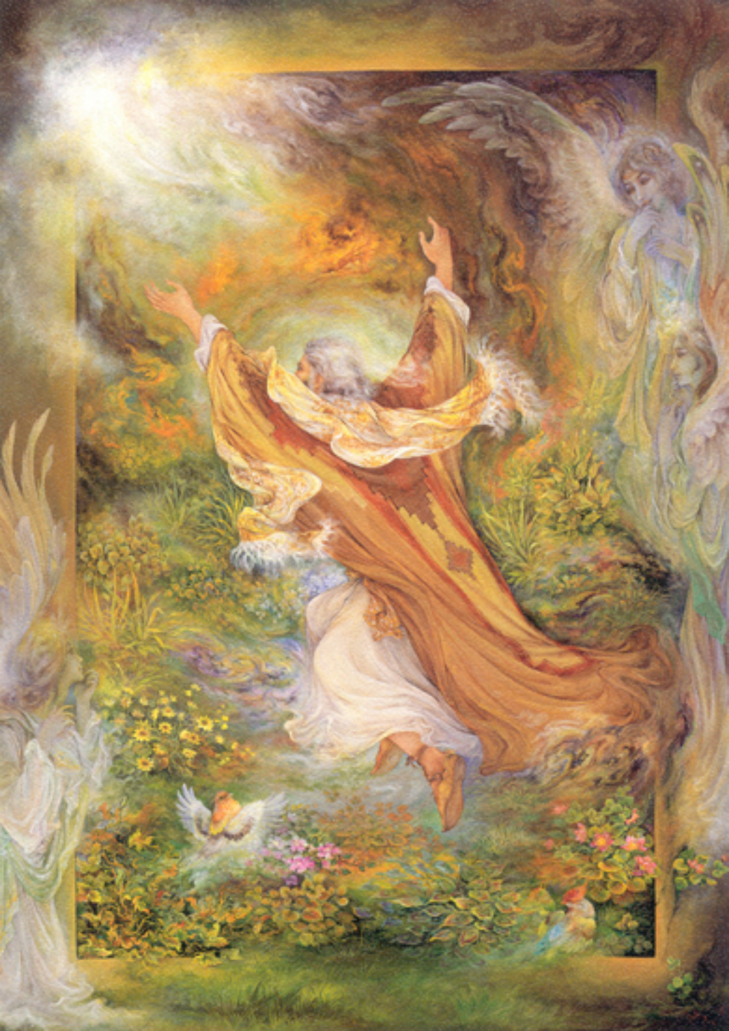
Abraham , 71x102 cm., 1994