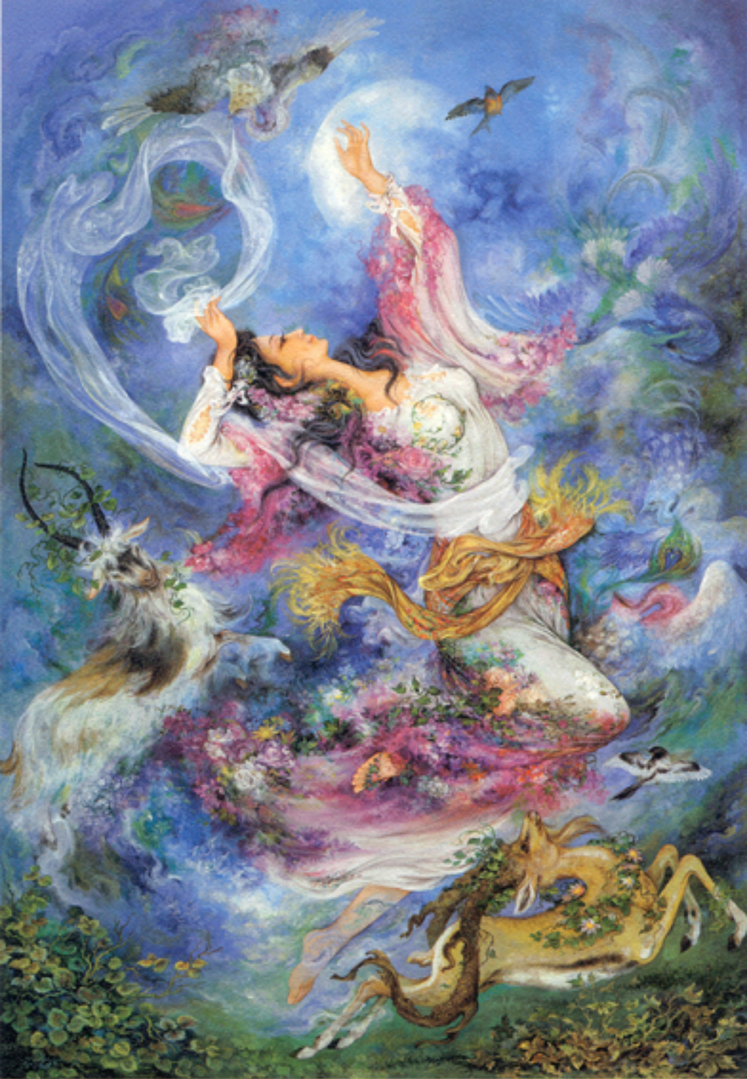
Morning blossoms, 51x76 cm., 1986