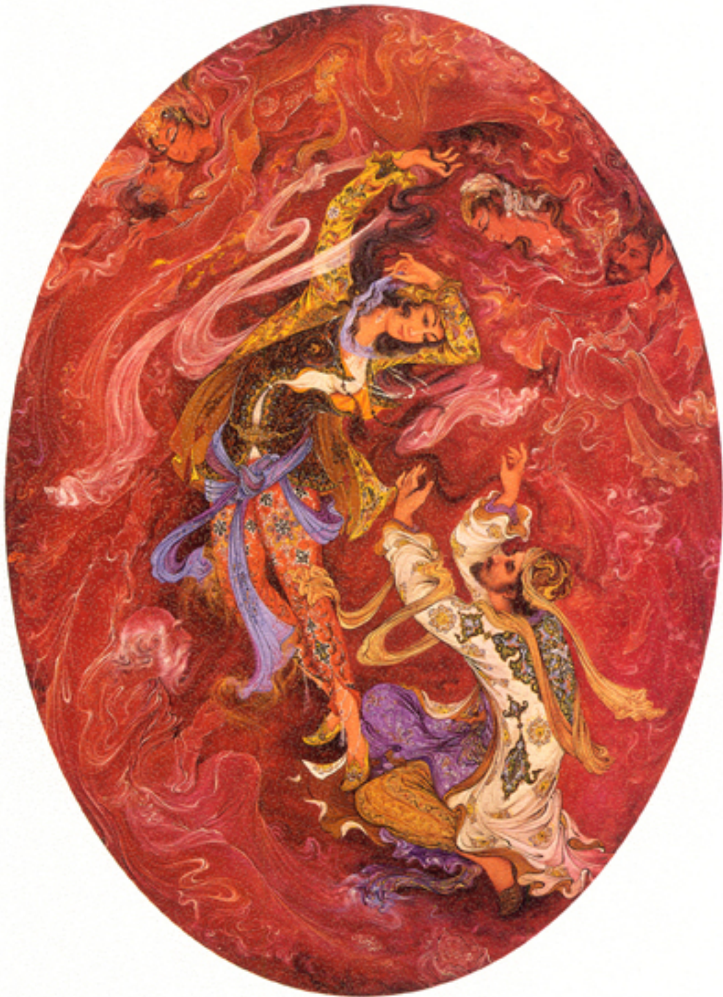
Adoration, 47x64 cm., 1971