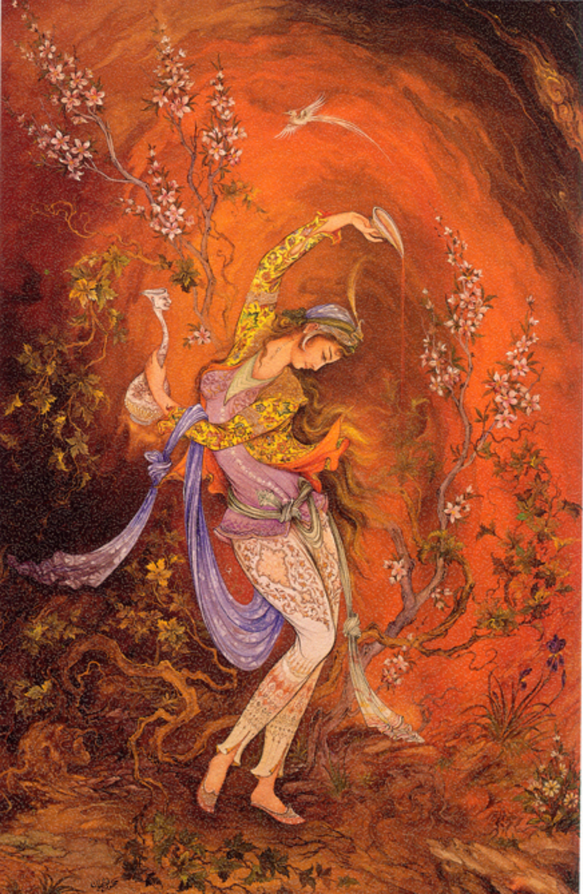
▼ Self - sacrifice, 42x62 cm., 1967