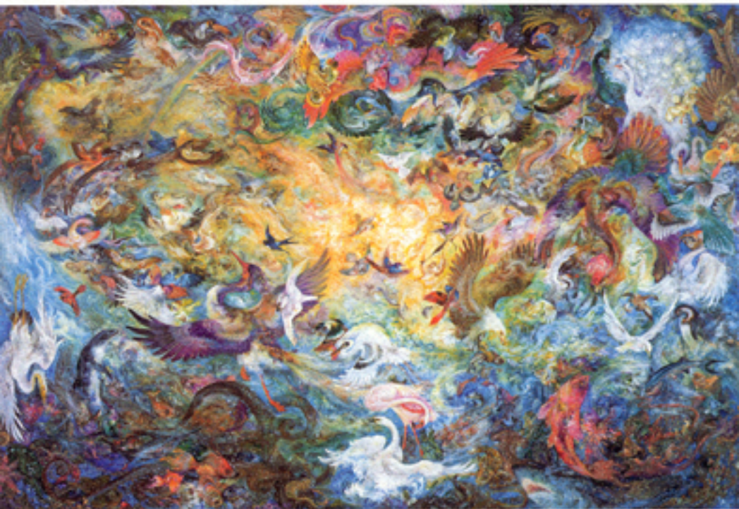
Fifth day of Creation, 56x81 cm., 1990