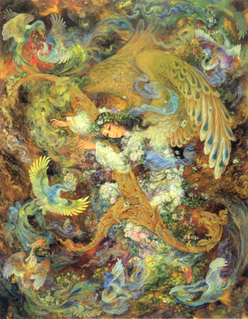
Sounds of Creation, 56x71 cm., 1985