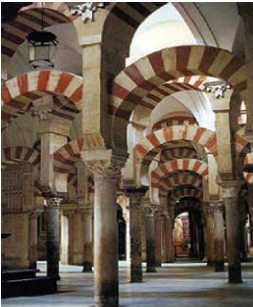
مسجد جامع قرطبه

اندلس اسلامی در عرصه معماری نیز بسیار شکوفا بود. مسجد جامع قرطبه و کاخ الحمراء غرناطه، دو شاهکار معماری جهان اسلام به شمار می‌روند که سالانه میلیون‌ها گردشگر را از اقصی نقاط جهان جلب می‌کنند. نمونه‌های شگفت‌انگیز دیگری از معماری شکوهمند مسلمانان اندلسی بر جای مانده است.