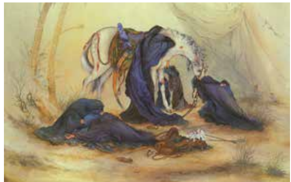
تابلوی عصر عاشورا اثر استاد فرشچیان