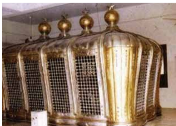
ضریح امام باقر و امام صادق علیهما السلام در قبرستان بقیع پیش از تخریب

با دقت مندرجات جدول فوق را مطالعه کنید و بگویید: الف) رهبری قیام‌های عصر اموی را چه افراد یا چه گروهی در دست داشتند؟ چرا؟ ب) قیام‌های زمان بنی‌امیه چه محدوده جغرافیایی از قلمرو خلافت را در بر گرفته بود؟ پ) ایرانیان در قیام‌های دوران خلافت امویان چه نقشی داشتند؟