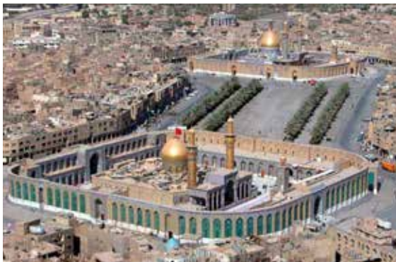
حرم امام حسین علیه‌السلام و حضرت ابوالفضل

با وجود آنکه معاویه و جانشینانش برای تحکیم حکومت خود از امکانات و ترفندهای سیاسی، نظامی، اقتصادی و تبلیغی مختلفی بهره می‌بردند، اما همواره با مقاومت و مخالفت‌های جدی روبرو بودند. در سرتاسر دوران خلافت بنی‌امیه، مناطق مختلف جهان اسلام به ویژه عراق، حجاز (مکه و مدینه) و ایران صحنه مبارزه و جنبش‌های اعتراضی مخالفان حکومت اموی بود. شیعیان و پیروان علی علیه‌السلام که به علویان معروف بودند به همراه موالی و خوارج