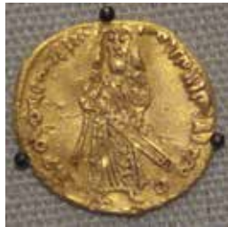
نمونه از سکه‌های دوره‌ی امویان

در دوران خلفای بنی‌امیه، قبایل عرب به‌طور گسترده به سرزمین‌های خارج از شبه‌جزیره عربستان مهاجرت نموده و اختلاف و رقابت‌های قبیله‌ای را به این سرزمین‌ها منتقل کردند. امویان برای تحکیم سلطه سیاسی خود، به این اختلافات و دشمنی‌ها که ریشه در دوران جاهلیت داشت، دامن می‌زدند و از یک قبیله در برابر قبیله دیگر حمایت می‌کردند؛ اما گسترش رقابت‌ها و نزاع‌های قبیله‌ای سرانجام اوضاع قلمرو حکومت اموی را به ویژه در خراسان آشفته کرد و فرصت مناسبی برای مخالفان آن حکومت فراهم آورد.