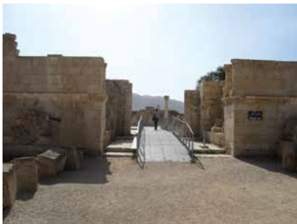
بقایای کاخ هشام بن عبدالملک در اریحا واقع در فلسطین اشغالی

دربارهٔ ارتباط میان عدم مشروعیت و مقبولیت نداشتن حکومت‌ها با توسل آنها به زور و خشونت گفت‌وگو نمایید.