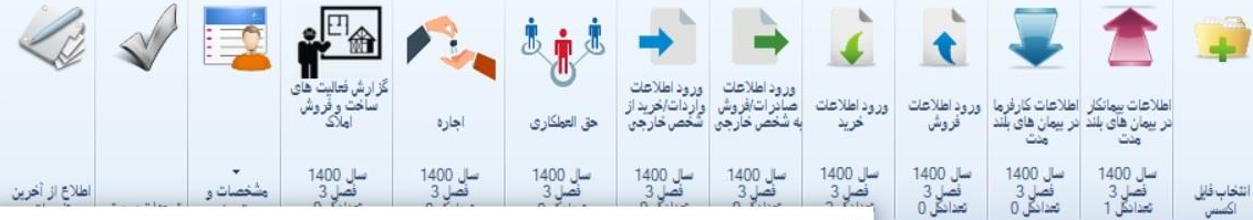
ثبت اطلاعات حق العملکاری / مدیریت پیمان