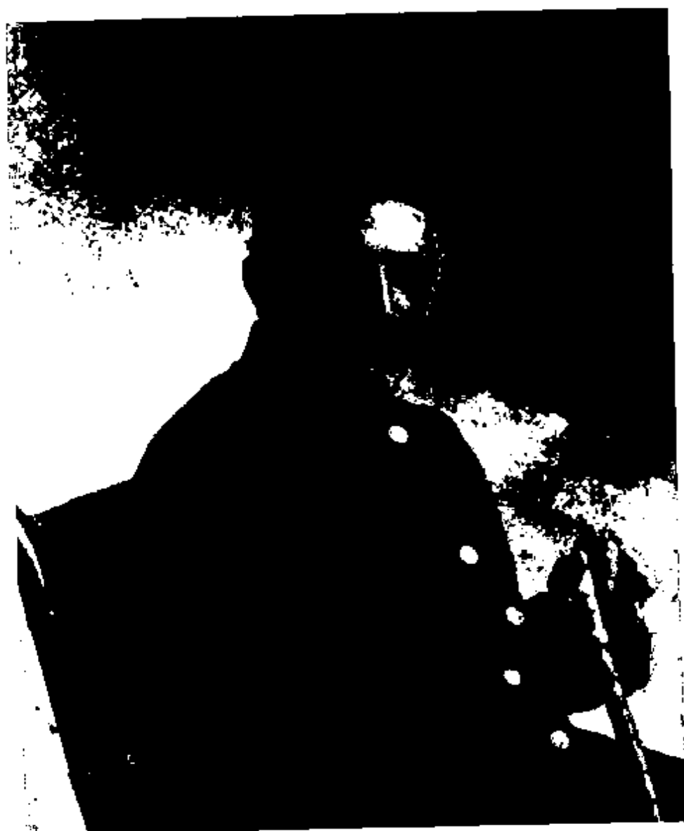
سپہسالار تنکا پنی