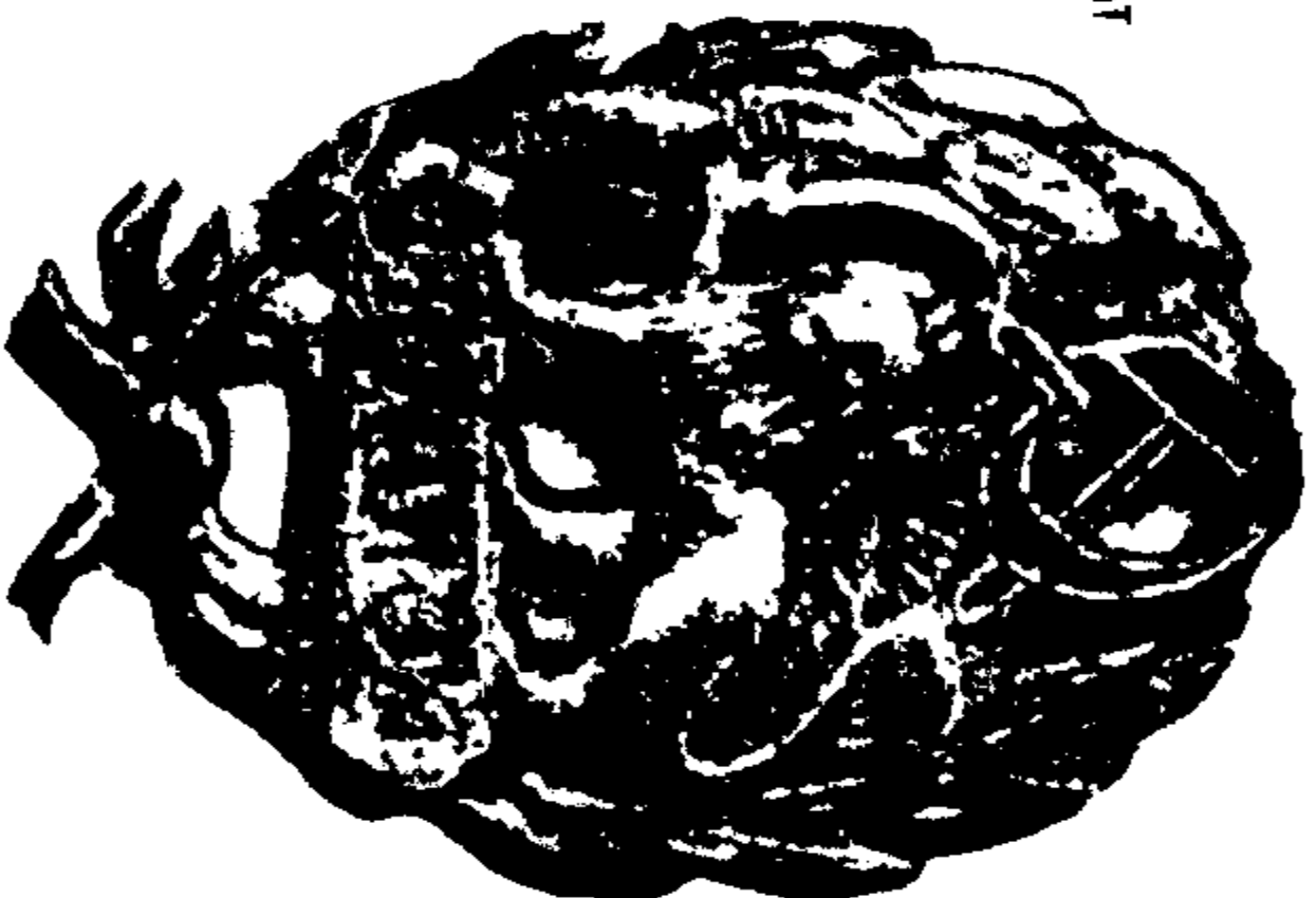
آرم جمهوری گیلان