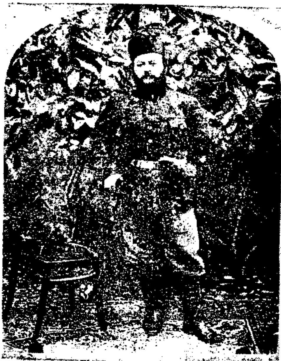
احسان الله خان دوستدار