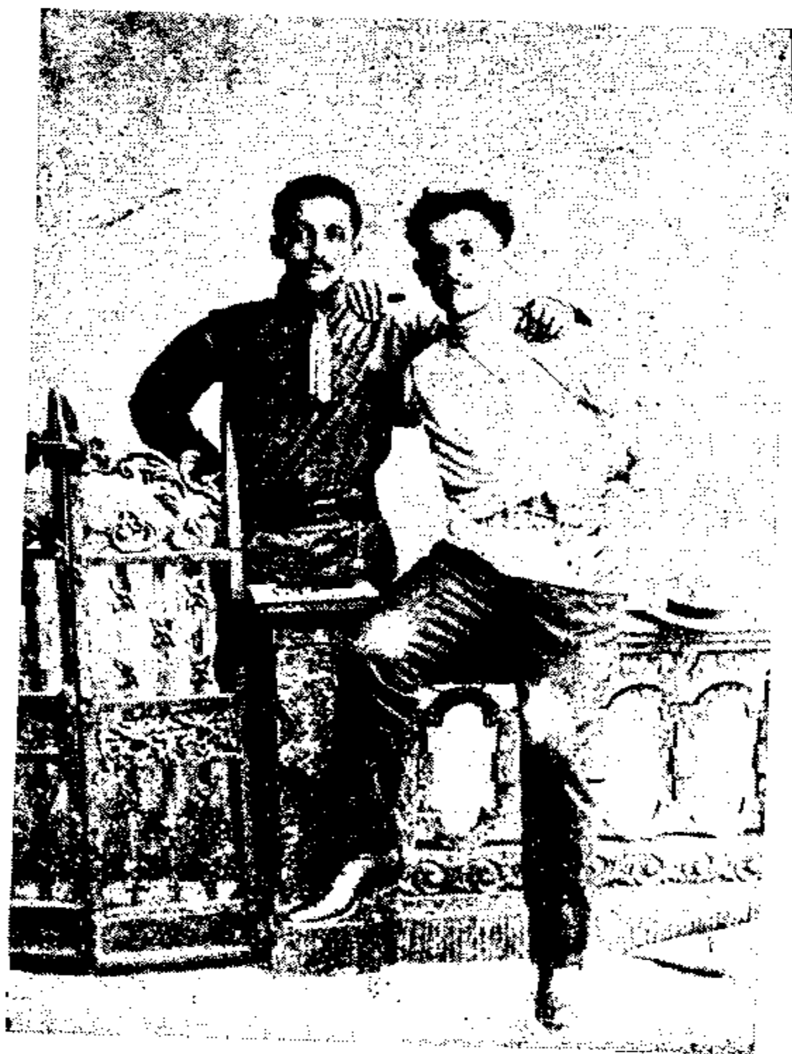
والهکوویکی دیگر از مجاهدین قفقازی