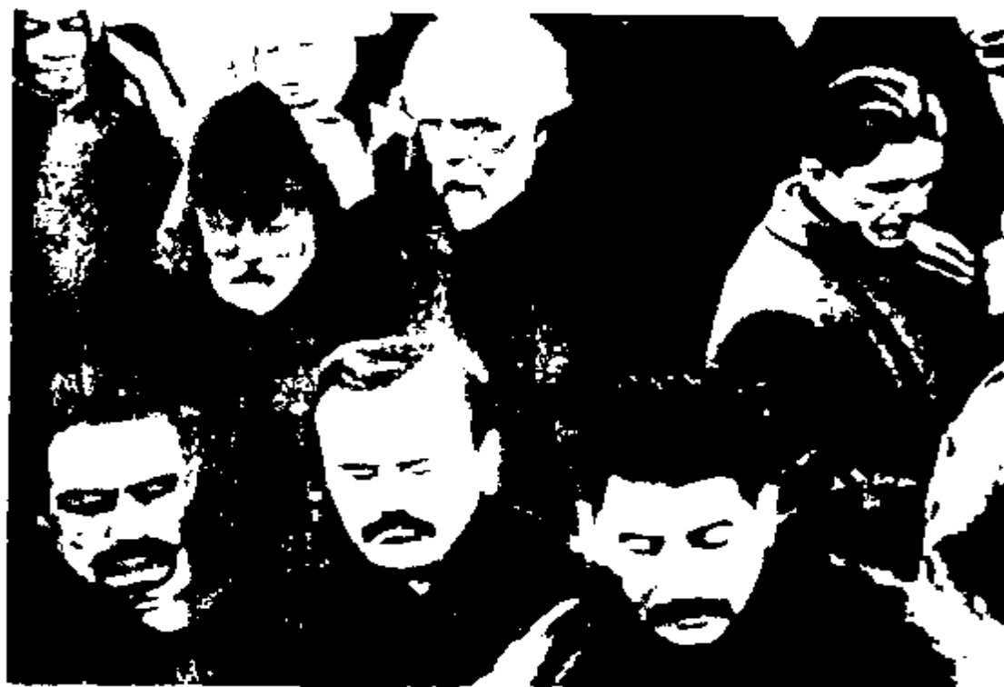
از چپ به راست: میکویان، مولوتوف، استالین