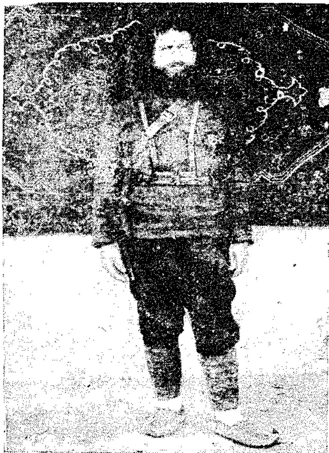
میرزا کوچک خان