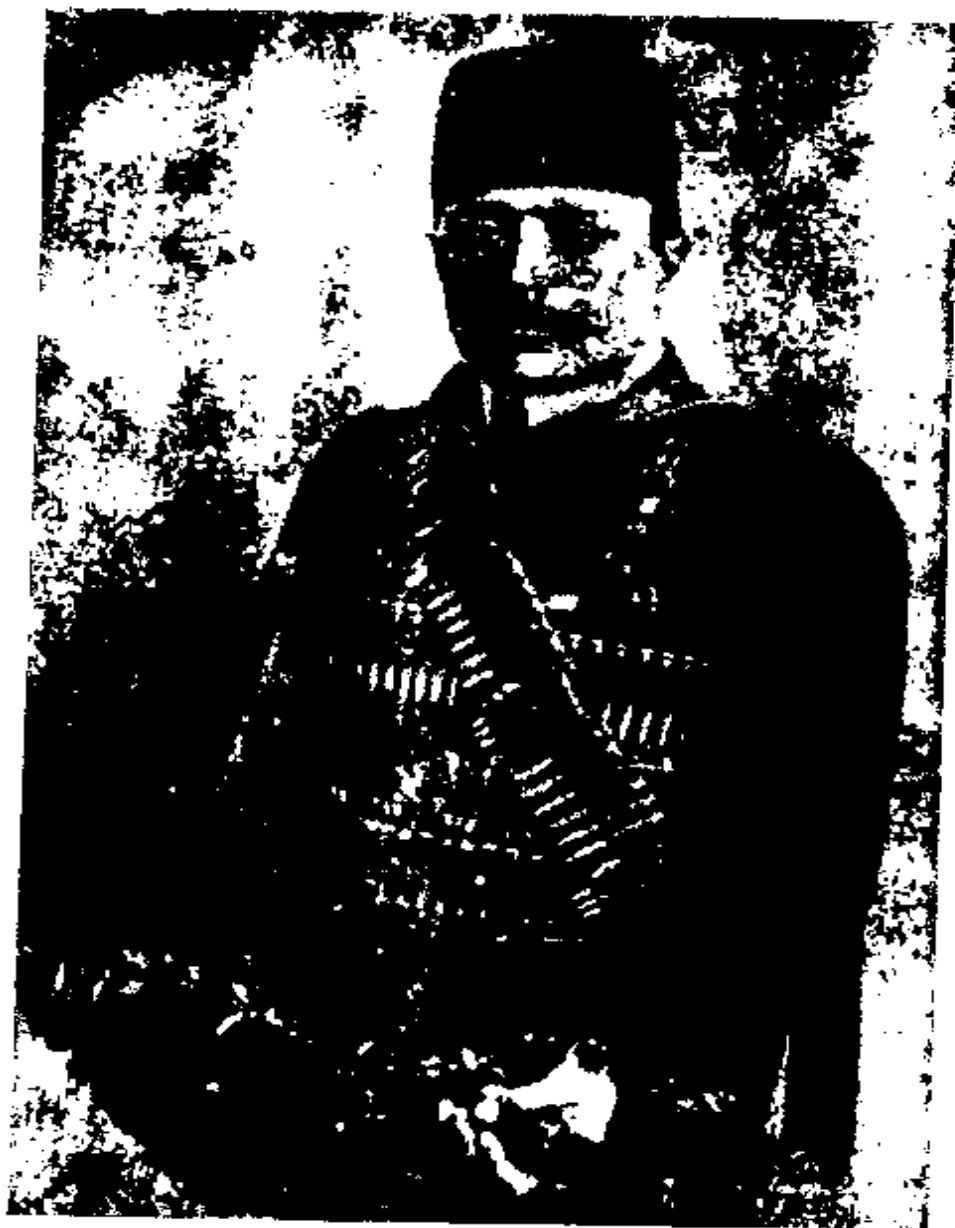
سردار محیی در انقلاب مشروطه