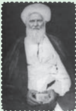
آیت‌الله عبدالکریم حائری یزدی

یکی از اقدام‌های هوشمندانه‌ی مرجعیت شیعه در ایران، تأسیس حوزه‌ی علمیه‌ی قم در سال ۱۳۰۱ ش. پس از شکست عثمانی در جنگ اول و اشغال عراق توسط انگلیس بود، که توسط آیت‌الله «حاج شیخ عبدالکریم حائری یزدی» انجام گرفت. تا قبل از تأسیس حوزه‌ی علمیه‌ی قم، پایگاه علمی مرجعیت شیعه، عمدتاً در نجف اشرف و دیگر شهرهای مذهبی عراق متمرکز بود. این اقدام ارزشمند و خردمندانه، در عصری که استعمار در صدد اجرای نقشه‌های ضد دینی خود در منطقه بود، پس از عصر صفویان، موجب تقویت ایران به عنوان پایگاه فقه و معارف شیعه شد. علاوه بر آن، زمینه را برای مهاجرت علما و مراجعی که علیه سیاست‌های استعماری انگلستان مبارزه می‌کردند، فراهم آورد.