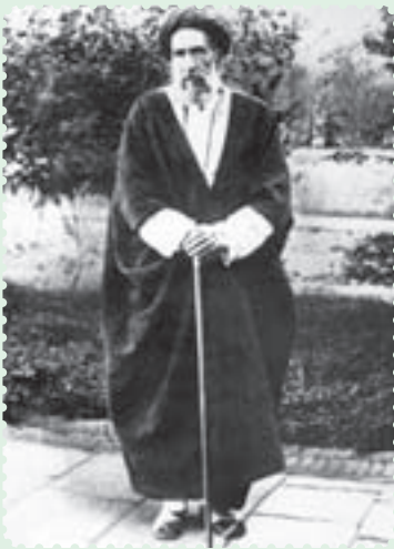
سید حسن مدرس نماینده ادوار مختلف مجلس شورای ملی

اقدام‌های خودسرانه و خشونت‌آمیز رضاخان در دوران تصدی وزارت جنگ، منجر به طرح استیضاح او در مجلس، به رهبری آیت‌الله سید حسن مدرس شد اما رضاخان، با طرح شایعه‌ی استعفای خود و صحنه‌سازی، طرفدارانش را علیه مجلس تحریک کرد و مخالفان را مورد ضرب و شتم و ارباب، قرارداد.