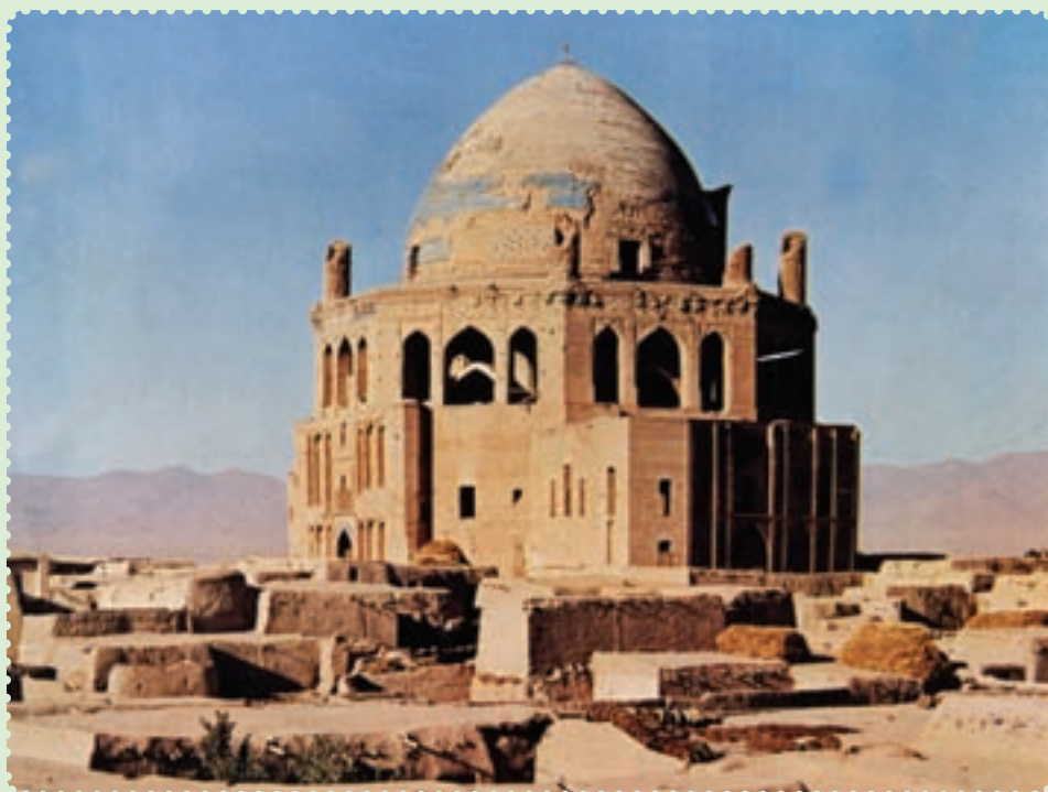
مقبره الجایتو. سلطانیه

از سوی چنگیزخان انجامید. این حادثه بهانه‌ای برای حمله به ایران بود. ۱ لشکرکشی مغولان یکی از بزرگ‌ترین راهپیمایی نظامی تاریخ به‌شمار می‌رود. حدود ۲۵۰ هزار نفر از قبایل مغول، در سرمای سخت از سرزمین مغولستان در شمال چین، به فرمان‌دهی تموچین (چنگیزخان) به سوی ایران سرازیر شدند. ۲ هدف نخستین آن‌ها شهر آترار بود، اما پس از قتل عام اهالی این شهر و دستگیری عاملان قتل بازرگانان، به سوی شهر بخارا و سایر ایالت‌های ایران پیشروی کردند. ۳ حمله‌ی مغول هم‌چون طوفانی سهمگین، نه‌تنها طومار حکومت خوارزمشاهی را در هم پیچید، بلکه بیش‌تر شهرهای ایران را ویران و مظاهر تمدن باشکوه دوران اسلامی را نابود کرد. دامنه‌ی این تندباد، علاوه بر ایران، بخش‌های زیادی از جهان اسلام را نیز درنوردید. ۴