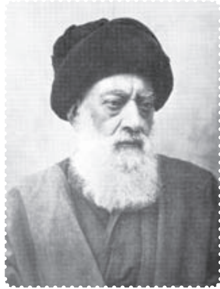
آیت الله طباطبایی

قیام شومند. در ادامه‌ی این جریان و همزمان با سفر سوم مظفرالدین‌شاه به اروپا، عده‌ای از بازرگانان در حرم حضرت عبدالعظیم (ع) تحصن کردند. ۱