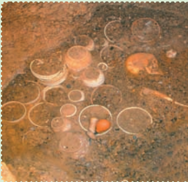
آثار یافت‌شده در شهر سوخته

پس از مدتی، زردشت که پیامبر ایران باستان است در میان ایرانیان ظهور کرد. او مردم را به پیروی از خدای یگانه که اهورامزدا نام داشت، دعوت کرد و مروج اندیشه، گفتار و کردار نیک بود. اعتقاد به سرای آخرت و جهان پس از مرگ، عقیده به آخرالزمان و ظهور یک منجی که حکومتی با عدل و داد و به دور از ناپاکی و ستم برپا خواهد کرد، از بنیان‌های استوار و اعتقادی ایرانیان بوده است که آن‌ها را از سایر ملل دوران باستان متمایز می‌ساخت. ۲