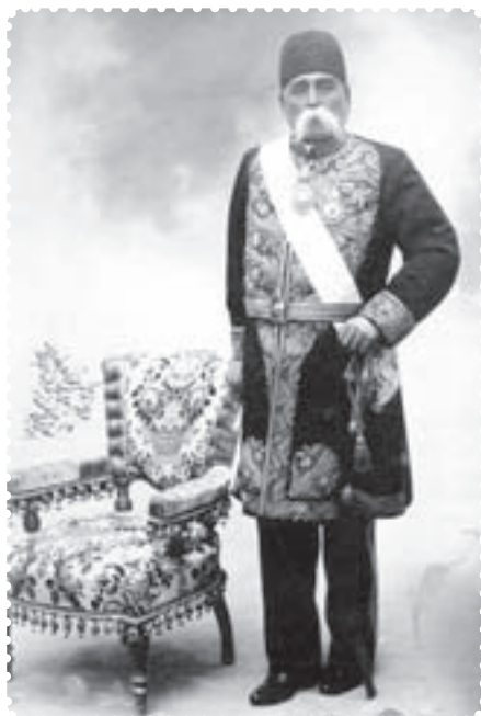
عبدالمجید میرزای عین الدوله

کشمکش بین طرفداران استبداد و عدالت خواهان، شدت گرفت. دولت به وحشت افتاد و با پا در میانی حاج میرزا ابوالقاسم امام جمعه، به طور موقت، قضیه فیصله یافت. حاج میرزا ابوالقاسم، داماد ناصرالدین شاه بود. او از جانب شاه به امامت جمعه‌ی تهران منصوب شده بود و از وی و دربار، پشتیبانی می‌کرد.