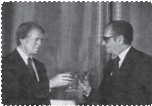
کارتر و شاه

در این درس با وضعیت کشور در آستانه‌ی انقلاب اسلامی آشنا می‌شوید. سوء استفاده‌ی آمریکایی‌ها از ایران تحت سلطه، روی کار آمدن جیمی کارتر، چگونگی برخورد با زندانیان سیاسی، سفر کارتر به ایران، رحلت آیت‌الله حاج آقا مصطفی خمینی انتشار مقاله‌ی اهانت‌آمیز نسبت به امام خمینی، قیام نوزدهم دی قم و کشتار هفده شهریور ۱۳۵۷ در تهران مهم‌ترین موضوع‌های مورد بررسی در این درس است.