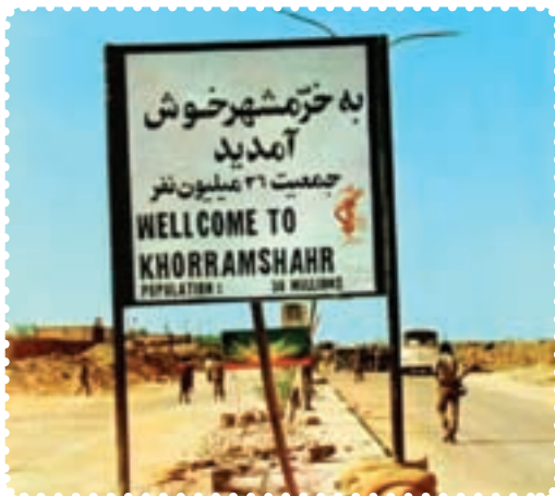
ورودی شهر خرمشهر در زمان جنگ تحمیلی

کمک به دفاع ملی دریغ نورزیدند. پس از چند هفته، دشمن متجاوز دریافت که خیال تصرف ایران، خام و ناپخته بوده است. پیروزی‌های بی‌دری ایران در جبهه‌های جنگ، به تقویت وحدت ملی در کشور انجامید. با همت غیور مردان ایران، آبادان از محاصره خارج و خرمشهر آزاد شد. دیری نگذشت که دشمن متجاوز در بقیه‌ی نقاط مرزی نیز تن به شکست‌های بزرگی داد. با شکست‌های بی‌دری عراق در صحنه‌های جنگ، برخی دولت‌های عربی و غربی، به میزان کمک‌های آشکار و پنهان خود به عراق، افزودند.