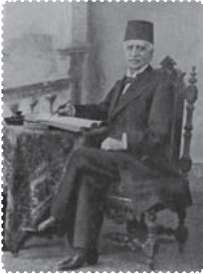
میرزا ملکم خان

بی تردید افرادی که زیر نفوذ این دولت‌های استعماری بودند، در دادن این امتیازها نقشی چشمگیر داشتند. هم چنان که میرزا حسین خان سپهسالار و میرزا ملکم خان، عاملان اصلی واگذاری امتیاز رویترو و امتیاز لاتاری به دولت استعماری انگلیس بودند.