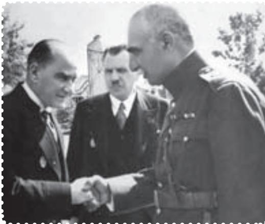
رضا شاه هنگام ملاقات با آتاتورک در ترکیه

تغییر کلاه و لباس، بخشی از برنامه‌ی شبیه‌سازی جامعه‌ی ایران و هم‌رنگ شدن مردم آن با اروپایی‌ها بود. ۱ لباس و پوشاک هر جامعه، به تناسب اعتقادات دینی، فرهنگ، آداب و رسوم ملی و شرایط اجتماعی و اقلیمی با دیگر جوامع، متفاوت است. اقوام ایرانی، از دیرباز، دارای لباس و پوشش مخصوص به خود بوده‌اند. نوع لباس و پوشش هر ملت نمایشگر هویت آن مردم است که