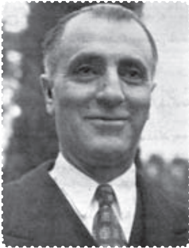
فصل الله زاهدی

لویی هندرسن سفیر آمریکا که نقش مهمی در روزهای حساس کودتا برعهده داشت، به دکتر مصدق تکلیف کرد که از پست خود کناره‌گیری کند ولی دکتر مصدق با عتاب او را از خانه‌اش بیرون کرد. ۱ علاوه بر این دکتر مصدق با ممنوع کردن تظاهرات، ۲ عملاً «خیابان‌ها را از هواداران خود خالی کرد». ۳ اگر چه شرایط و اوضاع سیاسی در ۲۸ مرداد بسیار متفاوت با سی‌ام تیر ماه ۱۳۳۱ بود اما دولت مصدق نتوانست از آنچه که در اختیار داشت، برای مقابله با کودتا استفاده کند. ۴