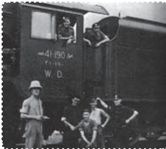
اشغالگران از راه آهن ایران برای مقاصد نظامی خود استفاده می‌کردند.

سرانجام در سوم شهریور ماه ۱۳۲۰/۲۵ اوت ۱۹۴۱ سفیران انگلیس و شوروی، طی