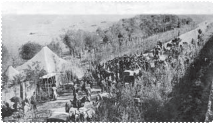
بازگشت علما از مهاجرت کبری

مظفرالدین شاه تسلیم خواسته‌های مردم شد. او عین‌الدوله را عزل کرد و فرمان تشکیل مجلس شورای ملی را در ۱۴ مرداد ۱۲۸۵ صادر کرد. هفت روز بعد، علما، با استقبال پرشکوه مردم، از قم بازگشتند. شهر چراغانی و جشن شادی به پا شد و در ۲۸ مرداد، اولین دوره‌ی مجلس شورای ملی با حضور نمایندگان تهران تشکیل گردید. عده‌ای از سیاستمداران مشروطه‌خواه، به تدوین قانون اساسی پرداختند. ۱ آنان با عجله آن را نوشتند و به امضای مظفرالدین شاه رساندند. شاه، ده روز پس از امضای قانون اساسی، درگذشت. به این ترتیب، کشور استبداد زده‌ی ما، با بهره‌گیری از اندیشه‌های سیاسی عالمان بزرگ دینی، کوشش فرهیختگان جامعه و مجاهدت مردم، به حکومتی دست یافت که می‌بایست براساس قانون اداره می‌شد.