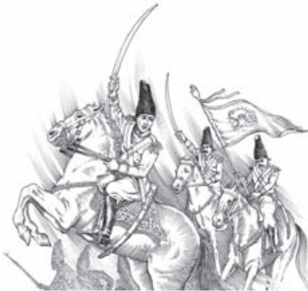
آقا محمدخان مؤسس حکومت قاجاریه

به این ترتیب، آقا محمدخان توانست سلسله‌ی قاجار را در ایران بنیاد نهد. وی تهران را که در آن زمان روستایی در حومه‌ی ری بود به پایتختی برگزید. این سلسله از سال ۱۱۷۴ تا ۱۳۰۴ ش. یعنی قریب صد و سی سال، بر ایران فرمانروایی کرد.