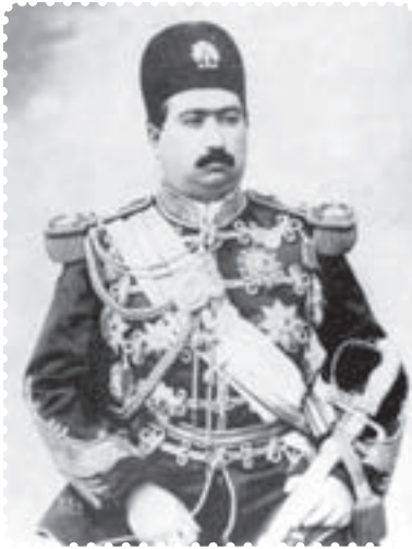
محمد علی شاه قاجار

بعد از مظفردالدین شاه، ولیعهد او، محمدعلی میرزا، با عنوان محمدعلی شاه، به سلطنت رسید. محمدعلی شاه، یکی از شاهان خودکامه‌ی دوره‌ی قاجار بود که نمی‌خواست در برابر قانون اساسی و مجلس شورای ملی تمکین کند. او در ۲۸ دی ماه ۱۲۸۵ جشن تاج‌گذاری بر پا کرد و از اشراف و نمایندگان دولت‌های خارجی برای شرکت در این مراسم دعوت به عمل آورد، اما نمایندگان مجلس شورای ملی را دعوت نکرد. این، اولین بی‌اعتنایی محمدعلی شاه به مجلس بود. او ملت را بنده و برده‌ی خود می‌پنداشت و نمایندگان مجلس را برای دخالت در امور کشور و مشورت در سیاست، لایق نمی‌دانست. ۱