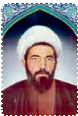
شهید دکتر محمد مفتاح

مرحله‌ی اول آن از ابتدای سال ۱۳۵۸ آغاز شد: در سوم اردیبهشت ماه ۱۳۵۸، تیمسار قرنی، اولین رئیس ستاد مشترک ارتش جمهوری اسلامی ایران را به شهادت رساندند. در دوازدهم اردیبهشت ماه همان سال، رئیس شورای انقلاب، علامه‌ی شهید، آیت‌الله مرتضی مطهری، که پس از امام، دارای بالاترین موقعیت دینی، سیاسی و فرهنگی کشور بود و از نظر علمی نیز موقعیت بسیار ممتازی در میان علمای زمان خویش داشت و از نظریه‌پردازان بسیار ارزشمند انقلاب اسلامی به‌شمار می‌رفت، به شهادت رسید. استاد مطهری از معماران و استوانه‌های فکری و فرهنگی انقلاب اسلامی بود که منشأ خدمات ارزشمندی برای اسلام و ایران شد. در چهارم شهریور همین سال، حاج مهدی عراقی، یکی از چهره‌های شاخص انقلابی، و فرزندش به شهادت رسیدند. مدتی بعد، آیت‌الله قاضی طباطبایی در تبریز، و در آذرماه، دکتر محمد مفتاح، استاد دانشگاه الهیات تهران و یکی از علمای برجسته‌ی انقلابی، به شهادت رسیدند. این ترورها عمدتاً توسط گروهک چپ التقاتلی «فُرقان» انجام می‌گرفت. با دستگیری اعضای اصلی فرقان در دی‌ماه ۱۳۵۸، این مرحله از ترورها خاتمه یافت. ۳