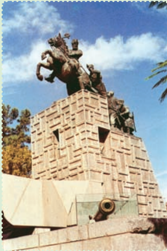
مجسمه و آرامگاه نادرشاه افشار در مشهد مقدس

به پایتختی خود انتخاب کرد و هیچ‌گاه خود را پادشاه نخواند و لقب و کیل‌الرعیایا را برگزید. کریم‌خان زند توانست با شیوه‌ی حکومت‌داری توأم با ملاحظت، عدالت و رفاه نسبی، نام نیکی از خود بر جای بگذارد. ۱ وی تلاش کرد روابط خارجی ایران را که به دلیل هرج و مرج و نبود امنیت دچار اختلال شده بود، سامان بخشد، هم‌چنین در برابر گسترش فعالیت‌های بازرگانی انگلستان در ایران ایستادگی کرد ۲ و از منافع نامشروع و استعماری این دولت جلوگیری به عمل آورد.