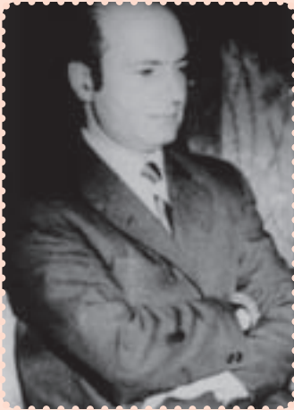
دکتر علی شریعتی (۱۳۱۲-۱۳۵۶ ش)