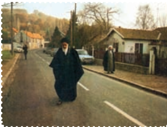
محل اقامت امام در پاریس، مرکز تجمع دانشجویان و ایرانیان ساکن آنجا بود.

با روزافزون شدن تظاهرات مردمی در ایران، رژیم عراق در پی یک توافق محرمانه با شاه و هماهنگی با آمریکا ۱ ، اقدام به اخراج امام خمینی از آن کشور کرد. امام در سیزدهم مهر ۱۳۵۷ به طرف کویت رفت. اما دولت کویت اجازه‌ی ورود به وی نداد. این درحالی بود که عراق نیز به امام، اجازه‌ی بازگشت نمی‌داد. در نتیجه امام خمینی و همراهانش، در پانزده مهر ۱۳۵۷ به فرانسه رفتند، ولی رئیس جمهور فرانسه، به