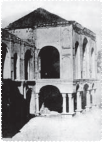
ساختمان مجلس شورای ملی پس از به توپ بستن توسط لیاخوف در ایام مشروطیت

طباطبایی و سیدعبدالله بهبهانی، توسط قزاق‌ها دستگیر، شکنجه و تبعید شدند. به دستور شاه، میرزا جهانگیرخان صوراسرافیل، ملک‌المتکلمین و سید جمال‌الدین واعظ اعدام شدند. بعضی از نمایندگان نیز که مورد تعقیب قرار گرفته بودند (از جمله تقی‌زاده)، به سفارت انگلیس پناه بردند. ۱ بدین گونه، دوباره، برای مدتی، استبداد حاکم شد. این دوره که یک سال به طول انجامید بار دیگر استبداد به جای مشروطیت حاکم شد. از این رو آن را دوره‌ی استبداد صغیر نامیده‌اند.