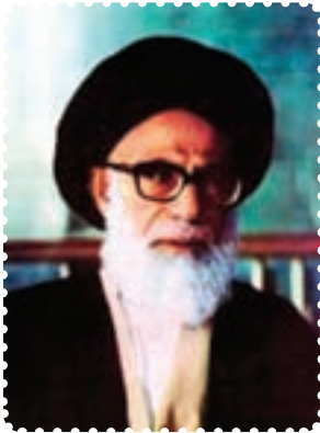
شهید آیت الله دستغیب

خواست تا به افسران فراری خارج از کشور بپیوندند. اما این قتل‌های ناجوانمردانه، مردم را در عزم خویش استوارتر می‌ساخت. ترورهای بی‌دری منافقین، تنها شخصیت‌های بلندپایه‌ی کشور را در بر نمی‌گرفت، آن‌ها فقط در عرض یک ماه، ۳۷۰ نفر زن، مرد و حتی کودک را آماج حملات خود قرار دادند. برای ایجاد رعب و وحشت، بسیاری از ترورها مقابل چشمان سایر اعضای خانواده انجام می‌شد. تروریست‌ها حتی در مساجد و کانون‌های دینی و مصلاهای نماز جمعه، به انفجار بمب و ترور ائمه‌ی جمعه و جماعات اقدام می‌کردند. شهدای محراب، آیت‌الله سیدعبدالحسین دستغیب در شیراز، آیت‌الله مدنی در تبریز، آیت‌الله صدوقی در یزد، آیت‌الله اشرفی اصفهانی در کرمانشاه و حجت‌الاسلام هاشمی‌زاد، دانشمند و روحانی مؤثر مشهد، از این جمله بودند. ترور این دانشمندان و حتی عالمانی از روحانیان اهل سنت، نشانگر این بود که دشمنان انقلاب بیش از هر چیز، از اندیشه‌ی متفکران اسلامی بیمناک‌اند.