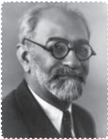
محمد علی فروغی

با انتقال سلطنت به سلسله ی پهلوی، محمدعلی فروغی (ذکاءالملک ۱ ) به عنوان اولین نخست‌وزیر دوران سلطنت رضاشاه منصوب شد. نخستین اقدام او، برپایی آیین تاج‌گذاری و نشستن رضاشاه بر تخت قدرت بود.