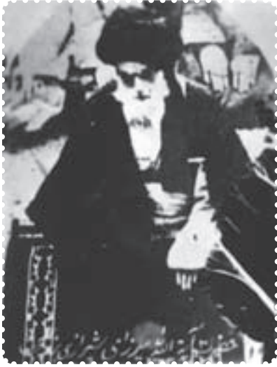
آیت‌الله میرزای شیرازی

و آیت‌الله شیخ فضل‌الله نوری در تهران و آیت‌الله میرزا جواد آقا مجتهد تبریزی در تبریز، از جمله‌ی این روحانیون بودند. آنان خطر سلطه‌ی استعمار انگلیس را به مردم گوشزد کردند. در این میان، شیخ فضل‌الله نوری، به عنوان نماینده‌ی میرزای شیرازی، مرجع بزرگ شیعیان، در ایران عمل می‌کرد و نقش اساسی در گرفتن فتوای تحریم تنباکو از مرجعیت بزرگ شیعه داشت.