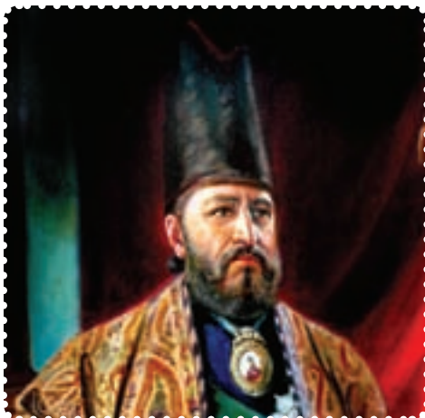
میرزاتقی خان امیرکبیر

کوتاه صدارت، برای حفظ تمامیت ارضی و مبارزه با دخالت بیگانگان، تلاش زیادی کرد. در روزگار او، سیاست داخلی و خارجی ایران به شدت تحت تأثیر دولت‌های بیگانه، به ویژه روسیه و انگلیس قرار داشت، و کار امیرکبیر در اتخاذ سیاست مستقل، بسیار دشوار و تحسین برانگیز بود.