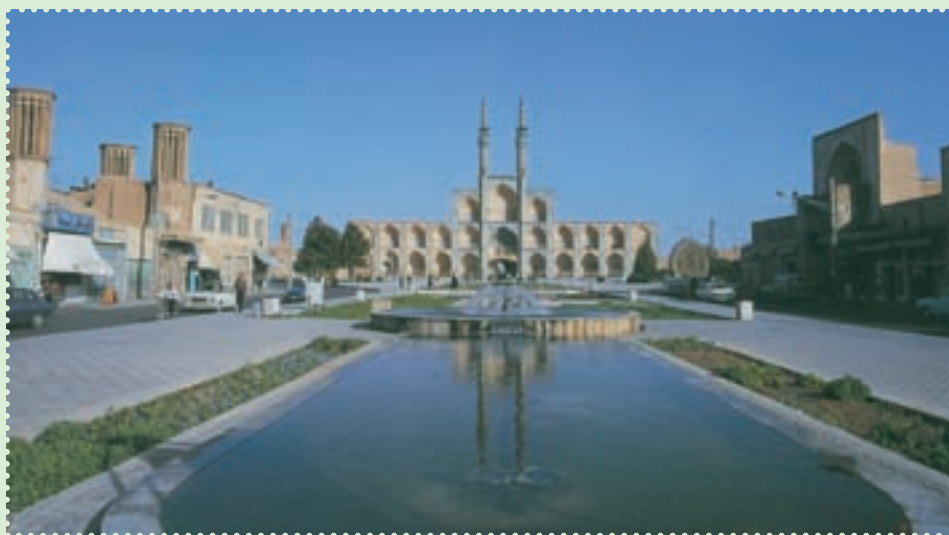
میدان تاریخی امیر چخماق در مرکز شهر یزد

پس از مرگ چنگیزخان، حدود یک قرن حکومت ایلخانان بر ایران تحمیل شد. ۱ اگرچه مغولان در عرصه‌ی نظامی‌گری بر ایران پیروز شدند، اما در عرصه‌ی فرهنگ و تمدن مغلوب ایران شدند. پویایی فرهنگ و تمدن ایران اسلامی، قوم مهاجم را در خود حل کرد. مغولان به تدریج دست از تندخویی کشیدند و اعتقادات خرافی خود را کنار گذاشتند. غازان‌خان، علاوه بر پذیرش آیین اسلام، تابعیت از خان بزرگ مغول را نیز کنار گذاشت و استقلال حکومت ایلخانی را کامل کرد. در این دوران، بزرگانی چون خواجه شمس‌الدین صاحب دیوان، خواجه نصیرالدین توسی، عظاملک جوینی، رشیدالدین فضل‌الله همدانی، مصلح‌الدین سعدی شیرازی و مولوی بلخی، با فعالیت‌های سیاسی، علمی و ادبی خود، علاوه بر مهارجوی ویرانگر مغولان، چراغ تمدن و فرهنگ ایران و اسلام را افروخته نگه داشتند. ۲ با آن‌که مغولان در آغاز ویرانی‌های بسیاری به همراه آوردند، ولی بر اثر آشنایی با فرهنگ ایران و اسلام، از طریق آنان فرهنگ، هنر و تمدن ایران و اسلام رواج یافت. پس از پایان حکومت ایلخانان، حکومت‌های ملوک‌الطوایفی و محلی متعددی چون تیموریان، آل جلایر، آل مظفر، سربداران و آل کرت، اتابکان، قراقویونلوها و آق قویونلوها طی قرن‌های هشتم و نهم ق بر ایران حکومت کردند، اما هیچ‌کدام نتوانستند یکپارچگی ایران را حفظ کنند. سرانجام در سال ۹۰۷ق، حکومت صفوی