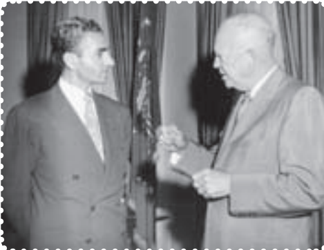
شاه در ملاقات با آیزنهاور رئیس‌جمهور آمریکا

آمریکا که از کمک به دولت دکتر مصدق اجتناب می‌کرد، پس از پیروزی کودتاچیان کمک‌های زیادی در زمینه‌های نظامی و اقتصادی به دولت کودتا کرد. ۱ با روی کار آمدن دولت نظامی زاهدی ۲ ، فضای تیره‌ای در جامعه ایران حکم فرما شد، فرمانداری نظامی تهران به سرتیپ تیمور بختیار سپرده شد. بختیار که افسری بی‌رحم و خونریز بود، برای استقرار و تثبیت حکومت کودتا، سرکوب نیروهای ضدکودتا