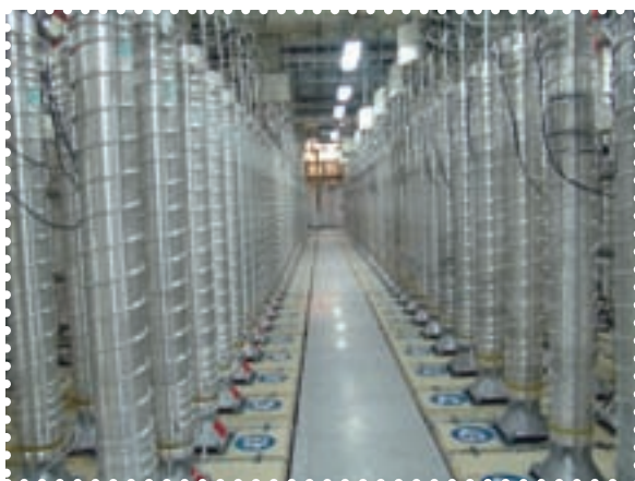
تأسیسات هسته‌ای نطنز

پیشرفت‌های عظیم در حوزه‌ی علم و فناوری از جمله دانش هسته‌ای، بیولوژی مولکولی و سلول‌های بنیادی، از دیگر دستاوردهای مهم انقلاب به‌شمار می‌روند. با وجود موانع، تهدیدها و تحریم‌های ناعادلانه‌ی کشورهای غربی، جمهوری اسلامی ایران با همت دانشمندان جوان ایرانی در ردیف کشورهای دارای فناوری هسته‌ای با کاربرد صلح‌آمیز قرار گرفته است. دست‌یابی به فناوری هسته‌ای از بزرگ‌ترین و افتخارآمیزترین دستاوردهای فنی و علمی انقلاب اسلامی است. چرخه‌ی کامل سوخت هسته‌ای، یعنی فرایند تبدیل اورانیوم طبیعی به انرژی هسته‌ای، دانشی بسیار پیچیده و پیشرفته است که تنها معدودی از کشورهای بزرگ صنعتی به آن دست یافته‌اند. با همت والا و عزم راسخ دانشمندان ایرانی