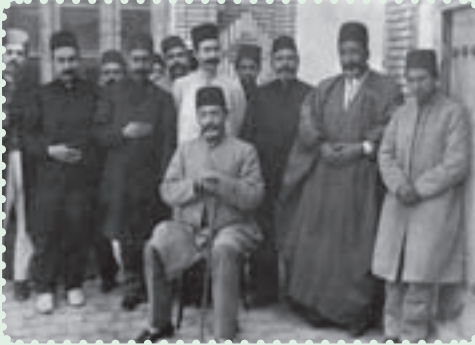
مخبر السلطنه (مهدی قلی هدایت) به هنگام و الیگری آذربایجان (بار دوم)

مخبر السلطنه درباره‌ی حجاب نوشته است: «... چادر رسم ایرانیان بود و ریشه در فرهنگ گذشته‌ی ایران داشت... در شاهنامه در سه جا ذکر «چادر» شده است و در گذشته، چادر حفاظ و فخر نجبا بود و ما که مدعی تجدید دوره‌ی پهلوانی و باستانی هستیم، در تخت جمشید و یا نقش‌های بیستون، صورت زن، نیست.» ۱