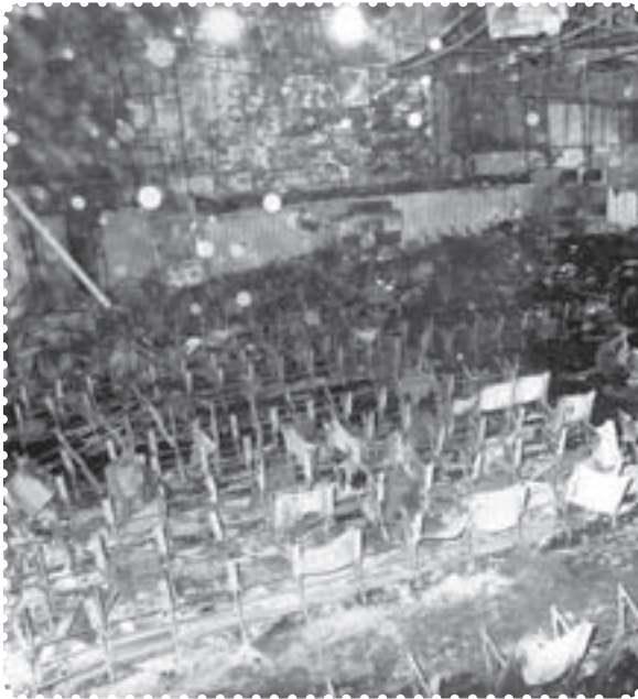
سینما رکس آبادان

روز هفدهم دی ماه ۱۳۵۶ به چاپ رسید. در آن مقاله، امام خمینی، به شدت مورد حمله و توهین قرار گرفته بود. ۱