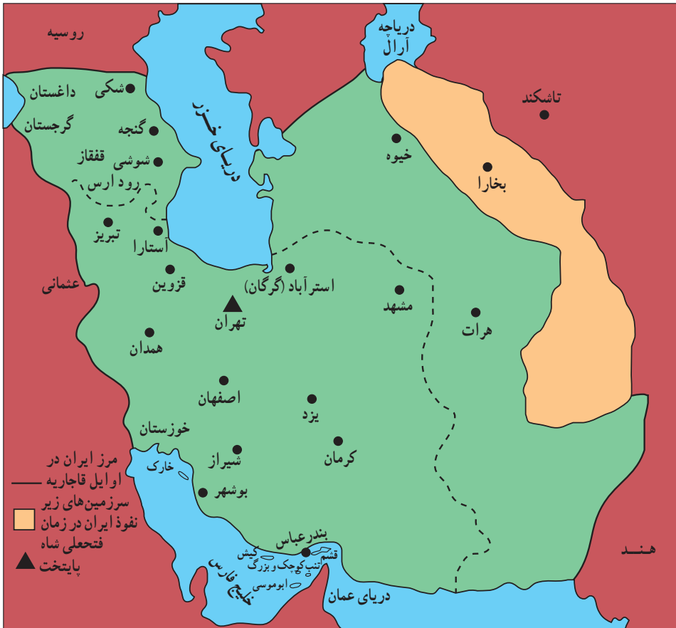
قلمرو ایران (در اوایل قاجاریه)

حساب می‌آمد، در واقع به منزله‌ی نادیده گرفتن استقلال کشور و به رسمیت شناختن دخالت روسیه در امور داخلی آن بود.