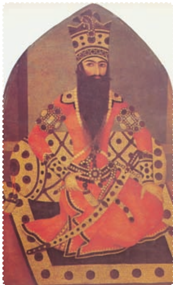
فتحعلی شاه، دومین پادشاه قاجاریه

جنگ‌های ایران و روس شد. این جنگ‌ها از سال ۱۱۸۲ تا ۱۱۹۱ ش. به درازا کشید، و به بسته شدن «عهدنامه‌ی گلستان» ۱ انجامید. به موجب این عهدنامه، ایران حاکمیت روسیه را بر ولایت‌هایی که تا آن زمان اشغال کرده بود به رسمیت شناخت. به این ترتیب ایالات داغستان و گرجستان و شهرهای باکو، دربند، شیروان، قره‌باغ، شگی، گنجه، موقان و قسمت بالای طالش، به روسیه واگذار شد. به علاوه، حق کشتی‌رانی در دریای خزر، از ایران سلب گردید، در برابر، روسیه نیابت سلطنت عباس میرزا را در ایران به رسمیت شناخت و رساندن او به سلطنت را تعهد کرد. این بند که ظاهراً امتیازی برای ایران به