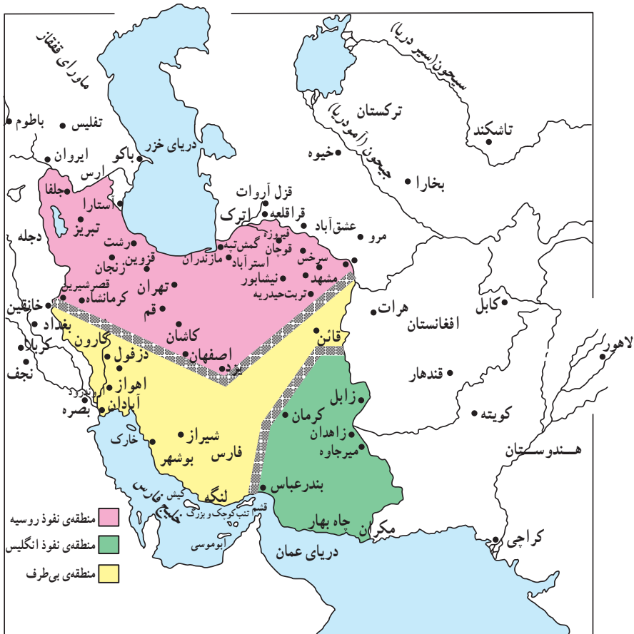
نقشه‌ی تقسیم ایران براساس قرارداد ۱۹۰۷

دارای ارزش حیاتی برای دفاع از هند بود، قلمرو نفوذ انگلستان مقرر گردید. قسمت سوم که شامل کویرها و بیابان‌های بی‌آب و علف بود، منطقه‌ی بی‌طرف و متعلق به ایران شناخته شد. منظور از این کار هم آن بود که دو دولت تا حدودی از یکدیگر فاصله بگیرند و از برخوردهای احتمالی بین آن‌ها، جلوگیری شود.