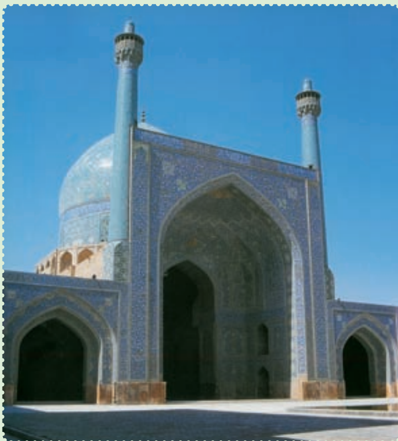
مسجد امام از آثار دوره‌ی صفوی در اصفهان

صفویان حکومتی تشکیل دادند که بیش از دو سده دوام یافت. در پرتو این حکومت مقتدر، علاوه بر برقراری امنیت و رونق اقتصادی، پیشرفت بازرگانی و کشاورزی و صنعت، تشکیل ارتش منظم و سیاست خارجی مقتدرانه، آن‌ها توانستند فرهنگ و تمدن ایران و اسلام را بار دیگر شکوفا کنند. هنر و معماری در این دوره نیز از نظر کمی و کیفی توسعه و تحول یافت. اصفهان، پایتخت صفویان، دارای مجموعه‌ای از معماری عصر صفوی است که نشان می‌دهد، معماری ایرانی