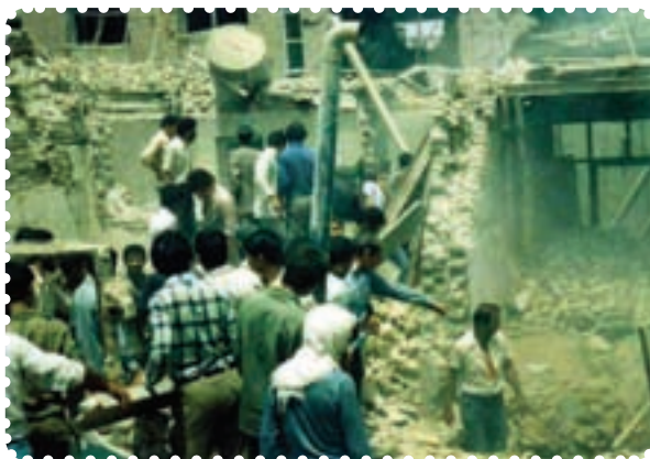
دزفول در پی یکی از حملات موشکی

در طول مدت جنگ شهرها، عراق موشک‌های دوربرد بسیاری به شهرهای ایران پرتاب کرد. ۱ به‌علاوه، استفاده از گازهای شیمیایی در جبهه‌های جنگ را در پیش گرفت. در چنین شرایطی، آمریکا رسماً به کمک نیروهای صدام آمد. اعزام ناوگان جنگی به خلیج فارس و هدف قرار دادن هواپیمای مسافربری ایران در تیرماه ۱۳۶۷، از جمله اقدامات ناجوانمردانه‌ی آمریکایی‌ها بود.