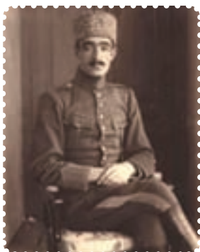
محمد تقی خان پسیان

در تبریز، کلنل محمد تقی خان پسیان در خراسان و تنگستانی‌ها در جنوب، با حمایت علمای فارس، قیام‌های پی در پی را علیه نفوذ انگلستان سازمان دادند. این مسائل، به اضافه‌ی مخارج سنگین پلیس جنوب که از سوی انگلیسی‌ها اداره می‌شد و اهمیت روزافزون نفت، ضرورت وجود یک حکومت مرکزی مقتدر و ابسته را، برای انگلستان، دوچندان می‌کرد. ۱