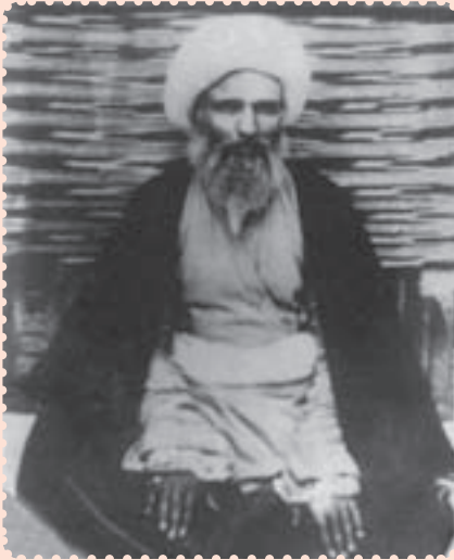
آخوند ملامحمد کاظم خراسانی (۱۲۹۰-۱۲۱۸ ش)

در سال ۱۲۱۸ ش. در مشهد متولد شد و در بیست و دو سالگی به تهران مهاجرت کرد. پس از مدتی تحصیل فلسفه، به نجف مشرف شد و دو سال محضر درس شیخ مرتضی انصاری را درک کرد. آخوند خراسانی پیش‌تر تحصیلاتش نزد میرزای شیرازی بود، اما خود نیز مستقلاً در نجف حوزه‌ی درس تشکیل می‌داد، و گفته می‌شود ۱۲۰۰ شاگرد از محضرش استفاده می‌کردند.