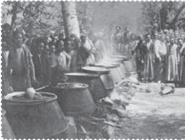
دیگ‌های غذا در سفارت انگلیس برای مشروطه خواهان

زیارتگاه‌ها و اماکنی صورت می‌گرفت که مورد احترام مردم قرار داشت و با باورهای دینی آن‌ها سازگار بود. مشروطه‌خواهان، بدون پناهندگی به سفارت انگلستان، می‌توانستند به خواسته‌های خود دست یابند. دولت انگلستان بر خلاف دولت روسیه که از دربار حمایت می‌کرد، به ظاهر