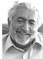
سید محمد غرضی

متولد ۲۱ آبان ۱۳۲۷ در شهر سرخه است. وی نماینده مجلس خبرگان رهبری از سال ۱۳۷۸ و عضو مجمع تشخیص کابینه‌ی دولت مصلحت نظام از سال ۱۳۷۰ است. از سال ۱۳۶۸ به عضویت در شورای عالی امنیت ملی در آمد و از سال ۱۳۷۱ نیز ریاست تحقيقات مرکز استراتژیک مجمع مصلحت و پژوهی و دبیر شورای عالی امنیت ملی از سال ۱۳۶۸ تا ۱۳۸۴ به عنوان معاون اول رییس جمهور برگزیده شد. او عضو پیوسته فرهنگستان علوم ایران، عضو شورای عالی انقلاب فرهنگی و عضو مجمع تشخیص مصلحت نظام است.