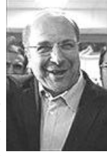
محمد باقر قالیباف

زندگی سیاسی محمد غرضی از سال ۱۳۵۲ یعنی سه سال پس از آنکه وی به دلیل مخالفت با رژیم شاهنشاهی به زندان افتاد، آغاز شد و زمینه‌ای فراهم کرد تا وی در سال ۱۳۵۵ برای ادامه مبارزات سیاسی خود عازم نجف شود. وی قبل از ترک کشور، به عضویت سازمان مجاهدین خلق ایران در آمد و از زمانیکه امام خمینی عازم پاریس شد تا زمان بازگشت به وطن، آن بزرگوار رهبرای کرد. طی سالهای ۱۳۶۰ تا ۱۳۶۴ غرضی به عنوان وزیر نفت در کابینه میرحسین موسوی و در سال‌های ۱۳۶۴ تا ۱۳۷۶ به عنوان وزیر پست و تلگراف و تلفن در کابینه هاشمی رفسنجانی ایفای نقش کرد. وی نمایندگی دور اول مجلس شورای اسلامی، استانداری خوزستان، استانداری کردستان، فعالیت درسپاه پاسداران را در سوابق خود داراست.