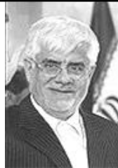
محمد رضا عارف

در شهریور ۱۳۳۳ متولد شد. او در رابطه با این فعالیت مقدس در جبهه حضور یافت و سال ۶۵ در عملیات کربلای ۵ به درجه جانبازی نایل آمد. وی در سال ۶۸ به وزارت امور خارجه رفت و در سال ۸۰ به دفتر مقام معظم رهبری رفت و در سمت مدیریت بررسی‌های جاری دفتر رهبر انقلاب به خدمت ادامه داد. به عضویت شورای فرماندهی سپاه درآمد. در شهریور ۱۳۶۰ از سوی حضرت امام احمدی‌نژاد رئیس دولت نهم برای تصدی وزارت امور خارجه مطرح شد اما بر اساس مصلحت، اداره معاونت اروپا و آمریکای این وزارتخانه را بر عهده گرفت. وی در حال حاضر دبیری شورایعالی امنیت ملی و مسئولیت پیگیری موضوع هسته‌ای کشورمان را بر عهده دارد.