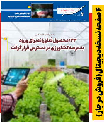
۴ صفحه نسخه دیجیتال (فروش در چار)