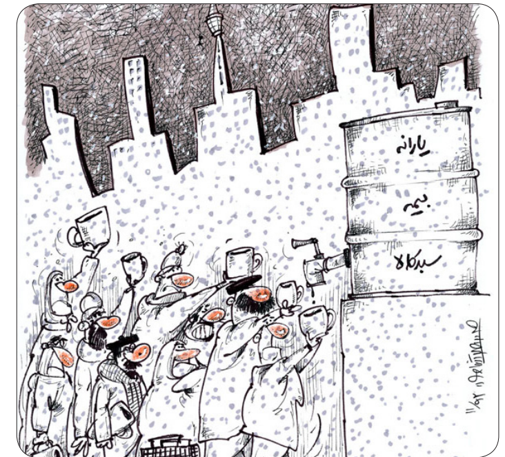
روحانی (در تبلیغات ریاست جمهوری): من می خواهم کاری کنم که دولت به سوی مردم دست دراز کند. نه اینکه ملت بزرگ و عزیز ما به سمت دولت دست دراز کند.