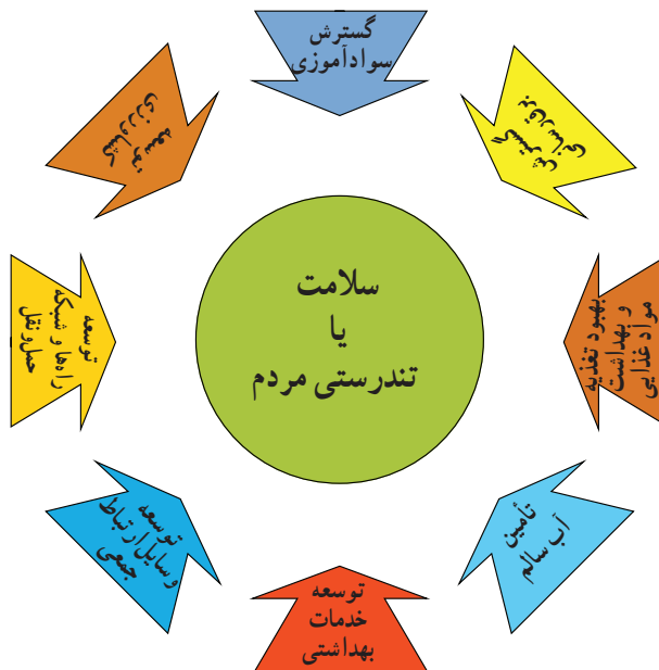
شکل ۲-۳- تجسم آنچه از هماهنگی بین بخشی برای تأمین سلامت مردم انتظار می‌رود.

ج) هماهنگی بین بخشی: ذکر این مطلب لازم است که سلامت افراد فقط با ارائه خدمات بهداشتی تأمین نمی‌شود بلکه سلامت مردم به آنچه می‌خورند، می‌نوشند، شغلی که در آن مشغولند، مسکن مناسب و بهداشتی، تفریحاتی که برای اوقات فراغت انتخاب می‌کنند و... بستگی دارد. پس در واقع باید بین بخش بهداشت و بخش‌های دیگر مانند کشاورزی، صنعت، حمل و نقل، آموزش و پرورش و وسایل ارتباط جمعی، همکاری وجود داشته باشد (شکل ۲-۳).