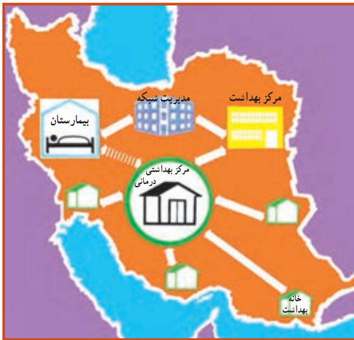
شکل ۴-۳- نظام عرضه خدمات بهداشتی

ز) مدیریت شبکه شهرستان: وظیفه هماهنگ‌سازی واحدهای مختلف بیمارستان و مرکز بهداشت شهرستان و نظارت بر فعالیت آنها را به عهده دارد، مدیر شبکه شهرستان، نماینده وزارت بهداشت، درمان و آموزش پزشکی در سطح شهرستان تلقی می‌شود. این نظام که اجزای آن در ارتباط و پیوستگی علمی و عملی با یکدیگر می‌باشند، اجراکننده برنامه‌های پیش‌بینی شده بهداشت و درمان کشور خواهد بود (شکل ۴-۳).