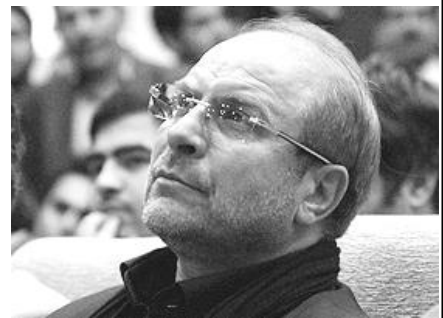
عدالت اجتماعی و حقوق مردم

وی در خصوص عدالت اجتماعی افزود: اگر به حوزه عدالت اجتماعی نگاه کنیم این سوال پیش می‌آید که یک کشاورز یا به سن گذاشته که دیگر امکان کار کردن ندارد چگونه باید زندگی خود را تأمین کند؟ این فرد کجا بیمه شده است؟ نقش دولت در این جا کجاست؟ حوزه کشاورزی، نیرو، امکانات و تجهیزات یکی از چالش‌های بزرگ کشور است.