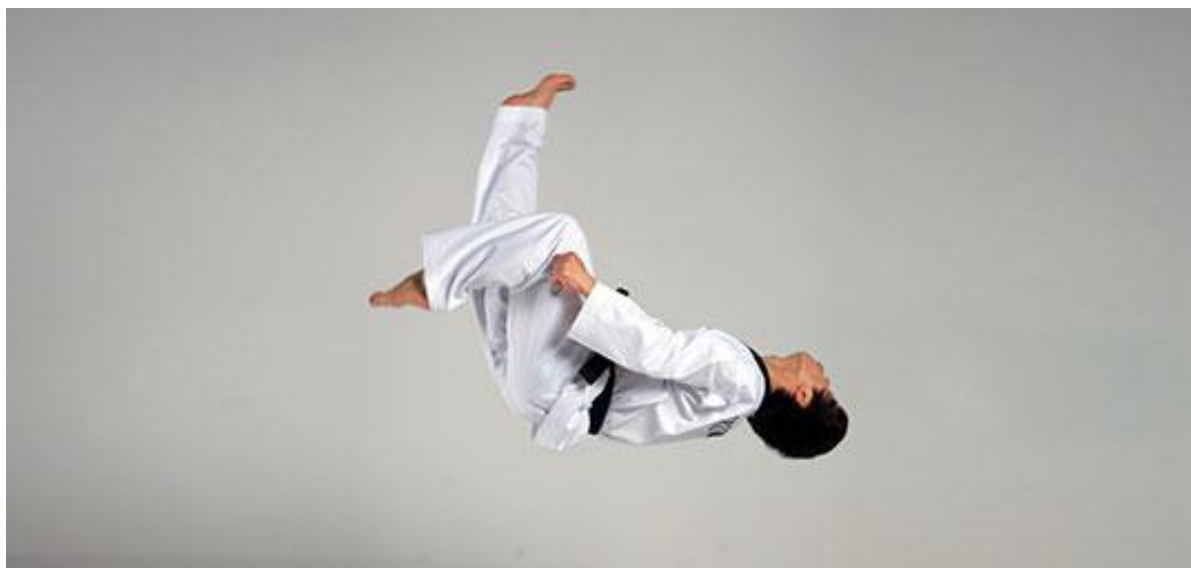
Gongjungjebi - chagi

-کونگ جونگ جبی - (آپ) چاگی : (آپ چاگی با پریدن و پشتک زدن)