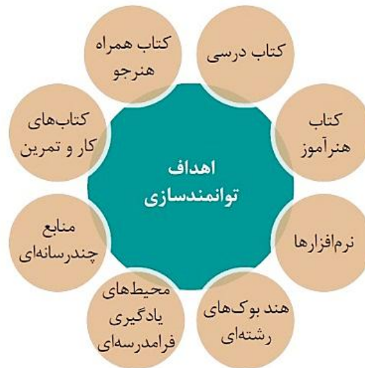
رویکرد تدوین بسته یادگیری براساس اهداف توانمندسازی