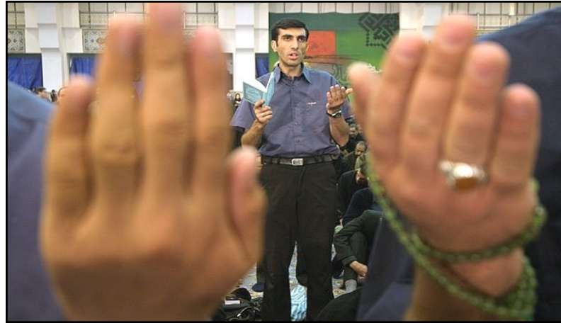
اعتکاف در کازرون = ۲

اعتکاف تمام شد و هم سفران معتکف به سلامتی به وطن و منزل خویش برگشتند. اما چگونه می‌توان اعتکاف را در طول سال تداوم بخشید و برای سال آینده آماده شد. تداوم اعتکاف با تداوم ارتباط با خدا امکان پذیر است. اگر چه دیگر فرصت سه روز نشستن در خانه ی خدا بدست نیاید، اما روزی یک مرتبه به خانه ی خدا می‌توان سر زد و اگر تمام شب و روز به عبادت سپری نمی‌شود، می‌توان نماز خود را به جماعت در مسجد بجای آورد. اگرچه فرصت یک شبانه روز تامل و تفکر در روزهای دیگر به دست نمی‌آید اما می‌توان وقتی از شبانه روز را به خلوت کردن با خدای تبارک و تعالی و تفکر در احوال نفس پرداخت. نقل است که پدر بزرگوار آیت الله قاضی هنگامی که قصد مراجعت از نجف به تبریز داشت، استادشان به او سفارش کرد که در شبانه روز ساعتی را برای خلوت با خدای خودش کنار بگذارد. سال بعد که گروهی از مردم تبریز به دیدار استاد رسیدند، استاد از احوال شاگرد خویش پرسید و جواب دادند که: «آن یک ساعتی را که شما سفارش فرموده بودید تمام شبانه روز آقا را گرفته است.»