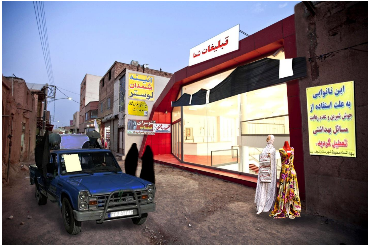
زمینه، فرم را می سازد

چندی پیش به اثری از چند معمار ایرانی در سایت اینترنتی آرک دیلی ۳ برخوردم که کلنجرهای ذهنی پس از آن مرا بر آن داشت تا علیرغم دانش خرد خود چند خطی راجع به آن بنویسم. اشاره ی من به اثری موسوم به "فروشگاه بی نام" در خیابان ملاصدرا، در مرکز شهر نجف آباد اصفهان است. حجمی کشیده با بدنه ی شمالی شیشه ای و شفاف که پوسته ای قرمز رنگ آن را در بر گرفته. از دید یک عابر، این بدنه تمامی دیالوگی است که این بنا با محیط اش برقرار می کند، البته پیش از ورود به آن. ورودی فروشگاه در طبقه ی همکف آن که سطح میانی پروژه است قرار دارد. فضای داخلی فروشگاه سفید و شسته رفته است، به همراه بازی رنگ قرمز، پلکان ها و نورگیری در سقف در انتهای این حجم کشیده و محصور در دل بافت. معماران برای بهره گیری از نور طبیعی نمای شمالی را تمام شیشه کار کرده اند تا نور غیر مستقیم و دلنشین وارد فضا شود، از آن سو برای رها کردن فضای انتهایی از ظلمات از نورگیر سقفی بهره گرفته اند تا نور پر انرژی و زندگی بخش جنوبی حال و هوایی متفاوت به این بخش بدهد. نکته ی خوب در این است، با آنکه تنها دو بدنه ی کم مساحت شمالی و جنوبی امکان نورگیری برای این حجم کشیده را داشته اند و