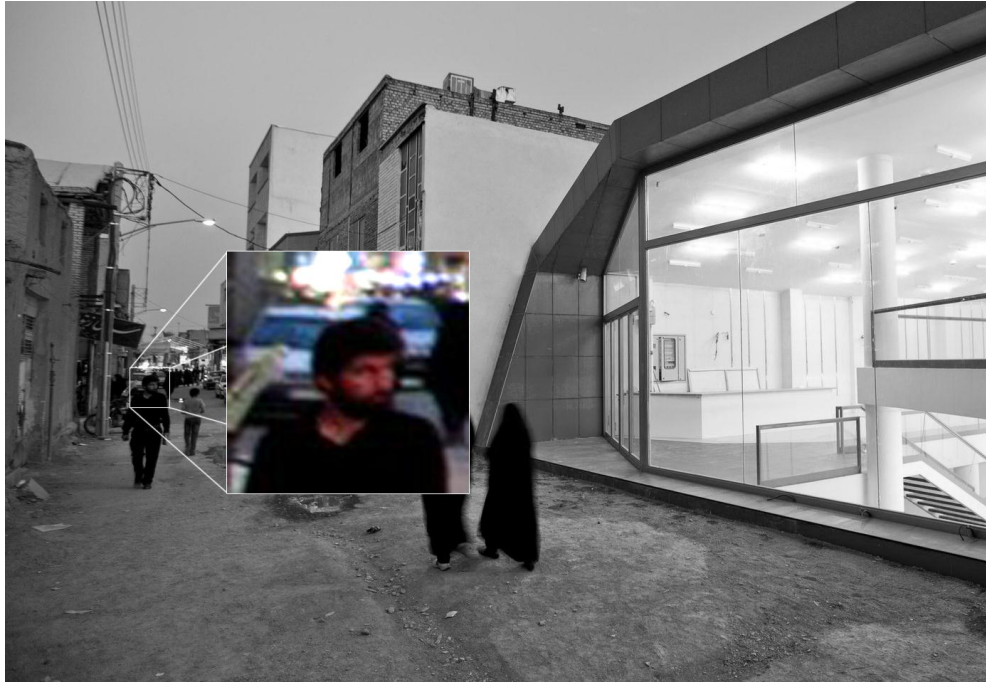
نگاه پر معنا و پر سوال عابر!