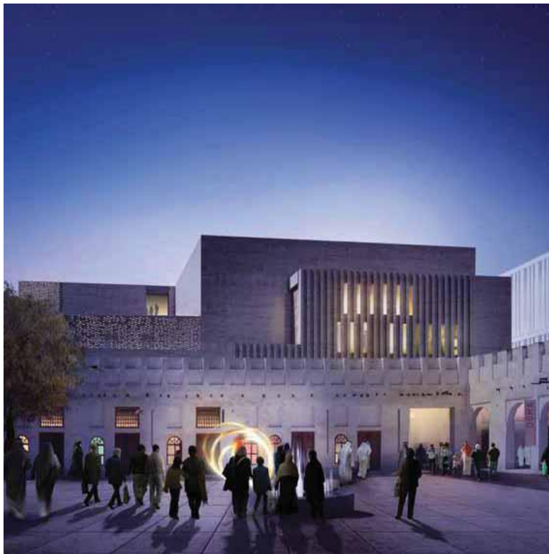
پروژه ی مشرب، احیای فرهنگ معماری