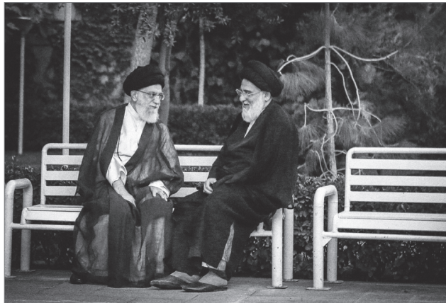
تصویری از مرحوم آیت‌الله هاشمی شاهرودی در کنار رهبر انقلاب

آن کسی که برای انقلاب، برای امام، برای اسلام کاری کند، به‌مجردی که ببیند حرف او، حرکت او موجب شده است که یک جهت‌گیری‌ای علیه این اصول به وجود بیاید، فوراً متنبه می‌شود. چرا متنبه نمی‌شوند؟ وقتی شنفتند که از اصلی‌ترین شعار جمهوری اسلامی - «استقلال، آزادی، جمهوری اسلامی» - اسلامش حذف می‌شود، باید به خود بیایند؛ باید بفهمند که دارند راه را غلط می‌روند، اشتباه می‌کنند؛ باید تبری کنند... باید متنبه بشوند، باید خودشان را بکشند کنار، بگویند نه، ما با این جریان نیستیم... باید بفهمند؛ بفهمند که کارشان یک عیبی دارد؛ بلافاصله برگردند بگویند نه، مانمی‌خواهیم حمایت شما را... یا می‌شود با بهانه‌ی عقلانیت، این حقایق روشن را ندیده گرفت، که ما عقلانیت به خرج می‌دهیم؛ این عقلانیت است که دشمنان این ملت و دشمنان این کشور و دشمنان اسلام و دشمنان انقلاب، شما را از خود بدانند و برای شما کف و سوت بزنند، شما هم همینطور خوشتان بیاید، دل خوش کنید؛ این عقلانیت است؟! ۸۸/۹/۲۲