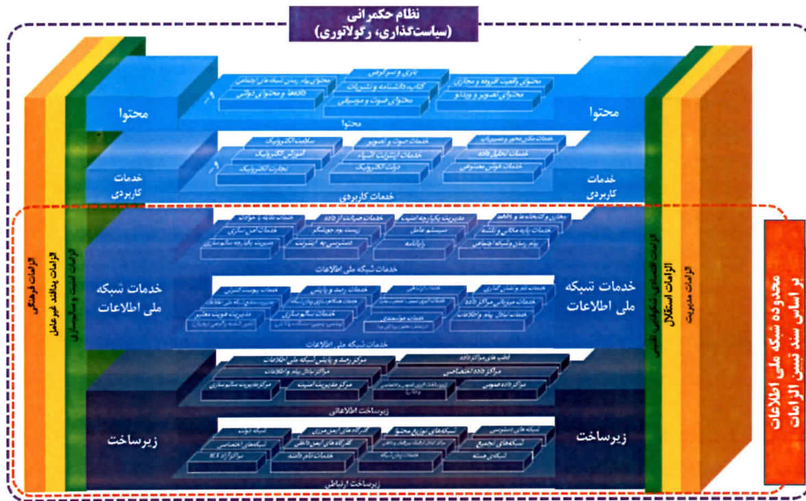
شکل شماره ۱- مدل مفهومی فضای مجازی کشور