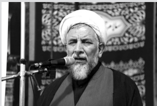
رییس کل دادگستری استان قزوین: