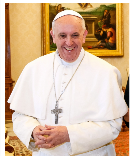
هم‌اکنون پاپ فرانسیس ۲۶۶مین پاپ کلیسای کاتولیک و عالی‌مقام‌ترین رهبر کلیسای کاتولیک محسوب می‌شود.

کلیسای کاتولیک روم یا کلیسای کاتولیک رومی یا کلیسای کاتولیک یکی از سه شاخه اصلی مسیحیت است. کلیسای کاتولیک با بیش از یک میلیارد نفر پیرو بزرگ‌ترین شاخه از کلیسای مسیحی شناخته می‌شود. کلیسای کاتولیک اهداف خود را بر «گسترش انجیل عیسی مسیح، مدیریت کلیسا از طریق حاکمیت دینی و اعمال خیریه» تعریف می‌کند. [1] کلیسای کاتولیک هم‌چنین برنامه‌های اجتماعی و موسسات خیریه مسیحی را نیز اداره می‌کند، از جمله مدارس، دانشگاه‌ها، بیمارستان‌ها، پناهگاه‌ها و صومعه‌ها که به تبلیغ مسیحیت و کلیسای کاتولیک می‌پردازند و هم‌چنین به افراد نیازمند، خدمات رفاهی می‌رسانند [2] هم‌اکنون دولت‌شهر واتیکان در درون شهر رم در کشور ایتالیا جای دارد.