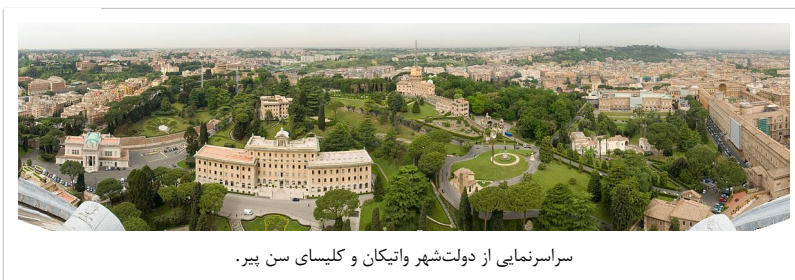
سراسرنمایی از دولت‌شهر واتیکان و کلیسای سن پیر.

واتیکان محل اقامت پاپ، رهبر کاتولیک‌های جهان و مرکز کلیسای کاتولیک است. واتیکان با مساحتی در حدود ۴۴ هکتار، کوچک‌ترین کشور دنیا و با جمعیتی در حدود ۸۰۰ نفر، کم‌جمعیت‌ترین کشور مستقل دنیا محسوب می‌شود. [4][5][6]