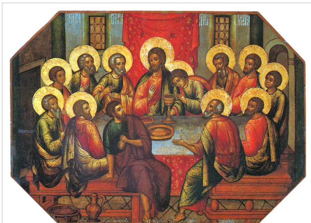
در عالم مسیحیت معمولاً در نقاشی‌های کشیده شده از قدیسین، هاله‌ای از نور قرار دارد.