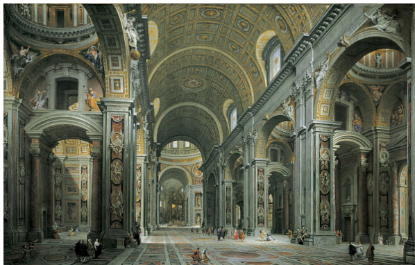
کلیسای کاتولیک در شکل‌گیری جنبش رنسانس در اروپا و دوران گذار از سده‌های میانه به دوران جدید، نقش مهمی را ایفا کرد.