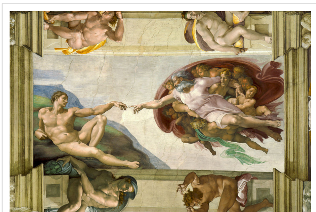
آموزه‌های کلیسای کاتولیک نظریه تکامل در مورد پیدایش انسان را رد نمی‌کند، اما بر روایت آفرینش در انجیل تأکید دارد. نقاشی: آفرینش آدم اثر میکل آنژ.

«تثلیث» یکی از اعتقادات بنیادین مسیحیت است. قرائت کلیسای کاتولیک روم از تثلیث، چنین تعریف شده است: «تثلیث واحد است». [10] «اعتراف به گناهان» و «طلب استغفار» نزد کشیش در کلیسای کاتولیک، آئینی مقدس شماره شده می‌شود. [11]