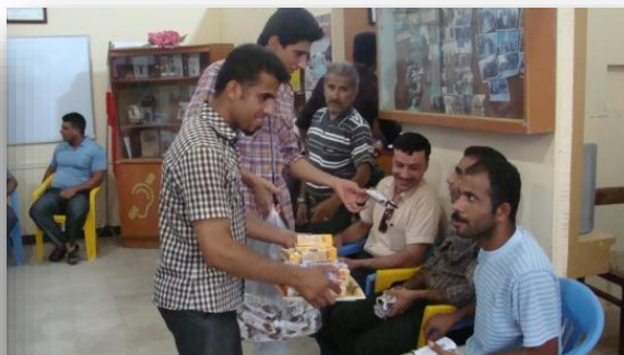
اردویی از مشهد

در تاریخ ۹۰/۳/۱۵ هیئت مدیره انجمن خانواده ناشنویان خرمشهر به همراه جمعی از ناشنویان استان خوزستان به مدت ۷ روز اردویی به بارگاه ملکوتی امام رضا (ع) برگزار نمودند. در این اردو ناشنویانی که حضور داشتند بسیار باهم صمیمی و مهربان بودند و خاطرات بسیاری برای همه ی عزیزان به جا، ماند. ما نیز از بارگاه ملکوتی آن حضرت برای کلیه عزیزان سلامتی و رحمت خداوند را خواستاریم.