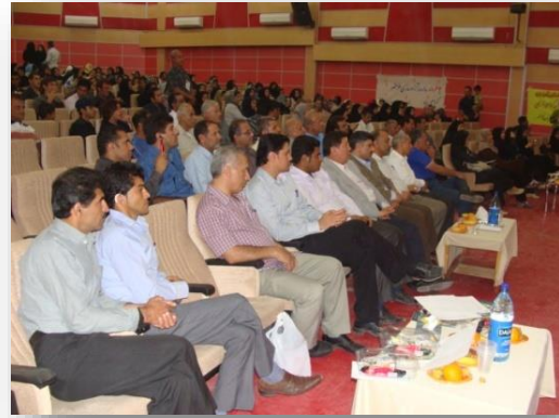
گردش در منطقه جنگی شلمچه و موزه جنگ خرمشهر در مورخه ۹۰/۳/۱۱