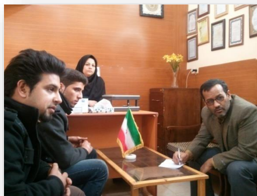
تشکیل کلاسهای عروسک سازی