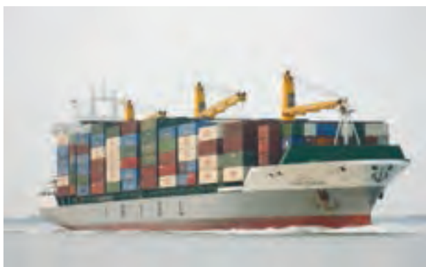
○ حمل بار با کشتی، ایران

آیا می‌دانید حمل و نقل دریایی، بسیار ارزان‌تر از حمل و نقل جاده‌ای تمام می‌شود؟ جابه‌جایی بارهای بسیار سنگین و حجیم، فقط با کشتی میسر است. با کامیون‌ها و تریلی‌ها در حمل و نقل جاده‌ای حداکثر می‌توان باری به وزن صد تن را جابه‌جا کرد ولی به وسیله کشتی صدها هزار تن بار به راحتی حمل و نقل می‌شود. ضمناً جابه‌جایی بار توسط کشتی، محدودیت‌ها و موانع حمل و نقل جاده‌ای را نیز ندارد چون در دریای می‌توان کیلومترها راه را بدون برخورد به مانع طی کرد.