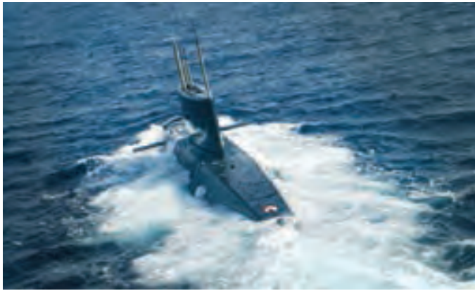
○ زیردریایی ساخت ایران