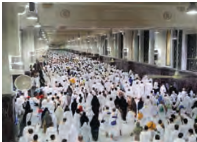
○ مسجد الحرام، سعی صفا و مروه

۳- این منطقه، کانون جهان اسلام است. مکه و مدینه که مقدس‌ترین شهرهای مسلمانان هستند، هر ساله در هنگام مراسم حج، صدها هزار نفر را در خود جای می‌دهند و اجتماع بزرگ و باشکوهی در آنها به وجود می‌آید.