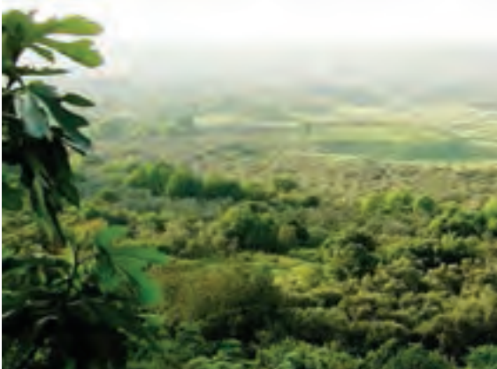
○ باغ‌های زیتون، لبنان

اما سرزمین‌های واقع در اطراف دریای مدیترانه، آب و هوای مدیترانه‌ای دارند. در آب و هوای مدیترانه‌ای زمستان‌ها معتدل و پر باران و تابستان‌ها گرم و خشک است.