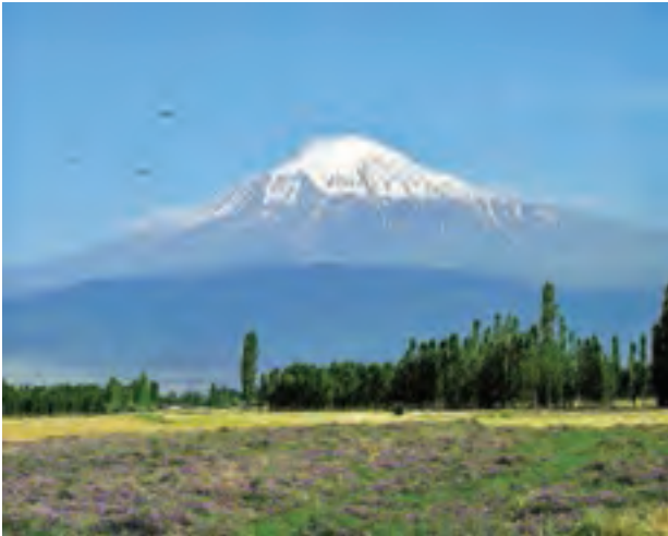
○ کوه آرارات، ترکیه

* در بخش‌های وسیعی از منطقه جنوب غربی آسیا، آب و هوا گرم و خشک یا نیمه خشک حکمفرماست. بیابان‌های وسیع منطقه، آب و هوای گرم و خشک دارند. کمبود آب شیرین یکی از مسائل مهم منطقه جنوب غربی آسیا است که گاهی باعث اختلافات و نزاع‌هایی بین کشورها بر سر منابع آبی رودخانه‌ها شده است.