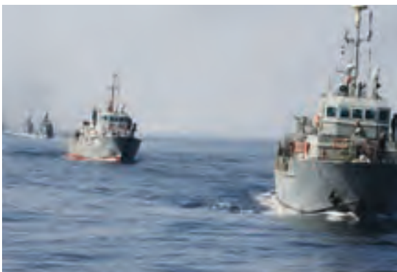
رژه نیروی دریایی جمهوری اسلامی ایران

نیروی دریایی همچنین در مواقعی که برای کشتی‌ها چه در آب‌های ایران و چه در آب‌های بین‌المللی، حوادثی به وجود بیاید، به آنها کمک می‌رساند.