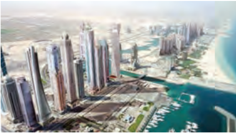
برج‌های تجاری دبی، امارات متحده عربی

* بعضی کشورهای منطقه توانسته‌اند از طریق رونق گردشگری یا تجارت و بازرگانی، اقتصاد خود را متحول کنند و درآمد زیادی به دست بیاورند، مانند ترکیه و امارات متحده عربی.