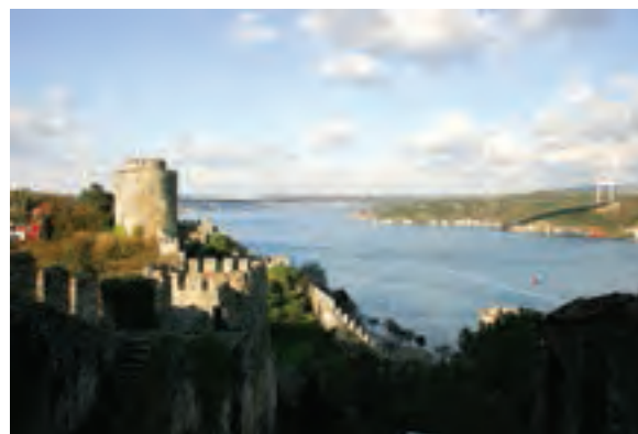
○ تنگه بسفر، ترکیه

۲- این منطقه، انبار مهم منابع انرژی در جهان است. حدود دوسوم ذخایر شناخته شده نفت جهان و حدود یک‌سوم منابع گازی جهان در این منطقه قرار دارد که البته بخش بزرگی از آنها در منطقه خلیج فارس واقع است. کشورهای عمده صادرکننده نفت، مانند: عربستان، ایران، عراق، کویت و امارات متحده عربی در این منطقه واقع هستند. بنابراین، اقتصاد و صنعت جهان به شدت به منابع انرژی در این منطقه از جهان وابسته است.