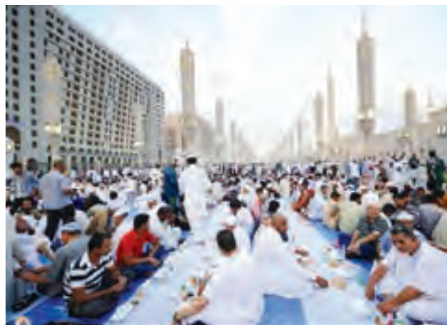
○ مراسم افطاری در مسجد النبی، مدینه

برخی کشورهای منطقه سعی می‌کنند که از طریق پیمان‌های اقتصادی و فرهنگی با یکدیگر، بیشتر همکاری کنند، مانند پیمان سازمان همکاری اقتصادی (اگو) که نخست در سال ۱۳۴۱ بین ایران، پاکستان و ترکیه بسته شد و هم‌اکنون ده کشور منطقه عضو آن هستند.