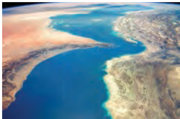
تصویر ماهواره‌ای از تنگه هرمز