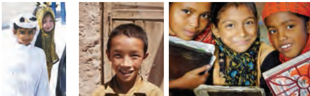
چهره کودکان پاکستانی، افغانی و عرب

منطقه جنوب غربی آسیا یکی از نخستین کانون‌های تمدنی جهان است. سال گذشته با بعضی تمدن‌های باستانی که در ایران و بین‌النهرین شکل گرفته و چند هزار سال قدمت دارند، آشنا شدید. جمعیت: در این منطقه، اقوام گوناگونی زندگی می‌کنند. به نمودار جمعیتی کشورهای جنوب غربی آسیا دقت کنید.