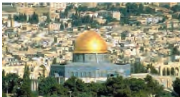
○ بیت المقدس (قدس) مسجد قبة الصخره