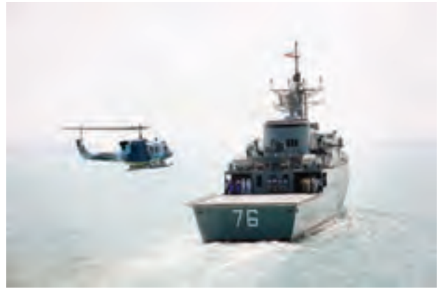
○ ناو جنگی جماران، ساخت ایران