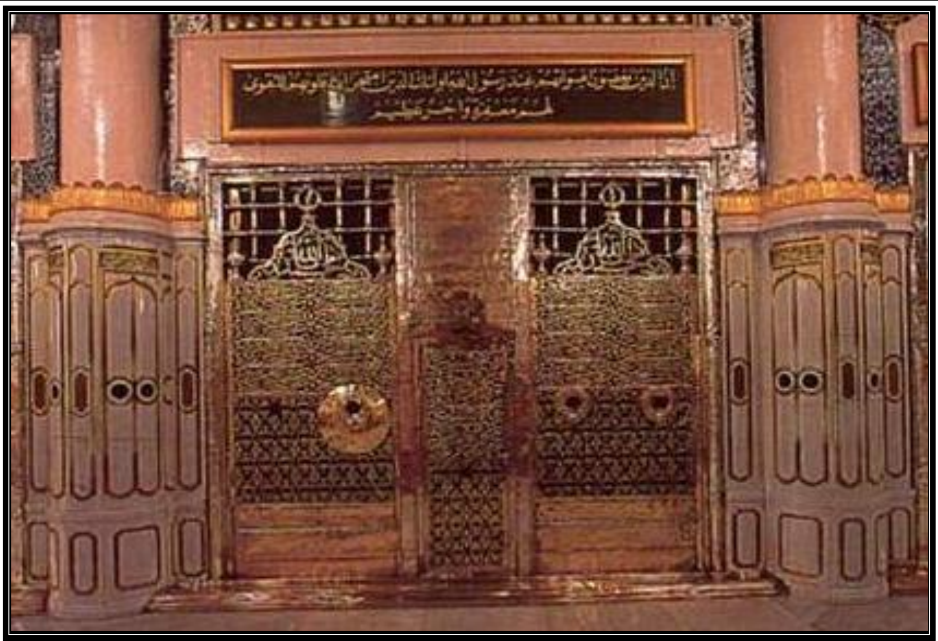
محل دفن عمر