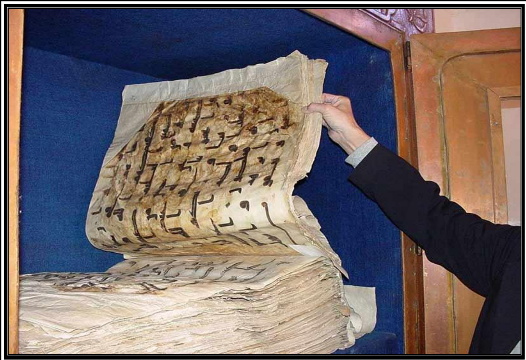
قرآن منسوب به عثمان