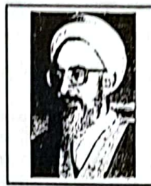
حضرت آیت الله جوادی آملی