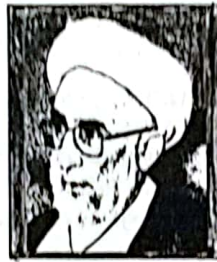
حضرت آیت الله جنتی