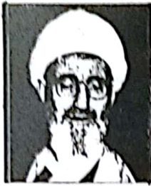
حضرت آیت الله مشکینی