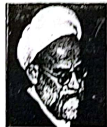
حضرت آیت الله امامی کاشانی

آیت الله امامی کاشانی: ایجاد امنیت سیاسی و اقتصادی در گرو فضای آرام جامعه است. دامن زدن به اختلافات خیانت به اسلام و انقلاب اسلامی است. آیت الله جوادی آملی: در نظام اسلامی شخص حاکم نیست بلکه ولایت، نفاذ و عدالت که همان ولایت فقیه است حاکم است. آیت الله جنتی: مسؤلان کشور هیچگاه فراموش نکنند که عده ای اصرار دارند گذشته را به فراموشی بسپارند.