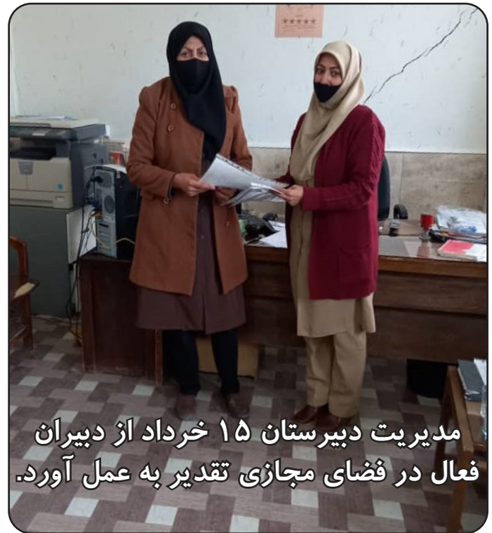
مدیریت دبیرستان ۱۵ خرداد از دبیران فعال در فضای مجازی تقدیر به عمل آورد.

اوقات فراغت تابستانی پر کردن اوقات فراغت دانش آموزان در ایام تابستان به صورت یک معضل برای خانواده ها تبدیل شده است. برخی افراد فکر می کنند فراغت برابر با بیکاری است در حالی که اوقات فراغت از جمله زمان های با ارزش زندگی انسان است. دانش آموزان در ایام فراغت می توانند به کارهایی که علاقه دارند بپردازند و تجربیات خوبی به دست آورند. برخی اوقات فراغت را با کتاب خواندن و یا فیلم دیدن پر می کنند اکثر دانش آموزانی که کتاب زیاد می بینند در آینده نثر قوی دارند و توانمندی بالایی در سخنوری کسب می کنند. کلاس های آموزش زبان و یا کلاس های تقویتی درسی هم در این ایام طرفداران خاص خودش را دارد. بهترین کاری که می شود انجام داد این است که قبل از اینکه دانش آموزان را به کلاسی بفرستیم از خود او سوال کنیم که به چه موضوعاتی علاقه مند است و اگر او خودش هنوز دیدگاهی از علاقه مندی اش ندارد و نمی داند چه باید بکند خودمان با پرس و جو و شناختی که از فرزندمان داریم اوقات فراغت را پر کنیم. به این نکته توجه کنید قرار نیست دانش آموز شما با گذراندن یک دوره ی سه ماهه تمامی فنون و یا اطلاعات را کسب کند. بعد از پایان دوره از دانش آموزان انتظار در آن زمینه استاد شده باشد. این جمله که این همه کلاس رفتی چی یاد گرفتی یک آفت بزرگ است و انگیزه را از دانش آموز می گیرد. سعی کنیم همواره دانش آموزان را تشویق کنیم حتی اگر نتیجه ی خوبی نگرفت باز هم او را تشویق کنیم. تشویق کردن به دانش آموز انگیزه می دهد و کمک می کند تلاشش را در آن زمینه زیاد کند. سعی کنیم با فکر و تحقیق اوقات فراغت فرزندمان را پر کنیم و به علایق و تصمیماتشان جهت دهیم.