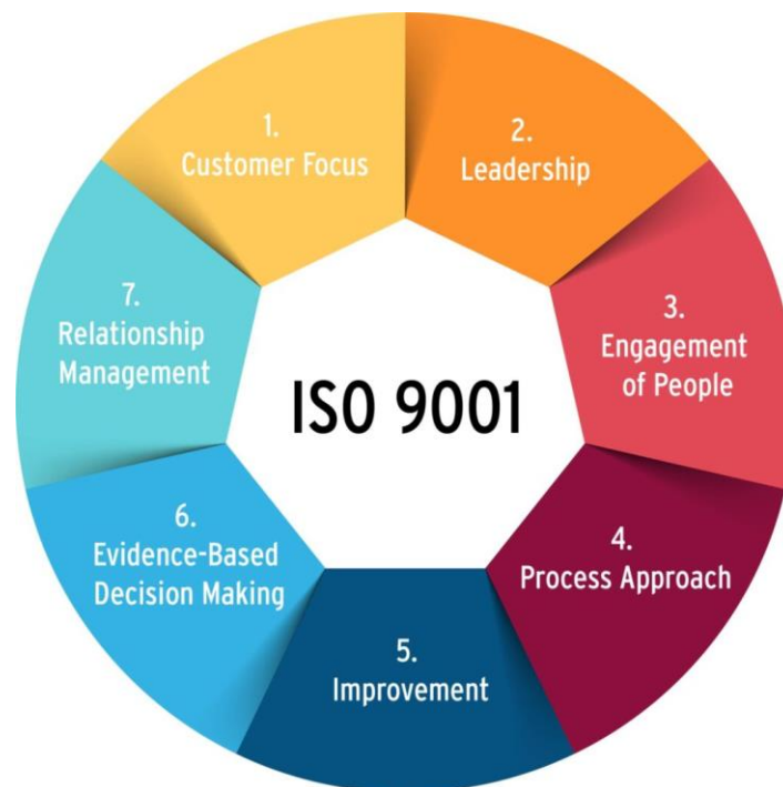
اصول ISO 9001