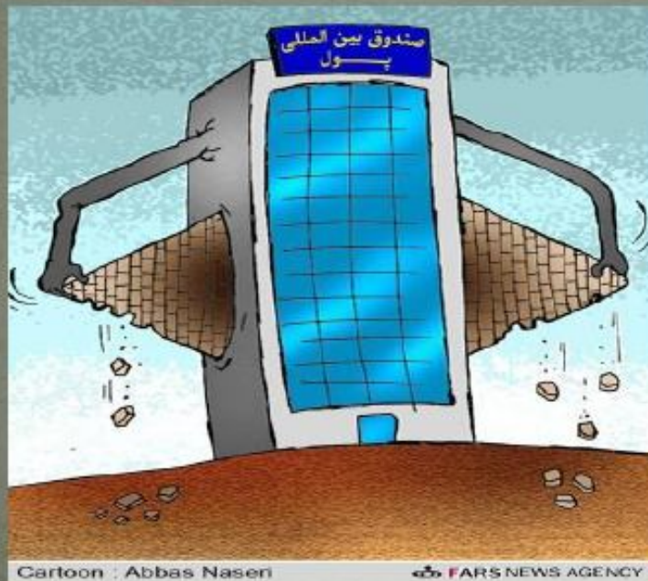
Cartoon : Abbas Naseri

برای رشد و توسعه اقتصاد جهانی لازم است تا مدیریت سیستم مالی و ارزی بین الملل متناسب با نیازهای مالی کشورها صورت گیرد.