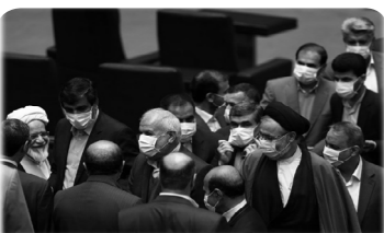
حضور نمایندگان خوزستان پا ماسک