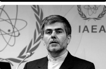
تکمیل «راکتور اراک» تعطیل شده است!!