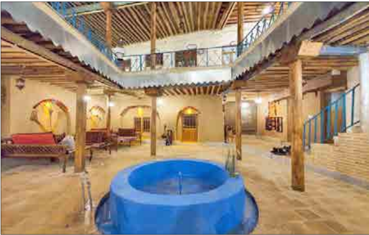
مدیرکل استاندارد کرمانشاه خبر داد؛