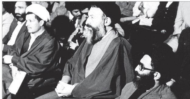
آیت... خامنه‌ای و مر حوم آیت... بهشتی و مر حوم آیت... هاشمی رفسنجانی در یکی از جلسات حزب جمهوری، اسفند ۱۳۵۷. این مناسبت انتصاب شهید بهشتی به سمت رئیس دیوان عالی کشور است. امام خمینی

۲۲۰ نسخه از نشریه خط حزب... شماره‌ی ۷۰ در مصلی نماز جمعه شهرستان نهاوند توزیع شد.