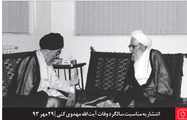
انتشار به مناسبت سالگرد وفات آیت‌الله مهدوی کنی ۲۹ مهر ۹۳