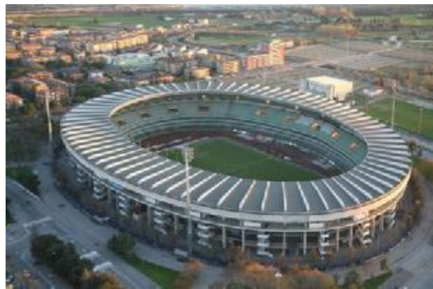
تصویر 3: رنتسو پیانو، دید عمومی استادیوم ورونا، ورونا - ایتالیا

استفاده از خانواده خاصی از فرمها یا به کارگیری شیوه‌های ویژه ترکیب و تکمیل فرمها به مهارت نیاز دارد. مثالی می‌زنم: چنانچه خواسته باشیم از فراکتالها در طراحی استفاده کنیم ضروری است قابلیت‌های شکلی فراکتالهای را کاملاً تجربه کرده باشیم. کسب چنین مهارتی در بسیاری از موارد در خارج از محدوده پروژه‌های دفتری صورت می‌پذیرد.